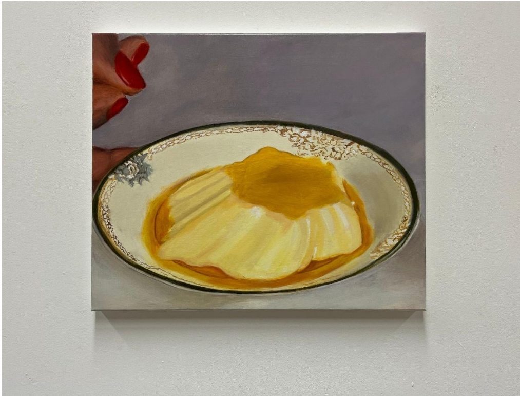
εικόνα 17 Untitled , 2025, oil on canvas, 50 x 60 cm