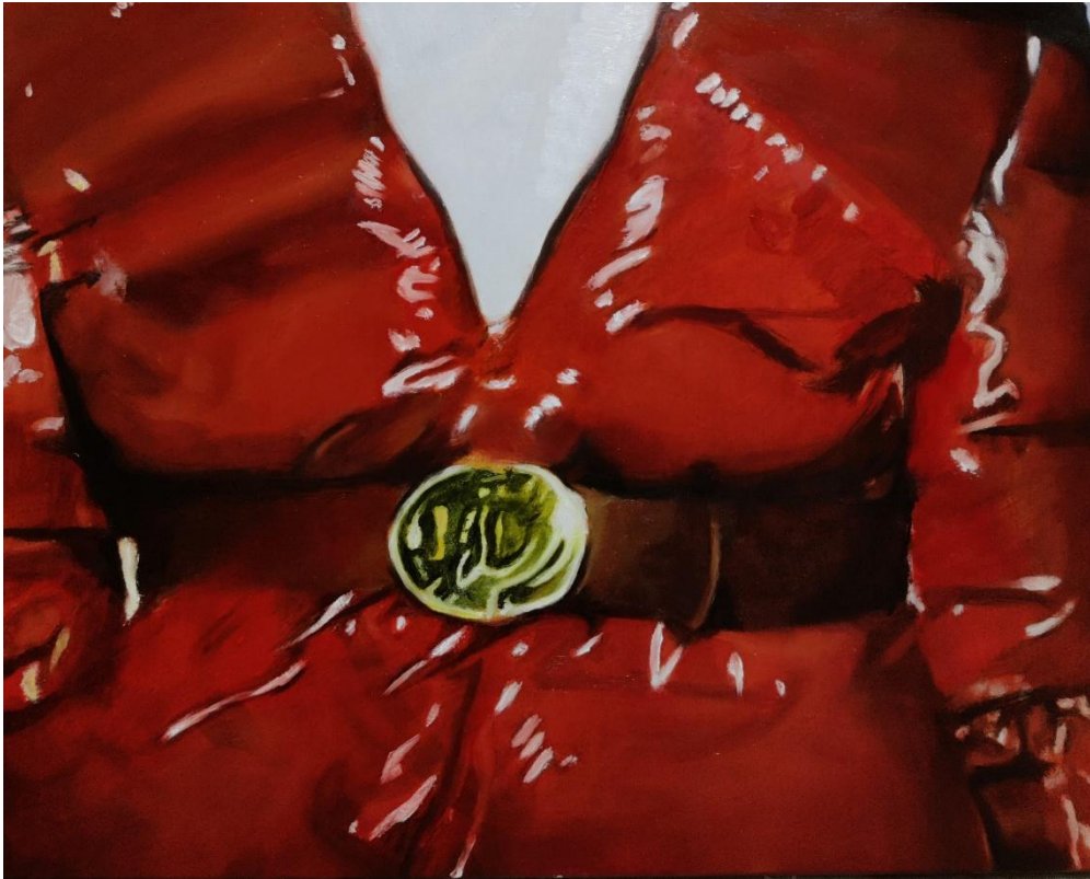
εικόνα 19 MYSTYLEROCKS , 2023, oil on canvas, 40 x 50 cm