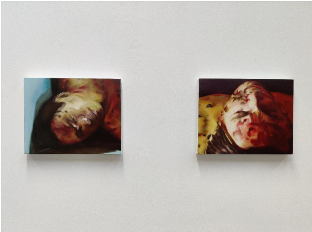
εικόνα 20 Untitled , 2023, oil on canvas 36 x 28.5 cm