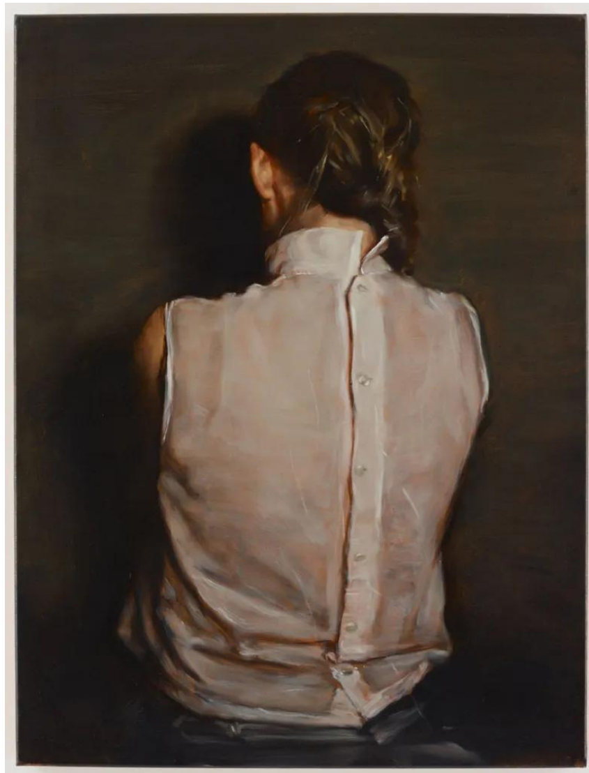
εικόνα 7 Michaël Borremans, The Ear (II) , 2011, oil on canvas, 105 x 80 cm

Η προσέγγισή μου παρουσιάζει αναλογίες με τη δική του πρακτική, καθώς και εγώ επιλέγω «φτωχές» εικόνες από το διαδίκτυο, τις απογυμνώνω από το αρχικό τους πλαίσιο και τις μεταφράζω ζωγραφικά, δημιουργώντας νέες αφηγήσεις. Και στις δύο περιπτώσεις, η απουσία ευκρίνειας και λεπτομερειών ενισχύει το αίσθημα της αποστασιοποίησης, αφήνοντας χώρο για την υποκειμενική πρόσληψη του θεατή.