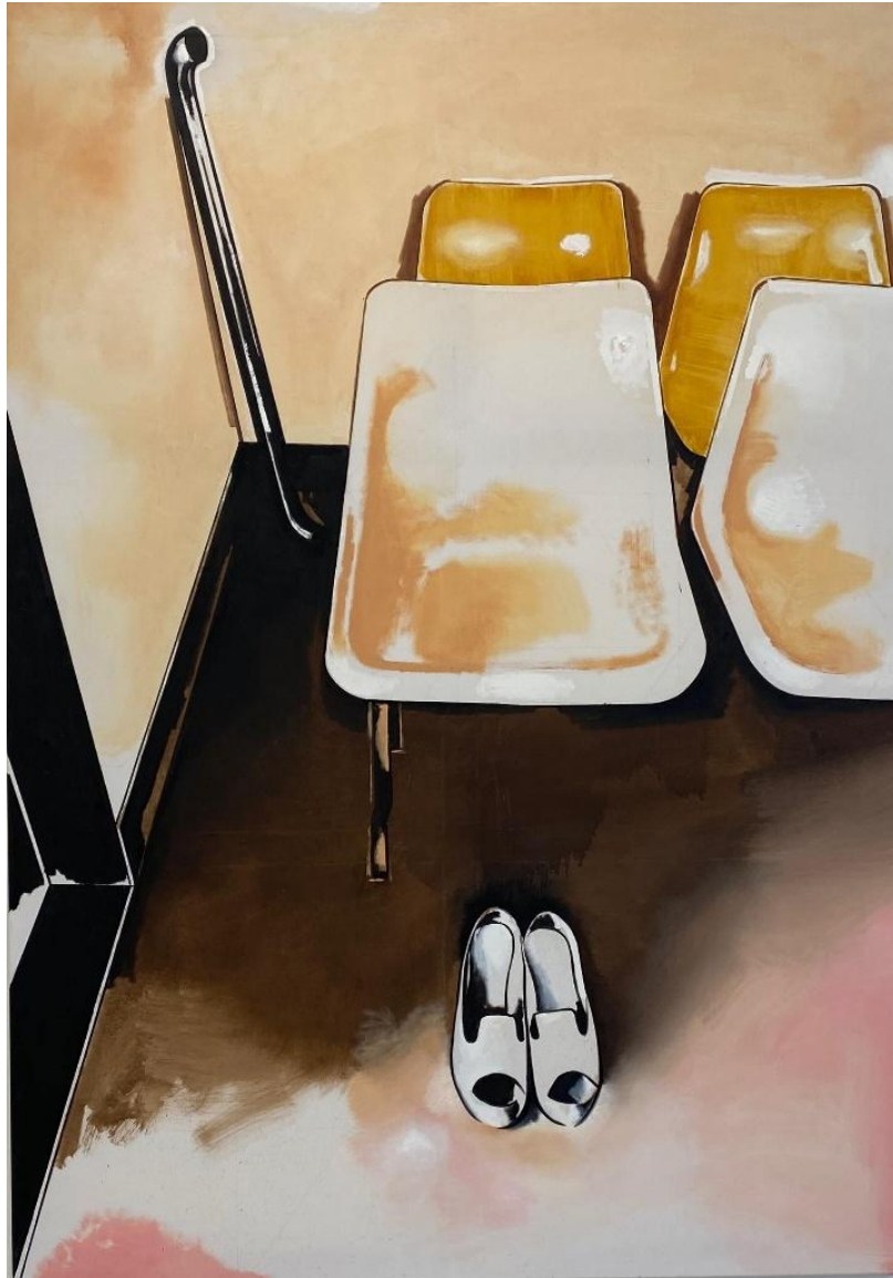
εικόνα 5 Wilhelm Sasnal, άγνωστος τίτλος, 2020, oil on canvas, άγνωστες διαστάσεις

Η χρήση μπανάλ εικόνων στη ζωγραφική του σχετίζεται με τον τρόπο που το βλέμμα μας προσπερνά ή αποθηκεύει ασυναίσθητα οπτικές πληροφορίες. Με λιτά μέσα, μειωμένη χρωματική παλέτα και φαινομενικά ουδέτερο ύφος, δημιουργεί έργα που λειτουργούν ως εύθραυστα απομεινάρια της οπτικής μας κουλτούρας. Αυτός ο μηχανισμός επεξεργασίας και επανερμηνείας βρίσκει αναλογίες και στη δική μου πρακτική, καθώς επιλέγω εικόνες που συνήθως περνούν απαρατήρητες, τις αποκόπτω από το αρχικό τους περιβάλλον και τις μετατρέπω σε ζωγραφικά αντικείμενα ανοιχτά σε νέες αναγνώσεις.