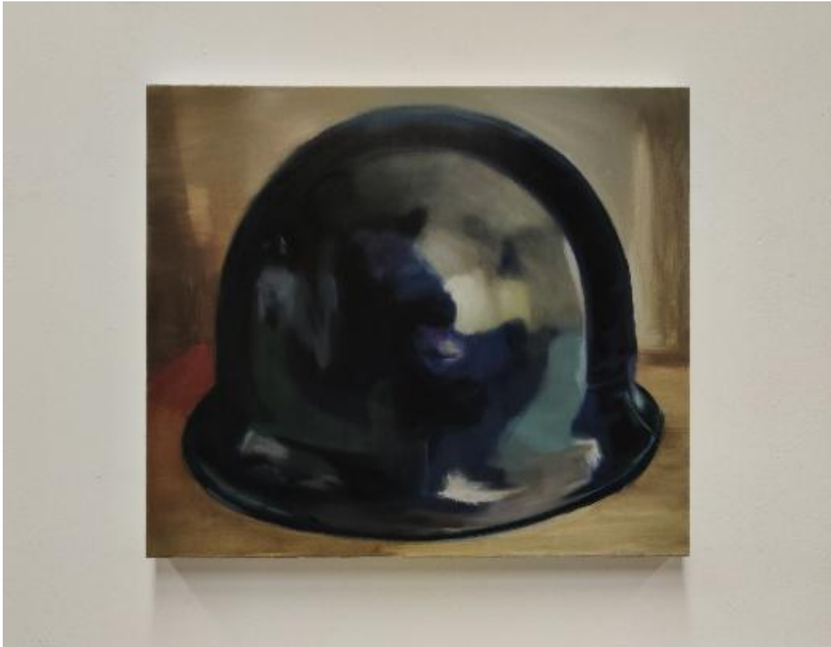
εικόνα 9 It Keeps coming back , 2024, oil on canvas, 50 x 60 cm

καλείται να αναζητήσει τον χώρο που αντανακλάται σε αυτή την επιφάνεια, να προσπαθήσει να διακρίνει τι μπορεί να βρίσκεται πέρα από τον καμβά. Σε αυτή την απόπειρα ανάγνωσης του «εκτός», το έργο λειτουργεί ως ένα οπτικό και νοητικό αίνιγμα: τι υπάρχει απέναντι; Τι δεν φαίνεται, αλλά υπονοείται; Η απουσία εικόνας γίνεται η ίδια ένα πεδίο προβολής.