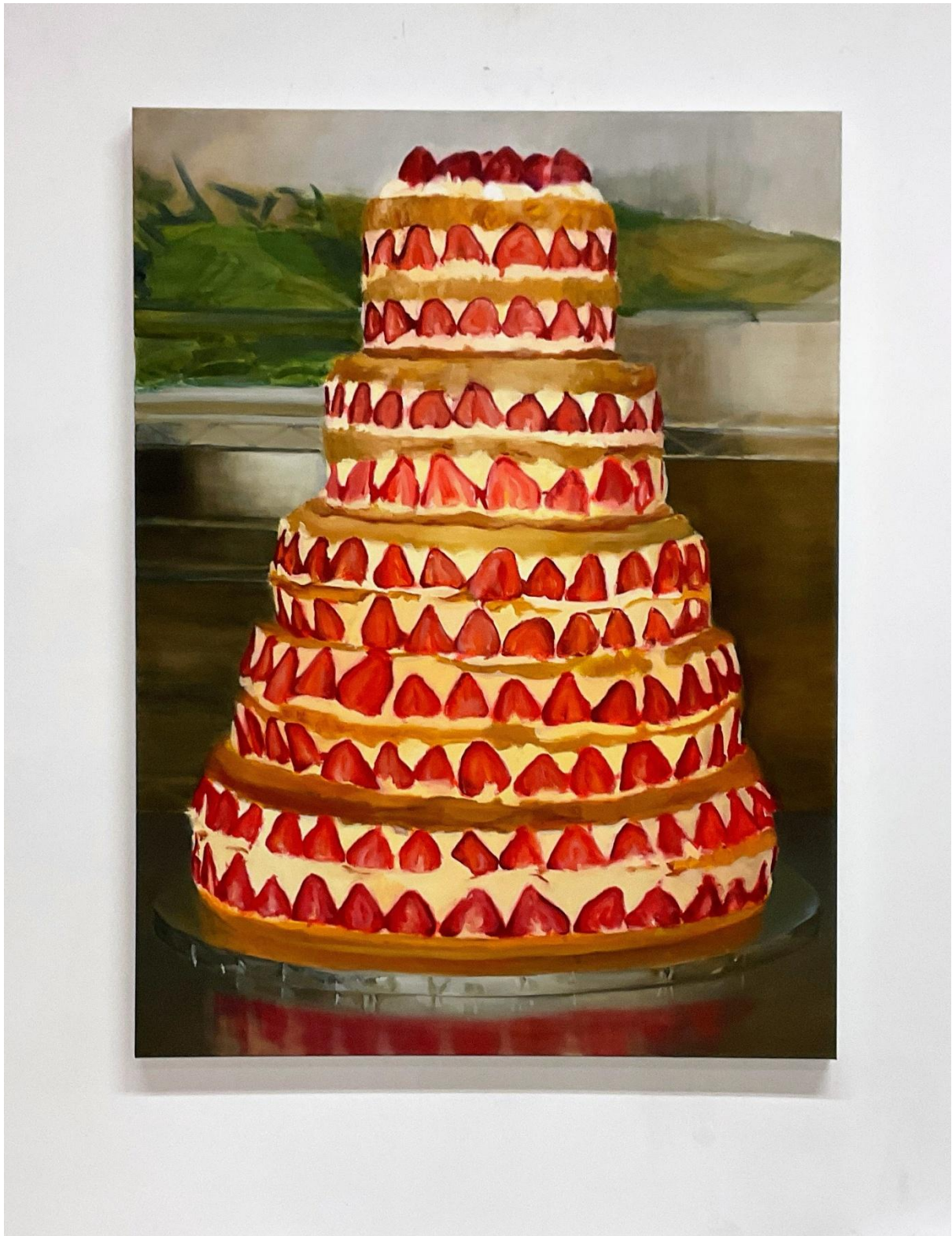
εικόνα 15 The (Little) Tower , 2025, oil on canvas, 82 x 110 cm

Στο έργο The (Little) Tower έχω ζωγραφίσει μια τούρτα. Ήταν πάντα μια σκέψη μου να δημιουργήσω μια έκθεση όπου, με το που μπαίνει ο θεατής, το πρώτο πράγμα που αντικρίζει να είναι μια μεγάλη τούρτα, ένα στοιχείο που ισορροπεί ανάμεσα στο εορταστικό και το γκροτέσκο.