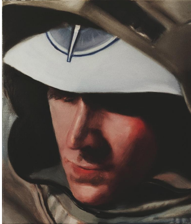
εικόνα 11 The death blossom , 2023, oil on canvas, 24.5 x 28.5 cm

Το ζωγραφικό έργο The Death Blossom βασίζεται σε μια σκηνή από την ταινία The Last Starfighter (1984), μία από τις πρώτες δύο στην ιστορία του κινηματογράφου που έκανε χρήση CGI. Είναι ένα screenshot από το φιλμ (Castle, 1984). Σύμφωνα με τη μεθοδολογία μου, η εικόνα έπειτα από ψηφιακή επεξεργασία αποκόπηκε από το αρχικό της πλαίσιο για να απομακρυνθεί από το αφηγηματικό της περιεχόμενο.