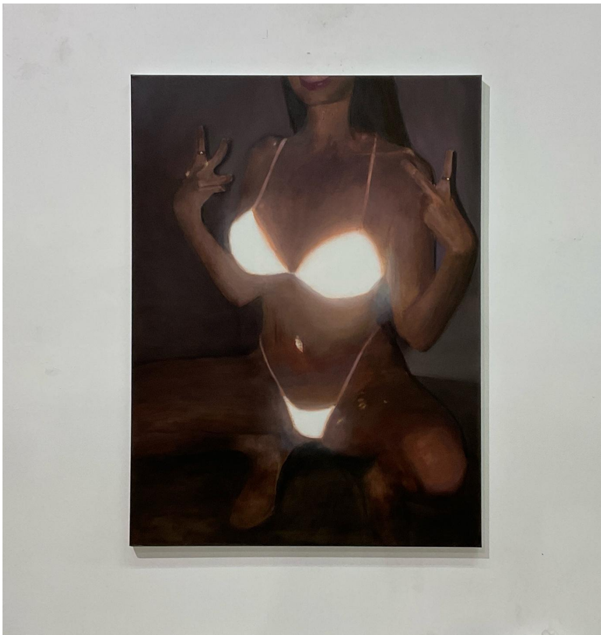
εικόνα 14 Flashing Girl (Sonia) , 2024, oil on canvas 82 x 110 cm

Το έργο Flashing Girl (Sonia) βασίζεται σε μια εικόνα από το αρχείο μου, όπου μια κοπέλα ποζάρει χαρακτηριστικά, φορώντας ένα μπικίνι από ανακλαστικό ύφασμα που φέγγει έντονα. Μέσα από μία διαδικασία έχουν τονιστεί επιλεκτικά στοιχεία της εικόνας, μεταβάλλοντας την αρχική της σημασία. Η προέλευσή της παραμένει ανοιχτή, καθώς θα μπορούσε να ανήκει σε ένα ευρύ φάσμα συγκειμένων, από την πορνογραφία και τα τηλεπαιχνίδια μέχρι φοιτητικά πάρτι, κινηματογραφικές σκηνές, προσωπικές στιγμές, διαφημίσεις ή ακόμα και memes.