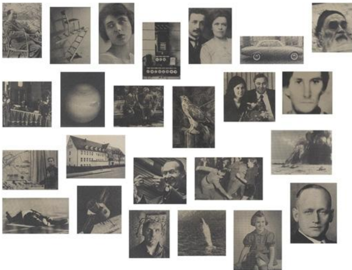
Εικόνα 3 Thomas Ruff Zeitungsfotos

Ο Thomas Ruff μέσω της χρήσης κοινότυπων εικόνων στις σειρές του, εξερευνά τα όρια της φωτογραφίας. Στη σειρά Zeitungsfotos (Φωτογραφίες Εφημερίδων), ο Ruff έπαιρνε εικόνες από εφημερίδες, τις φωτογράφιζε ξανά και τις μεγέθυνε, απομονώνοντάς τες από το κείμενο. Έτσι, η φωτογραφία αποσυνδέεται από το αρχικό της πλαίσιο, μετατρέποντας τον θεατή από αναγνώστη σε παρατηρητή που καλείται να ερμηνεύσει το περιεχόμενο χωρίς καμία πληροφορία να καθοδηγεί τη σκέψη του.