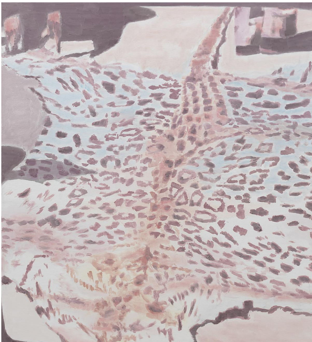
εικόνα 6 Luc Tuymans, Leopard , 2000, oil on canvas, 140 x 128.3 cm

Ο Luc Tuymans αναζητώντας αν μπορεί η σύγχρονη ζωγραφική να αναπαραστήσει το σύγχρονο ιστορικό γεγονός, χρησιμοποιεί κοινότοπες, φαινομενικά ασήμαντες εικόνες, τις οποίες μετασχηματίζει μέσα από μια αποστασιοποιημένη, συχνά ψυχρή ζωγραφική προσέγγιση. Αντλώντας υλικό από φωτογραφίες, ντοκουμέντα, τηλεοπτικά στιγμιότυπα και τυχαίες απεικονίσεις, αφαιρεί λεπτομέρειες, μειώνει την ευκρίνεια, δημιουργώντας μια αίσθηση ασάφειας και αβεβαιότητας (Hudson, 2021).