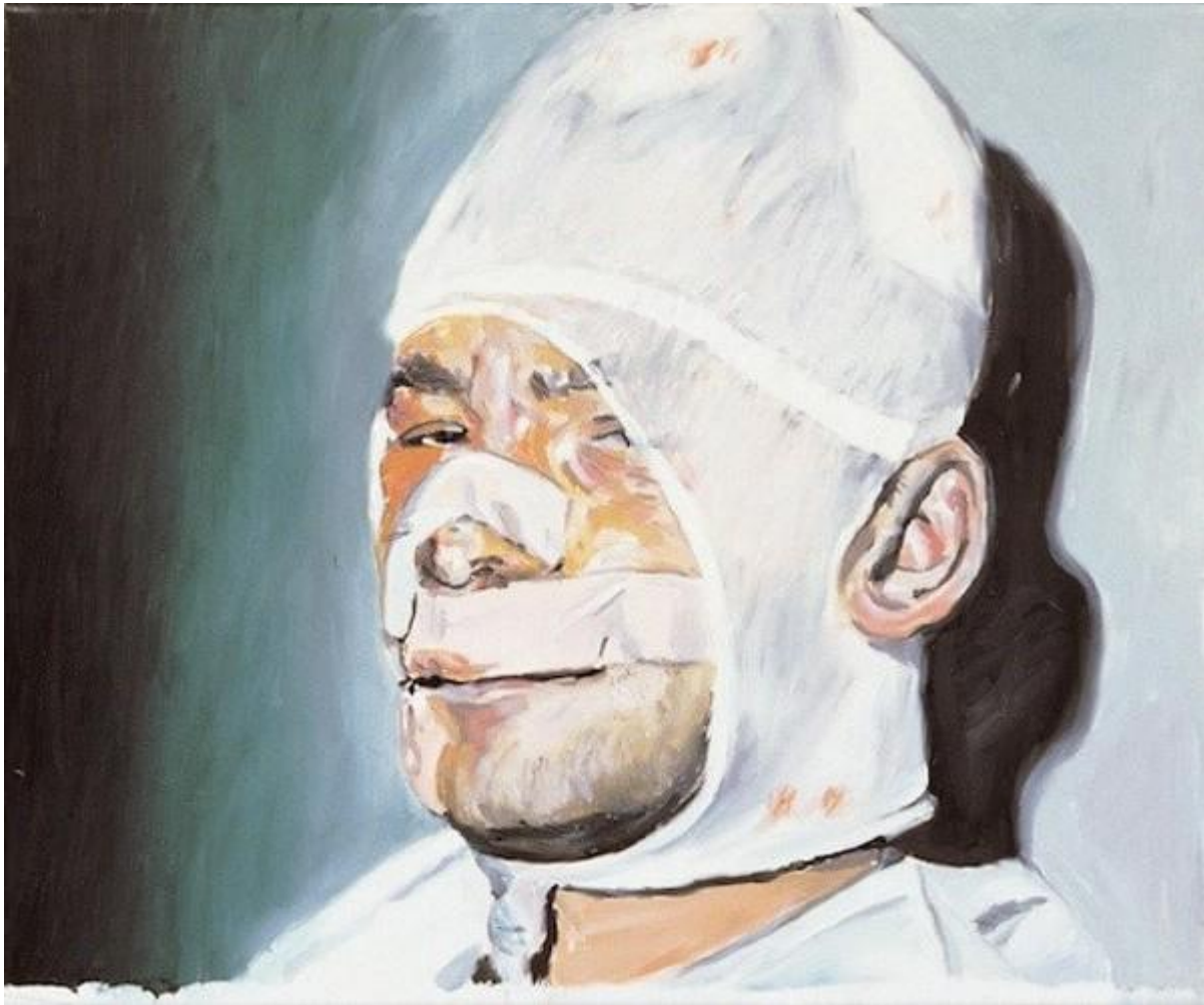
εικόνα 4 Martin Kippenberger, Dialogue with the Youth of Today (detail) , 1981, oil on canvas, 50 x 60 cm

Η σειρά αυτή συγκεντρώθηκε σε ένα βιβλίο που περιλαμβάνει 400 εικόνες, τις οποίες ο Ruff συνέλεξε από γερμανικές εφημερίδες μέσα σε διάστημα δέκα ετών (Ruff, 2014).