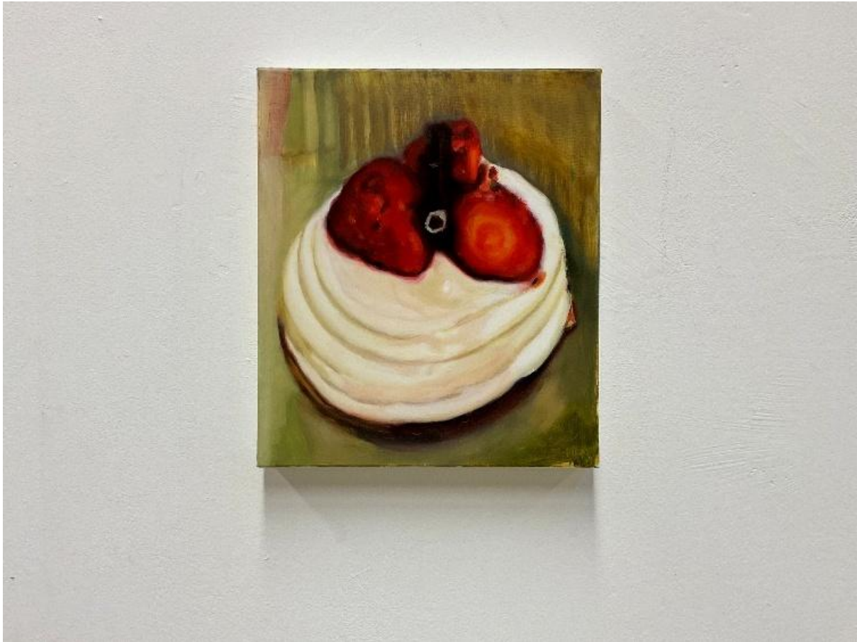
εικόνα 10 A Small, Good Thing , 2024, oil on canvas, 24.5 x 28.5 cm

Συνεπώς, η σχέση μεταξύ εικόνας και θεατή λειτουργεί μέσα από την αναμονή και την υπόθεση, δημιουργώντας έναν χώρο όπου το ορατό και το αόρατο, η μνήμη και η απουσία, η επιθυμία και η αδυναμία διαφυγής συνυπάρχουν, χωρίς ποτέ να διαφεύγουν πραγματικά.