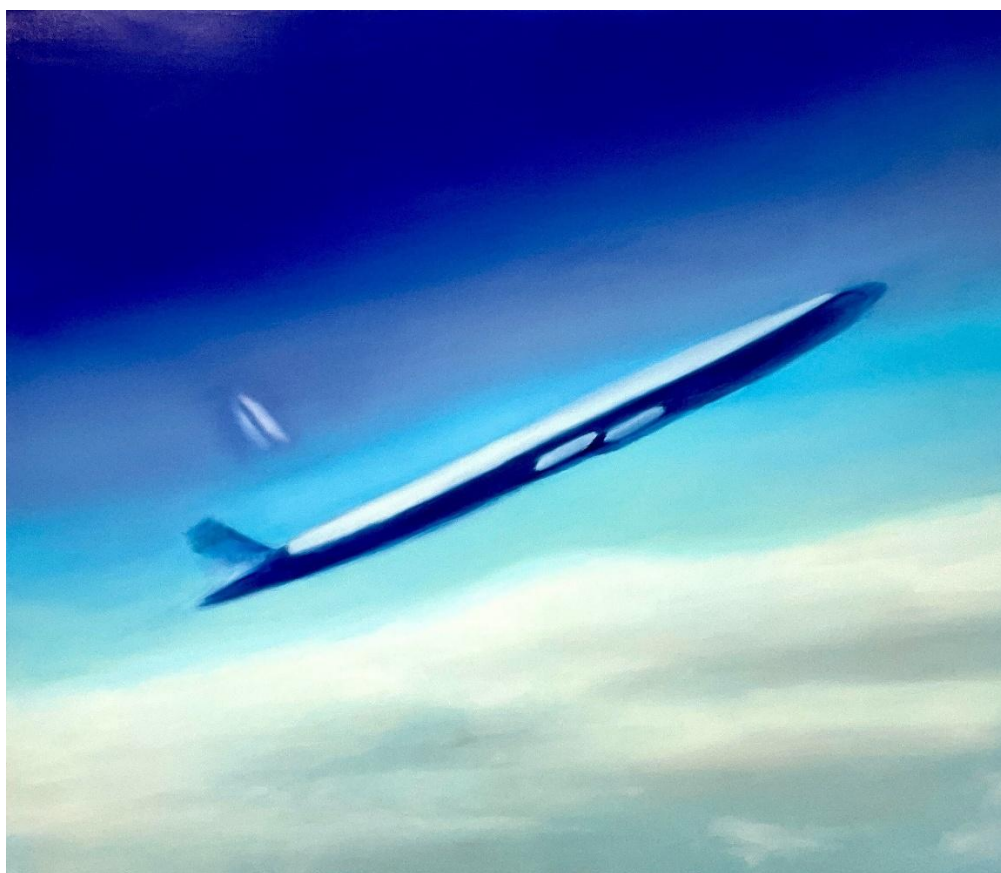
εικόνα 22 Glass Ceiling , 2024, oil on canvas, 120 x 140 cm