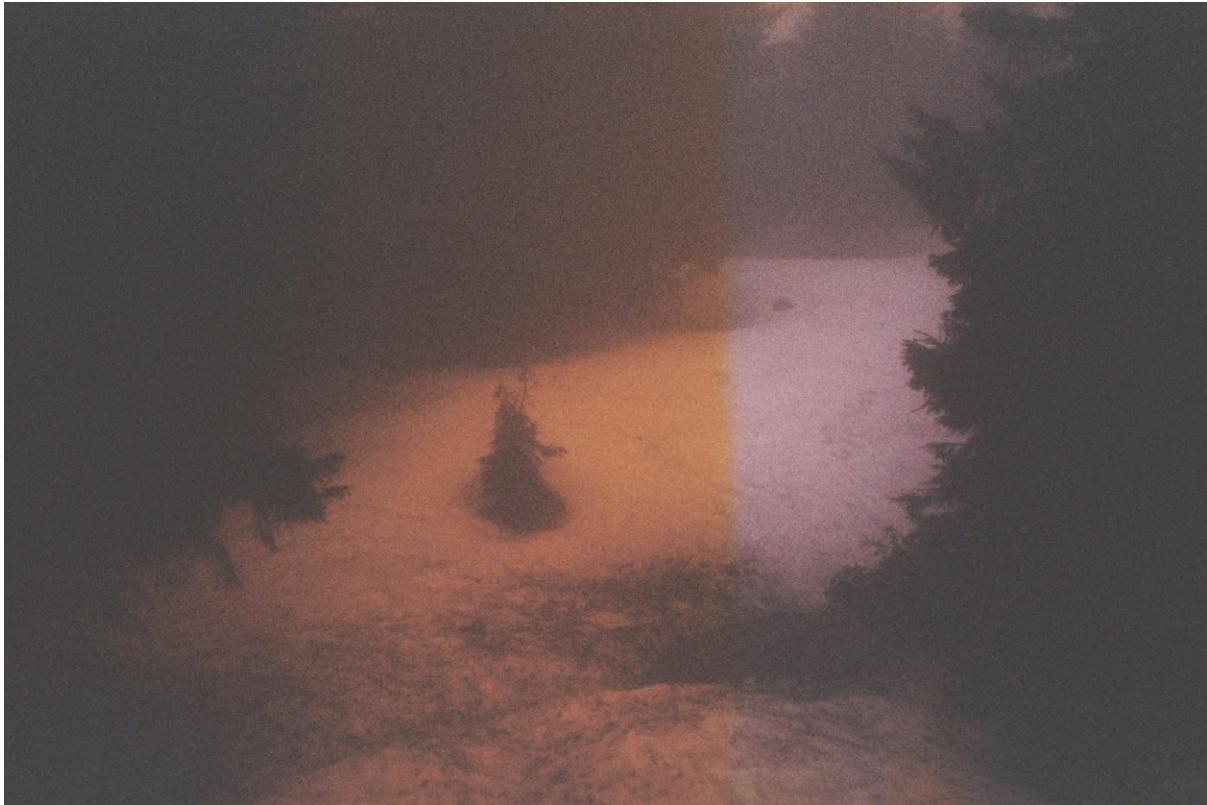
εικόνα 1 Φωτογραφία κλειδί (από το Flickr)

Φωτογραφίες είτε τραβηγμένες με φλας, είτε στο υπέρυθρο φάσμα, από trailcams 1 της νυχτερινής υπαίθρου, από τα κοινωνικά δίκτυα ομάδων κυνηγών. Φωτογραφίες που περνούν απαρατήρητες, δεν τους δίνεται ιδιαίτερη σημασία και είναι εύκολο να ξεχαστούν, να προσπεραστούν σε ένα ασταμάτητο scroll down μπροστά στην οθόνη ενός υπολογιστή ή ενός κινητού. Είναι στο σύνολό τους ασπρόμαυρες.