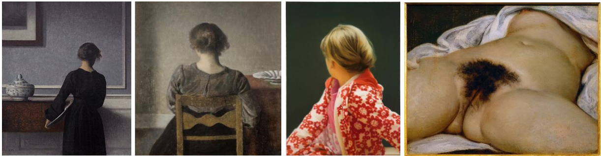
εικόνα 13 Από τον Hammershøi στον Richter και στον Courbet

Από τις αινιγματικές γυναικείες φιγούρες του Wilhelm Hammershøi, που αποπνέουν σιωπή και εσωστρέφεια, έως την Betty του Gerhard Richter, όπου το θολό όριο μεταξύ φωτογραφίας και ζωγραφικής εντείνει την αίσθηση αποστασιοποίησης, η γυναικεία μορφή με στραμμένη την πλάτη προκαλεί τον θεατή να αναρωτηθεί για την ταυτότητα, την αφήγηση και την πρόθεση της απεικόνισης. Παρόμοια αισθητική προσέγγιση συναντάται στο έργο L'Origine du monde του Gustave Courbet, όπου η απουσία προσώπου μετατοπίζει το βλέμμα σε μια πιο ωμή και αποστασιοποιημένη ανάγνωση του γυναικείου σώματος.