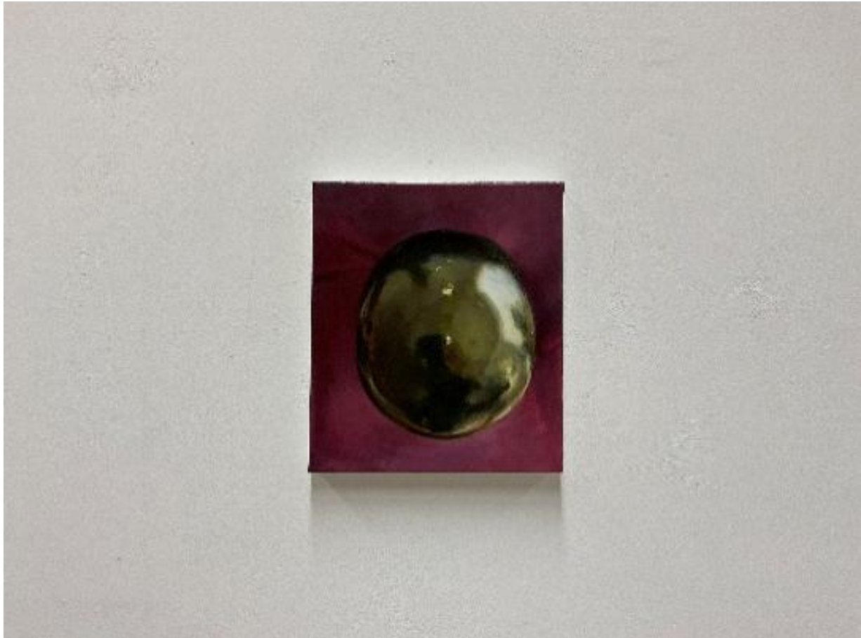
εικόνα 8 Where I'm calling from , 2024, oil on canvas, 24.5 x 28.5cm

Τα δύο ζωγραφικά έργα Where I'm calling from και It keeps coming back τα δημιούργησα ύστερα από την ανάγνωση του διηγήματος Where I'm Calling From του Raymond Carver (Carver, 2018), μια ιστορία που εκτυλίσσεται σε ένα κέντρο αποκατάστασης για άτομα εξαρτημένα από το αλκοόλ. Ο πρωταγωνιστής, εγκλωβισμένος σε έναν ενδιάμεσο χώρο μεταξύ παρελθόντος και μέλλοντος, αναμετράται με τις μνήμες του, τις επιλογές του και την αβεβαιότητα της επόμενης μέρας. Όταν δούλευα το συγκεκριμένο έργο είχα στο μυαλό μου μια επιφάνεια – αντικείμενο σαν «κοίλο καθρέφτη» να λειτουργεί ως πύλη, ως όριο, ως σημείο αναφοράς και απώλειας ταυτόχρονα. Όταν ο καθρέφτης αναπαρίσταται ζωγραφικά το υποκείμενο λείπει και αποδίδεται μόνο το είδωλο με αποτέλεσμα να υπογραμμίζεται το ψευδές της απεικόνισης και η αίσθηση απουσίας όσων αντανακλώνονται. Μέσα σε αυτήν τη συνθήκη, η αντανάκλαση χάνεται και μαζί της κάθε βεβαιότητα. Ό,τι υπήρχε πριν και ό,τι έπεται μοιάζουν εξίσου ασαφή. Πρόθεσή μου ήταν ο θεατής να βρίσκεται αντιμέτωπος με ένα κλειστό σύστημα, έναν χώρο όπου η μνήμη, η ταυτότητα και η επιθυμία διαφυγής συνυπάρχουν, αλλά ποτέ δεν διαφεύγουν πραγματικά. Ο θεατής