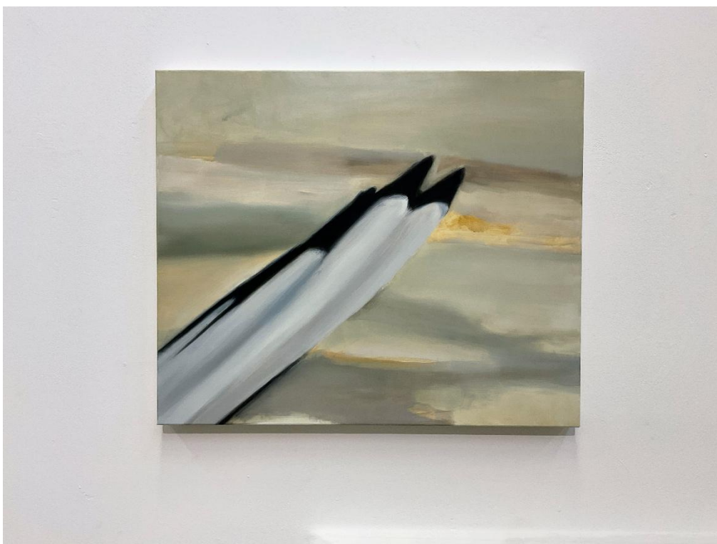
εικόνα 21 Untitled , 2024, oil on canvas, 50 x 60 cm