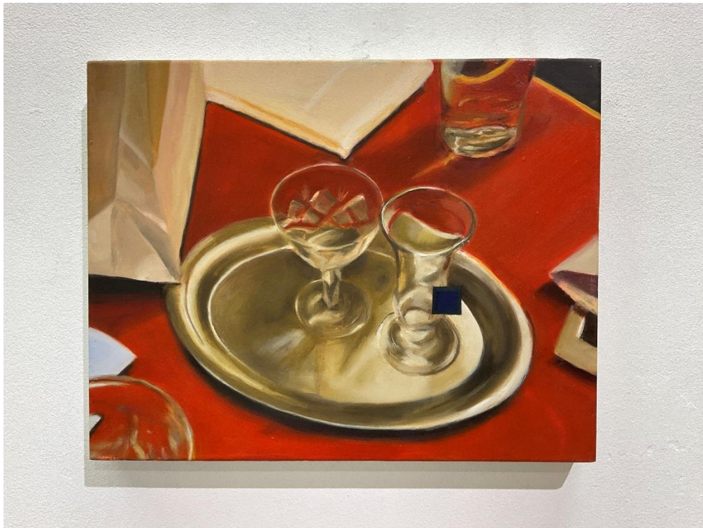
εικόνα 18 Untitled , 2023, oil on canvas, 36 x 28.5 cm