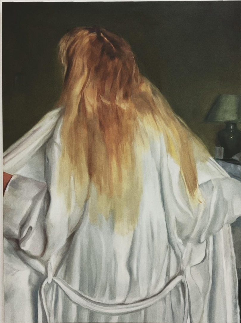
εικόνα 12 Alicia , 2024, oil on canvas, 82 x 110 cm