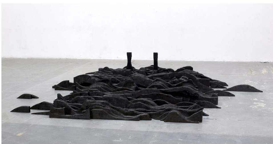
"Breather", φυσικο ξυλο (καμμενο), 2,50 χ 4,35 μετρα, 2023