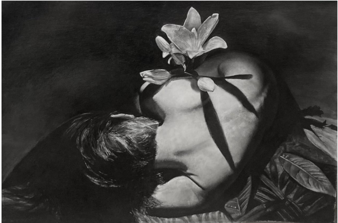
« Water Lily» 2024 , μολύβι σε χαρτί, 70 χ100 cm