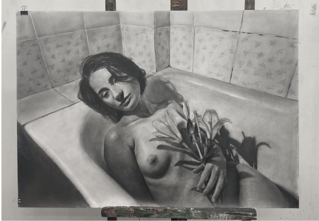
« Orchids» 2024, Μολύβι σε χαρτί , 70x100 cm