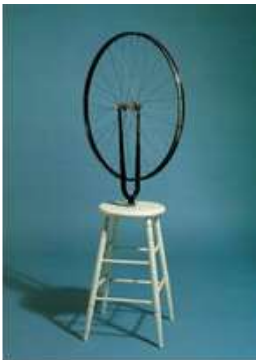
Εικ. 2. Ρόδα ποδηλάτου , 1913, Philadelphia Museum of Art (Μουσείο Τέχνης της Φιλαδέλφειας), Φιλαδέλφεια

αντίληψη του Duchamp για τη δημιουργική πράξη διαβάζοντας το ομώνυμο κείμενό του.