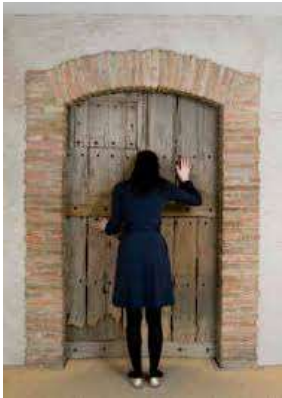
Εικ. 17. Η ατομική θέαση του έργου

δεν μετέρχεται απλά μια εικόνα κατάφορης γυναικείας σεξουαλικότητας – ένα θέμα όχι ασυνήθιστο σε ένα μουσείο ή μια γκαλερί – αλλά συλλαμβάνει τον ίδιο του τον εαυτό να κρυφοκοιτάζει ένα γυμνό το οποίο η ξύλινη πόρτα κρύβει από την κοινή θέα. Σε αντίθεση με το γυμνό ενός ζωγραφικού πίνακα ή ενός γλυπτού τα οποία στο χώρο του μουσείου μπορούν να ειπωθούν από διαφορετικές οπτικές γωνίες, το ενοχλητικά ρεαλιστικό γυμνό του Duchamp «με το χαίνον, άτριχο και, επιπλέον, ερμαφρόδιτο αιδού» 276 είναι ορατό από ένα και μόνο σημείο από μια συγκεκριμένη θέση επιβάλλοντας την ατομική θέαση του έργου. Η ατομική όμως θέαση (εικ. 17, 18) ενός γυμνού γυναικείου σώματος μέσα από την κλειδαρότρυπα φέρνει αναπόδραστα στο νου υπαινιγμούς ερωτικού περιεχομένου και παραπέμπει σε αντίστοιχα θεάματα όπως τα peepshows.