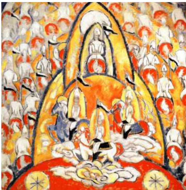
Εικ. 6. Marsden Hartley, The Warriors , 1913, λάδι σε χαλκό, 121,29 x 120,65 εκ., Ιδιωτική Συλλογή

καλλιτέχνης πήρε ένα καθημερινό αντικείμενο και το τοποθέτησε με τρόπο που η χρηστική του σημασία καταργήθηκε υπό τον νέο τίτλο και τη νέα οπτική γωνία.