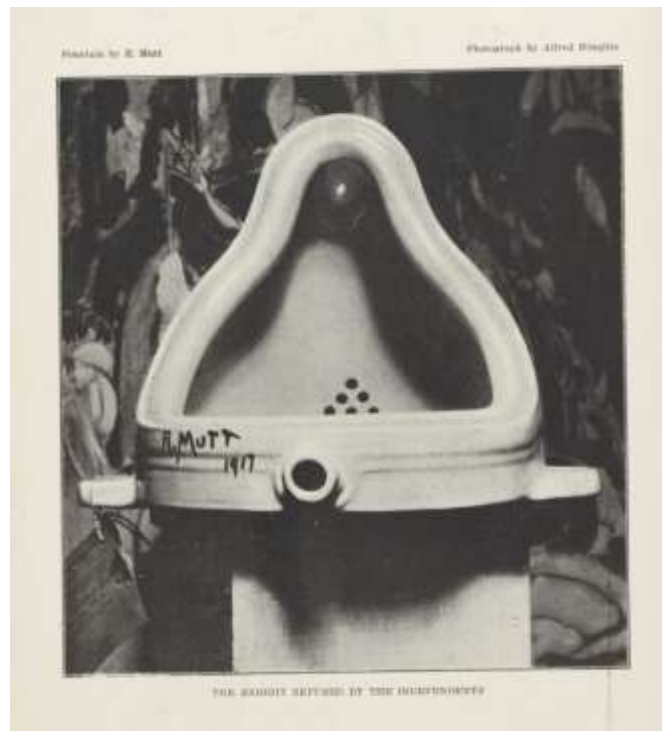
Εικ. 5. Alfred Stieglitz, Φωτογραφία της πρωτότυπης Κρήνης , 1917, όπως δημοσιεύτηκε στον Τυφλό ( The Blind Man ), τεύχος 2, Μάιος 1917

έργο 82 . Την Κρήνη θα υπερασπιστούν το ανυπόγραφο editorial του περιοδικού με τον τίτλο «Η περίπτωση Richard Mutt», ένα κείμενο της Louise Norton με τον τίτλο «Ο Βούδας του λουτρού» και το ποίημα «Για τον Richard Mutt» του ζωγράφου Charles Demuth χωρίς, ωστόσο, να αποκαλύψουν την ταυτότητα του καλλιτέχνη 83 . Μέχρι τότε οπότε και δημοσιεύτηκε φωτογραφία 84 (εικ. 5) του έργου που είχε τραβήξει ο Alfred Stieglitz, το κοινό – παρά το ενδιαφέρον του τύπου – είναι σε θέση να γνωρίζει ελάχιστα για την Κρήνη . Για παράδειγμα, δεν μπορεί να γνωρίζει την αληθινή ταυτότητα του δημιουργού ή ότι πρόκειται για ουρητήρα καθώς τα δελτία τύπου είχαν χρησιμοποιήσει τον αθώο χαρακτηρισμό «υδραυλική εγκατάσταση» και το έργο ούτε εκτέθηκε ούτε καταχωρήθηκε στον κατάλογο της Έκθεσης 85 .