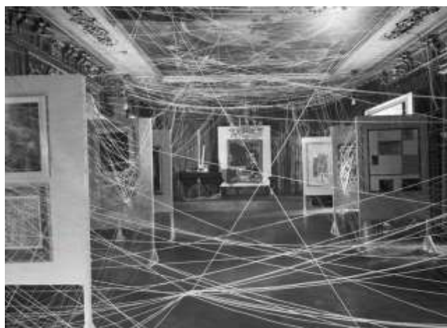
Εικ. 13. Η εγκατάσταση Δεκαέξι μίλια σπάγκου στα Πρώτα Χαρτιά του Σουρεαλισμού, Νέα Υόρκη 1942

Κάτι ανάλογο παρατηρούμε και στα Πρώτα Χαρτιά του Σουρεαλισμού (First Papers of Surrealism, 1942), την πρώτη μεγάλη έκθεση σουρεαλιστικής τέχνης στις Η.Π.Α, την οποία θα σχεδιάσει ο Duchamp ανταποκρινόμενος στη φήμη του εικονοκλάστη που είχε καλλιιεργήσει 248 . Η εγκατάσταση Δεκαέξι μίλια σπάγκου , ένας διασταυρούμενος ανάμεσα στα έργα σπάγκος που εμπόδιζε την άμεση εμπλοκή με την τέχνη (εικ. 13), αλλά και η παρουσία μιας ομάδας παιδιών που με πρωτοβουλία του Duchamp αναπηδούσαν μπάλες και έπαιζαν κουτσό, προκάλεσαν μεγάλη αίσθηση.