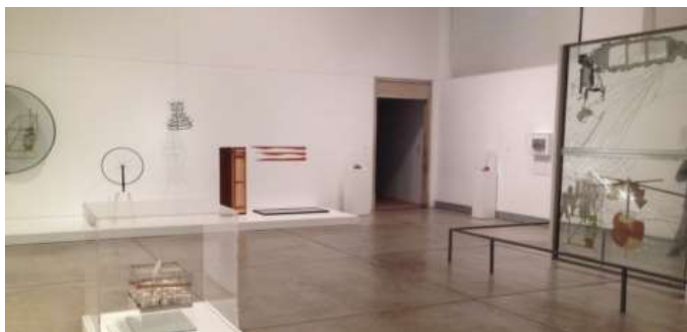
Εικ. 15. Η κύρια αίθουσα της συλλογής Duchamp και στο βάθος η είσοδος στο δωμάτιο των Δεδομένων , Μουσείο Τέχνης της Φιλαδέλφειας

Οι επιλογές αυτές είναι ιδιαίτερα σημαντικές για την κατανόηση του τελευταίου έργου του Duchamp το οποίο συνήθως αντιμετωπίζεται από τους ειδικούς ως μια αισθητική οντότητα περιορισμένη στα φυσικά όρια της εγκατάστασης που έφτιαξε ο καλλιτέχνης. Στην πραγματικότητα το έργο δεν ξεκινάει με την δρύινη πόρτα αν και οι περισσότεροι κριτικοί το προσεγγίζουν όπως θα προσέγγιζαν έναν πίνακα 271 . Αντίθετα θα πρέπει να ειπωθεί ως μια δίχωρη κατασκευή η οποία περιλαμβάνει όχι μόνο ό,τι βρίσκεται πίσω από την παλιά ξύλινη πόρτα αλλά και το χώρο του δωματίου έξω από αυτή. Από πρακτική σκοπιά, το χωρίς φωτισμό δωμάτιο στο οποίο περνάει ο επισκέπτης από την αίθουσα της υπόλοιπης συλλογής του Duchamp (εικ. 15), όπου έχει προηγουμένως μνηθεί στην καλλιτεχνική νομιμοποίηση παλαιότερων έργων του καλλιτέχνη όπως τα ready-made(s), παρέχει ένα ιδανικό περιβάλλον για τη θέαση των Δεδομένων ειδικά λόγω του σκοταδιού που αναδεικνύει ακόμα περισσότερο το φωτισμένο εσωτερικό της εγκατάστασης 272 .