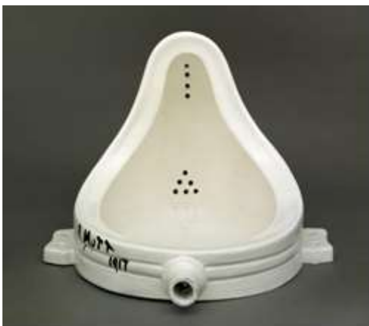
Εικ. 4. Κρήνη , 1964, αντίγραφο του πρωτοτύπου του 1917, πορσελάνη, 36× 48 × 61εκ., Tate Modern, Λονδίνο

Το πιο γνωστό ready-made του Duchamp είναι η λεγόμενη Κρήνη ( Fountain , εικ. 4 ), μια λεκάνη από ανδρικά ουρητήρια την οποία αναποδογύρισε ακυρώνοντας την χρηστική της λειτουργία και υπέγραψε με το όνομα «R. Mutt» 73 . Το έργο θα προκαλέσει ένα πραγματικό σκάνδαλο στην πρώτη Έκθεση της Εταιρείας Ανεξάρτητων Καλλιτεχνών που πραγματοποιήθηκε στη Νέα Υόρκη τον Απρίλιο του 1917 74 . Τα μέλη της επιτροπής θα διαφωνήσουν έντονα μεταξύ τους, θα το αντιμετωπίσουν με αμηχανία και τελικά, όπως θα πει αργότερα ο Duchamp, θα το «καταργήσουν» τοποθετώντας το για το υπόλοιπο της Έκθεσης πίσω από ένα παραβάν 75 . Το 2004, σχεδόν εννέα δεκαετίες αργότερα, η αναποδογυρισμένη λεκάνη ψηφίστηκε ως το πιο επιδραστικό έργο τέχνης του 20ού αιώνα και παραμένει μέχρι σήμερα ένα από τα πιο πολυσυζητημένα και μελετημένα αντικείμενα της ιστορίας της τέχνης 76 .