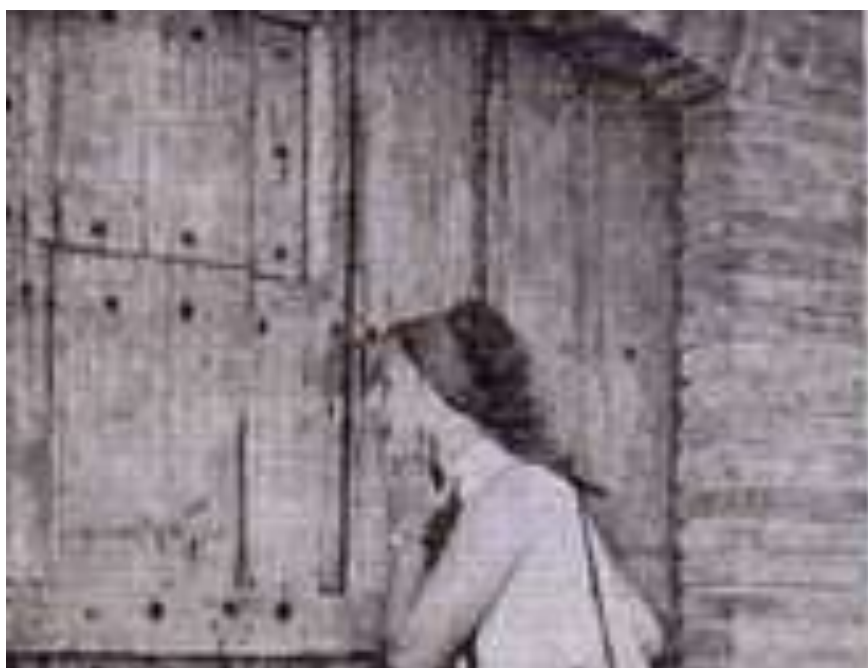
Εικ. 19. Η αναστάτωση του ανυποψίαστου θεατή όταν βλέπει μέσα από τις χαραμάδες των Δεδομένων . Η γυναίκα ακουμπά με τα χέρια το πρόσωπο της σαν να αδυνατεί να πιστεψει αυτό που βλέπει ενώ το στόμα της έχει μείνει ανοιχτό από την έκπληξη

Η αμηχανία η οποία δημιουργείται στον μέχρι πριν από λίγο ανυποψίαστο παρατηρητή επιτείνεται μόλις στρέψει το πρόσωπό του πίσω για να διαπιστώσει σαστισμένος ότι έχει ο ίδιος μεταβληθεί σε έκθεμα, σε αντικείμενο θέασης για τους υπόλοιπους επισκέπτες που βρίσκονται την ίδια στιγμή στο δωμάτιο περιμένοντας τη σειρά τους. Την αμηχανία του παρατηρητή γρήγορα διαδέχεται η ντροπή γιατί ο ίδιος έχει μετατραπεί σε ηδονοβλεψία-πορνολάγνο που τον έχουν πιάσει να «κοιτάει» το εσωτερικό της εγκατάστασης. Η αναστάτωση του ανυποψίαστου θεατή όταν βλέπει μέσα από τις χαραμάδες των Δεδομένων αποτυπώνεται με μοναδικό τρόπο στην εικ. 19 .