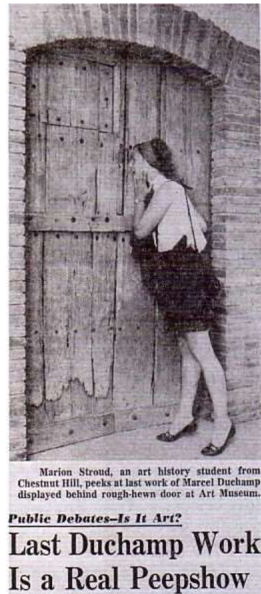
Εικ. 18. Απόκομμα εφημερίδας που παρομοιάζει τα Δεδομένα με peepshow. Philadelphia Inquirer , 8/07/1969

Αντιστρέφοντας τη συνηθισμένη εκθεσιακή πρακτική των μουσείων όπου οι θεατές αποτελούν μέλη μιας ανώνυμης ομάδας η οποία προσφέρει συλλογικό άλλοθι