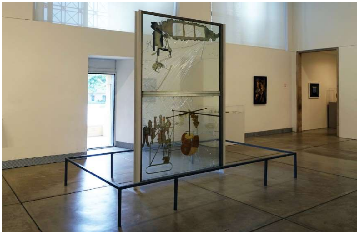
Εικ. 3. Το Μεγάλο γυαλί , λάδι, μολυβδος, σύρμα και σκόνη σε δύο γυάλινα πάνελ 1915-1923, 277,5 x 175,9 εκ., Philadelphia Museum of Art (Μουσείο Τέχνης της Φιλαδέλφειας), Φιλαδέλφεια

έναν οργανισμό για την προώθηση των τεχνών 59 . Παράλληλα ο Duchamp παραδίδει γαλλικά για να ζήσει ενώ εξακολουθεί να δουλεύει το Μεγάλο γυαλί ( εικ. 3 ), μια σύνθεση από λάδι και μολυβένιο σύρμα σε γυαλί με την οποία επιχειρεί να υλοποιήσει την πεποίθησή του ότι η τέχνη οφείλει να ασκεί τη νοημοσύνη παρά να ευχαριστεί την όραση και μόνο.