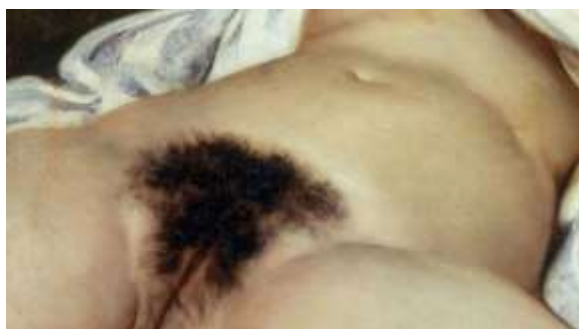
Εικ. 8. Gustave Courbet, Η προέλευση του κόσμου , περ. 1870, λάδι σε καμβά, 46 εκ. x 55 εκ., Musée d'Orsay (Μουσείο Ορσέ), Παρίσι

«αμφιβληστροειδικό ρίγος» και η αντιζωγραφική στάση είχαν μέχρι αυτό το σημείο φανεί ειλικρινείς 152 . Ξαφνικά οι ερευνητές του έργου του Duchamp βρέθηκαν με μια απτή μαρτυρία δουλειάς δεκαετιών η οποία όχι μόνο ακύρωνε τη φήμη της καλλιτεχνικής του αδράνειας αλλά επιπλέον φαίνεται να αναδεικνύει το αμφιβληστροειδικό ρίγος σε κεντρικό θέμα της. Παρά την πολλαπλότητα των τεχνικών που έχουν χρησιμοποιηθεί στην κατασκευή των Δεδομένων , η απομάκρυνση του Duchamp από το αντι-αισθητικό μανιφέστο των ready-made και η επιστροφή του σε μια παραστατική, σχεδόν ζωγραφική, προσέγγιση είναι πρόδηλη.