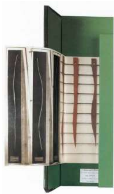
Εικ. 9. Τρεις πρότυπες πεδήσεις , 1913-1914, Philadelphia Museum of Art (Μουσείο Τέχνης της Φιλαδέλφειας), Φιλαδέλφεια

στην αστική κοινωνία σύμφωνα με την οποία το άτομο θεωρείται ο δημιουργός του έργου τέχνης 188 . Επιπροσθέτως, η αποπροσωποποίηση της θέσης του συγγραφέα-καλλιτέχνη επαναφέρει την προέλευση του ready-made έργου στο μελλοντικό πλαίσιο της εμφάνισής του, ένα πλαίσιο που θα μπορούσε να αντέξει ενδεχομένως τις συνέπειές του 189 . Όπως είδαμε παραπάνω, η διαδικασία της ανάδυσης του ready-made είναι συλλογική και απρόσωπη, εξαρτάται πάντα από το εκάστοτε πλαίσιο. Η λήψη αποφάσεων για την αναγνώριση του ready-made μετατοπίζεται στο μέλλον και ο Duchamp αποφεύγει να πάρει αποφάσεις για άλλους. Μόνο οι μελλοντικοί θεατές μπορούν να αποφασίσουν. Παράλληλα, με έργα όπως οι Τρεις πρότυπες πεδήσεις (εικ. 9), ο Duchamp παραδίδει τον έλεγχο της καλλιτεχνικής δημιουργίας στο τυχαίο το οποίο καταργεί κάθε προετοιμασία στο μυαλό του καλλιτέχνη ακυρώνοντας ουσιαστικά την έννοια της δεξιότητας που παραδοσιακά συνδέεται με τον ορισμό του καλλιτέχνη.