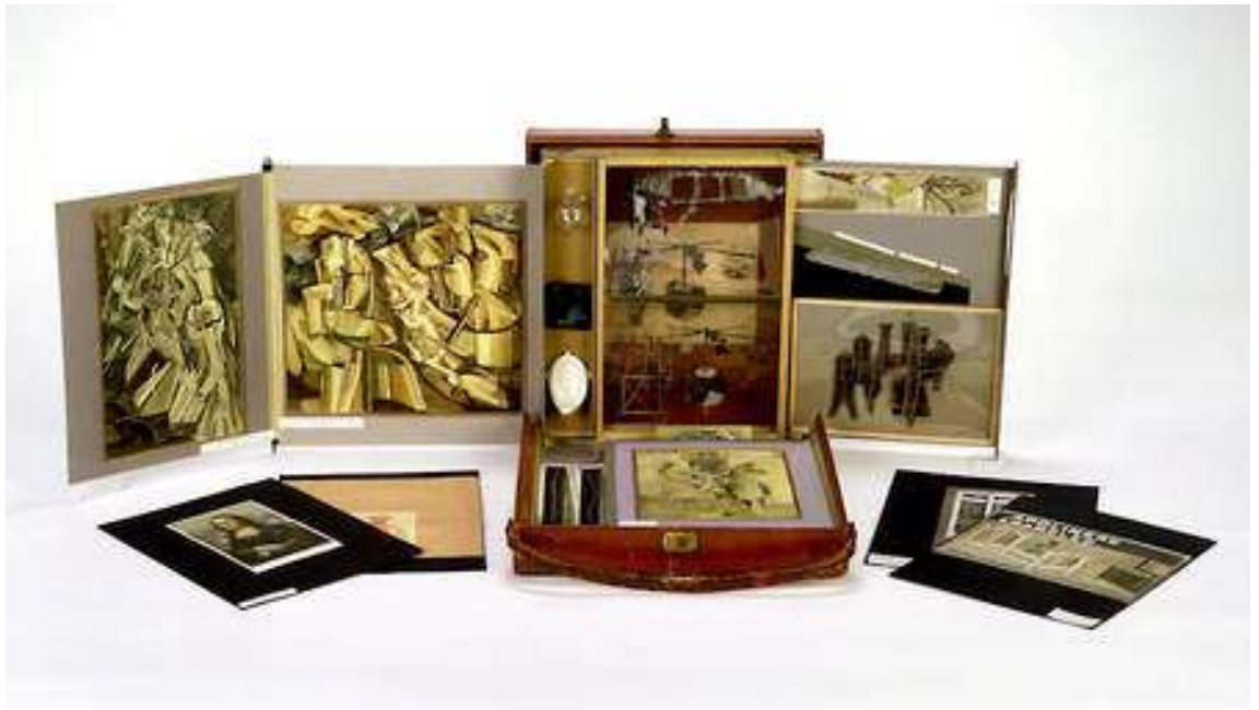
Εικ. 14. Κουτί σε βαλιτσάκι , 1937-1942, Philadelphia Museum of Art (Μουσείο Τέχνης της Φιλαδέλφειας), Φιλαδέλφεια

πειραματιστεί με την παρουσίαση και της δικής του τέχνης 254 . Το Κουτί σε βαλιτσάκι ( Boîte-en-valise , 1937-1942) αποτελεί ένα από τα πρώτα παραδείγματα παρουσίασης του έργου του Duchamp στο οποίο ο καλλιτέχνης εισάγει το στοιχείο της ενεργητικής συμμετοχής του «θεατή» αλλά και μια παιχνιδιάρικη διάθεση. Το έργο (εικ. 14), το οποίο ο ίδιος χαρακτηρίζει ως ένα «φορητό μουσείο» 255 , αποτελείται από ένα κουτί το οποίο περιέχει μικρογραφικές αναπαραγωγές έργων του καλλιτέχνη και κυκλοφόρησε σε 300 αντίτυπα.