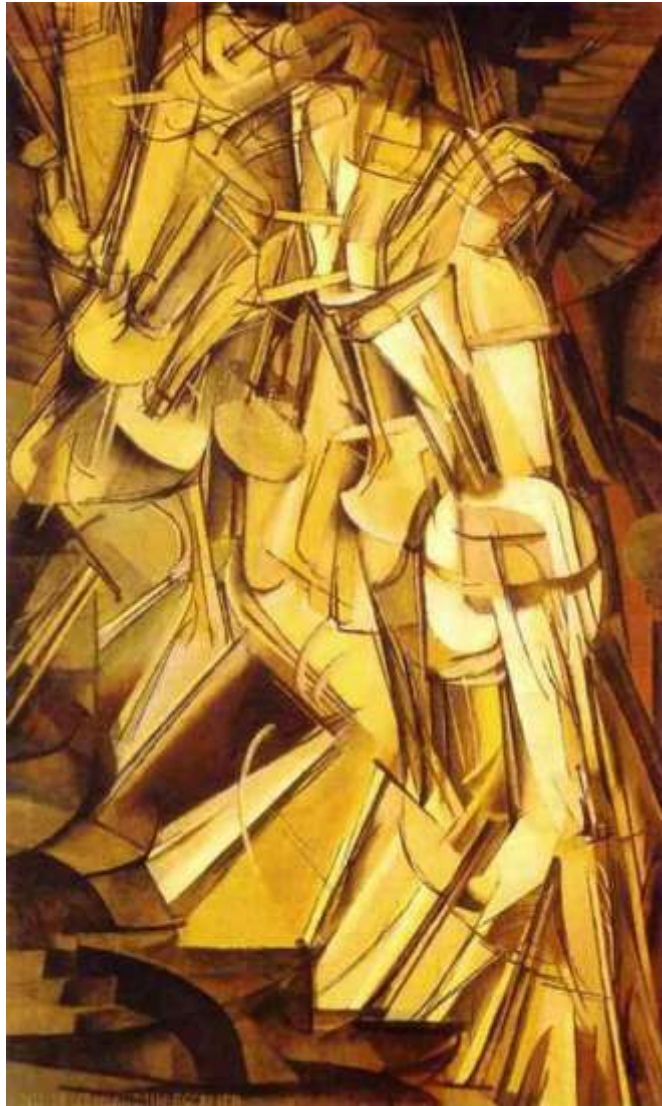
Εικ. 1. Γυμνό που κατεβαίνει σκάλα αρ. 2 (1912), λάδι σε καμβά, 89 x 146 εκ., Philadelphia Museum of Art (Μουσείο Τέχνης της Φιλαδέλφειας), Φιλαδέλφεια

Στο έργο αυτό ( εικ. 1 ) ο Duchamp επιχείρησε να απεικονίσει την κίνηση προσφέροντας ένα αντίδοτο στην αδυναμία των στατικών έργων του κυβισμού, προσεγγίζοντας συμπτωματικά τον νεόκοπο φουτουρισμό 32 . Αντί να αναπαραστήσει το θέμα του από πολλαπλές πλευρές σε μια στιγμή όπως υπαγόρευε η κυβιστική θεωρία, ο Duchamp το αναπαριστά από μια πλευρά σε πολλαπλές στιγμές εμπνεόμενος από το νεογέννητο σινεμά και τη χρονοφωτογραφία της εποχής 33 .