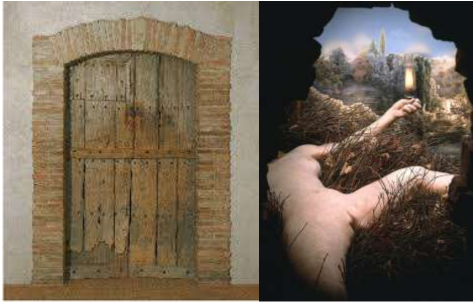
Εικ. 7. Δεδομένα: 1 ον Ο καταρράχτης· 2 ον Το φωταέριο, 1946-1966, Philadelphia Museum of Art (Μουσείο Τέχνης της Φιλαδέλφειας), Φιλαδέλφεια

Το έργο, ένα ασαμπλάζ μικτής τεχνικής, το οποίο δούλεψε με μεγάλη μυστικότητα για δύο δεκαετίες, αποτελείται από μια παλιά, πλαισιωμένη από τούβλα που σχηματίζουν αψίδα, δίφυλλη δρύινη πόρτα με δυο μικρές τρύπες για τα μάτια. Μέσα από τις τρύπες φαίνεται, πίσω από έναν γκρεμισμένο τοίχο ένα ζωηρά φωτισμένο τοπίο αλά Courbet 148 με χαμηλούς λόφους, στο βάθος του οποίου υπάρχει ένας καταρράκτης, οπτικό εφέ που δημιουργεί η περιστροφή ενός τσίγκινου κουτιού από ένα μοτέρ 149 . Μια γυμνή γυναίκα-ανδρείκελο σε φυσικό μέγεθος, ξαπλωμένη με διάπλατα ανοιχτά τα πόδια σ' ένα στρώμα από ξερά κλαδιά κρατά στο αριστερό χέρι μια λάμπα φωταερίου που σιγοκαίει ενώ το πρόσωπο της είναι κρυμμένο από τα ξανθά μαλλιά μιας περούκας. Ανάμεσα στον καλλιτέχνη και τον μοναδικό θεατή που μπορεί κάθε φορά να δει μέσα από τις τρύπες της πόρτας το «ερωτικό αυτό γλυπτικό περιβάλλον» 150 δημιουργείται μια αίσθηση συνενοχής και συμπαιγνίας 151 . Ίσως πρόκειται για το πλέον σκανδαλιστικό έργο του καλλιτέχνη, καθώς η αίσθηση ηδονοβλεπτικής παραβίασης είναι σαφέστατη, γεγονός που έχει σχολιαστεί από όλους τους μελετητές της τρισδιάστατης σύνθεσης.