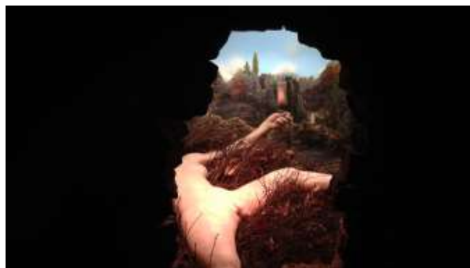
Εικ. 16. Η θέα από την τρύπα της πόρτας

Εάν, ωστόσο, ο επισκέπτης αποδεχτεί την καλλιτεχνική πρόκληση του Duchamp και δεν προσπεράσει αδιάφορος ή αφηρημένος την παλιά ξύλινη πόρτα το παιχνίδι ξεκινάει. Ανακαλύπτοντας και κοιτάζοντας μέσα από τις τρύπες ανακαλύπτει το φωτισμένο εσωτερικό της εγκατάστασης ( εικ. 16 ). Από εκεί και πέρα, ο θεατής