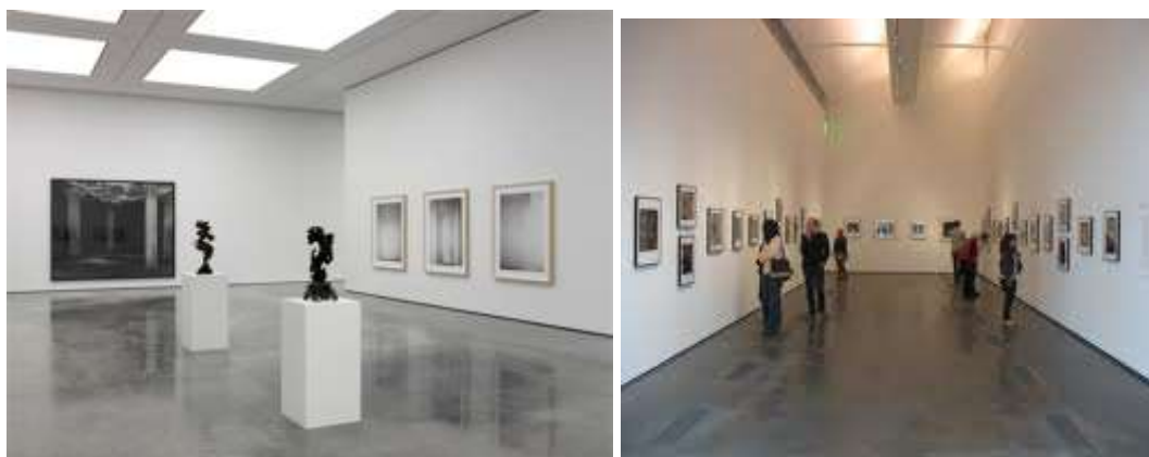
Εικ. 10 & 11. Εκθέσεις εμπνευσμένες από την αισθητική του λευκού κύβου

Είδαμε έως τώρα ότι η τέχνη του Duchamp μας προσκαλεί να την μετέλθουμε με τη φαντασία και τη νόησή μας και όχι αποκλειστικά με τα μάτια, ότι το παιγνιώδες πνεύμα και το τυχαίο ανάγονται σε έγκυρα συστατικά της τέχνης η οποία, όπως ο ίδιος υποστήριζε, οφείλει να αναπαριστά άορατους κόσμους αντί απλά και μόνον το ορατό. Από την άλλη, ο θεσμός του δημόσιου μουσείου από τα μέσα τουλάχιστον του 19ου αιώνα αποτελεί τον κατεξοχήν πειθαρχημένο και υποδειγματικό χώρο θέασης της τέχνης όπου οι «θορυβώδεις» και οι «άξεστοι» μπορούν να εκπολιτίσουν τον εαυτό τους μιμούμενοι τους κώδικες συμπεριφοράς με τους οποίους θα έρχονται σε επαφή στις αίθουσές του 217 . Στη συνέχεια, ο μοντερνισμός στην ορθόδοξη έκφρασή του αποθεώνοντας την καθαρότητα και ουδετερότητα του μουσειακού-εκθεσιακού χώρου θα καθιερώσει την αισθητική του λευκού κύβου ( εικ. 10, 11 ) και θα πριμοδοτήσει ακόμη περισσότερο την όραση ως την κυρίαρχη και μόνη αίσθηση στους εκθεσιακούς χώρους του μουσείου 218 . Το μουσείο του μοντερνισμού θα μεταβληθεί σε έναν ιεροποιημένο χώρο αμιγούς παρατήρησης, κάτι ανάμεσα σε παρεκκλήσι και αρχαίο ναό, όπου τα λογής αντικείμενα και έργα τέχνης αντιμετωπίζονται αποκλειστικά ως οπτικές οντότητες και αυτόνομα αισθητικά φαινόμενα.