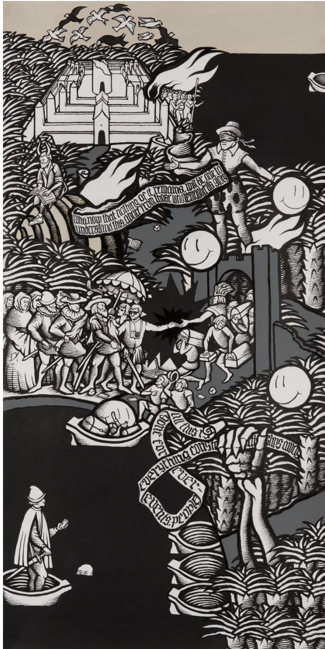
Χωρίς τίτλο II, Ακρυλικά και μελάνι σε χαρτί, 140x70cm, 2022