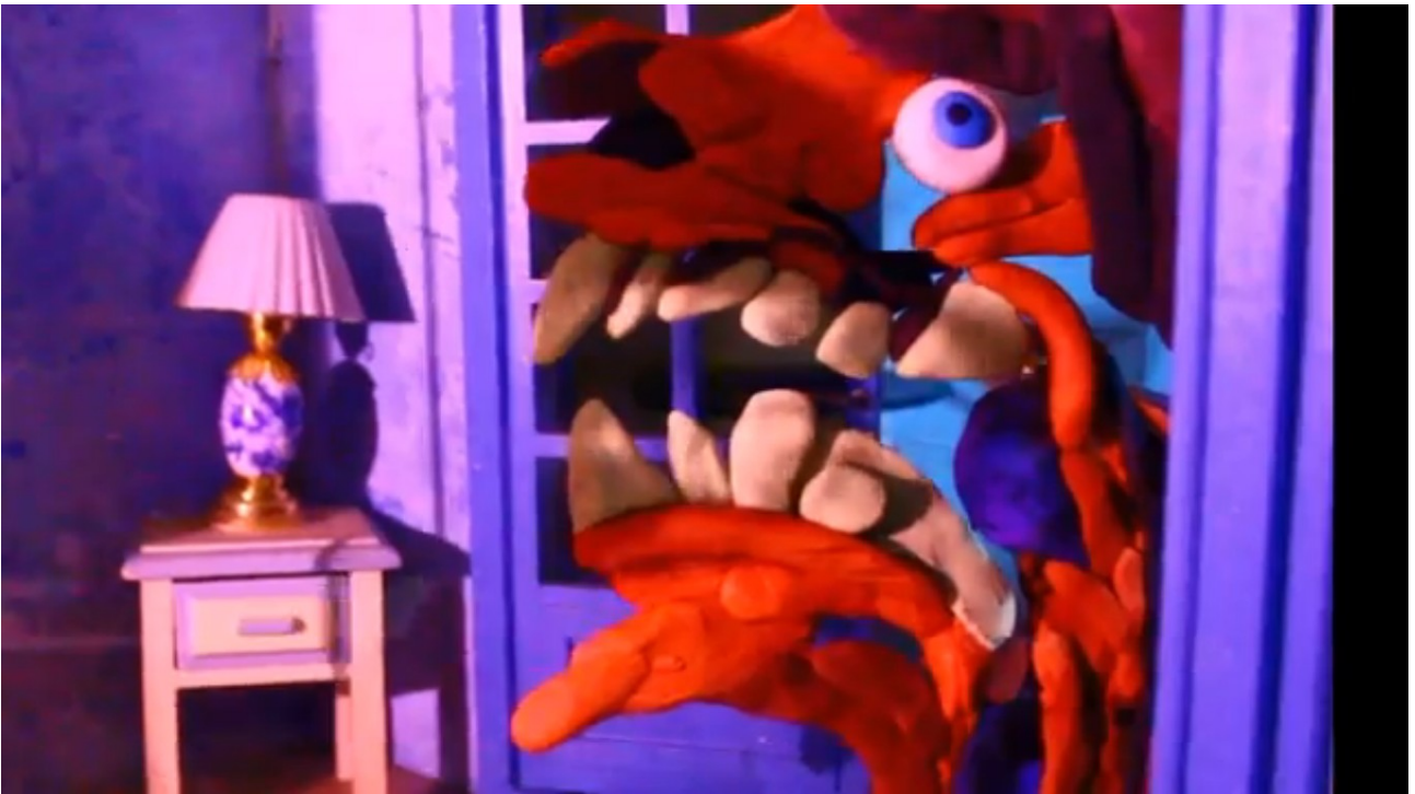
Screenshot από βίντεο