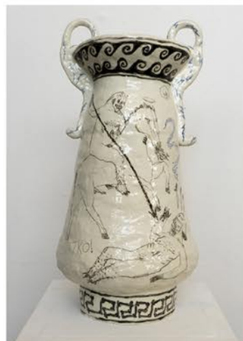
"critical hit always does some more damage 2022 Glazed clay, 70 x 30 cm