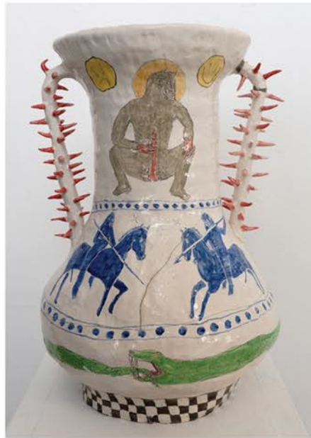
"First Raid Kit pt 2". 2022 Glazed clay, 65 x 37 cm