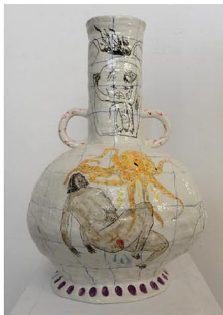
"we shall allow our intuition to guide even though is bad. lets go fight the beast." 2022 Glazed clay, 68 x 40 cm