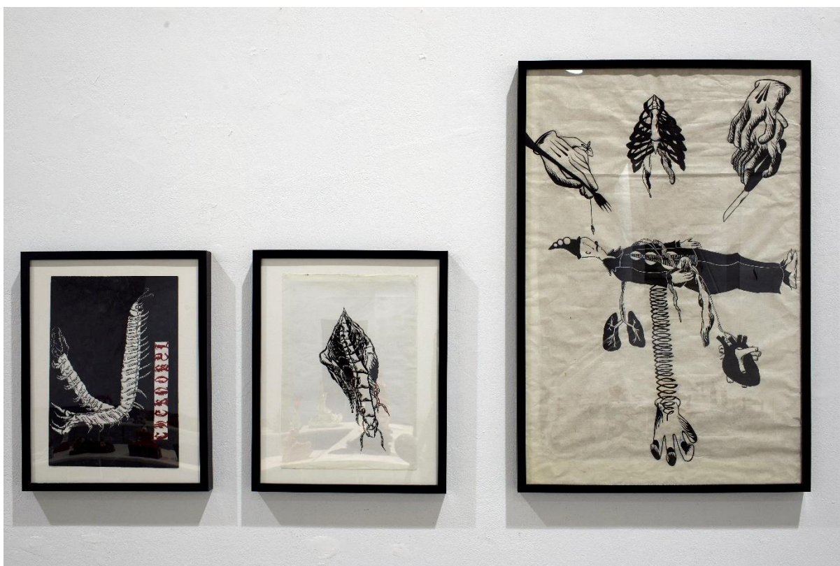
Χωρίς τίτλο, 2020-21,Μελάνι σε χαρτί, A3