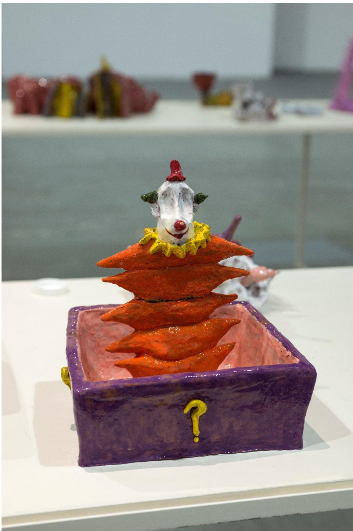
Jack in the box, 2022, κεραμικό, 20x25x20 εκατοστά