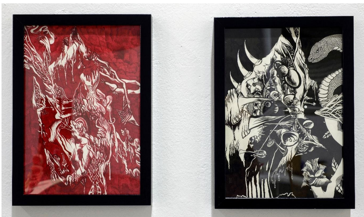
Σύνθεση από 2 σχέδια – χωρίς τίτλο, 2021-22,Μελάνι σε χαρτί, A4