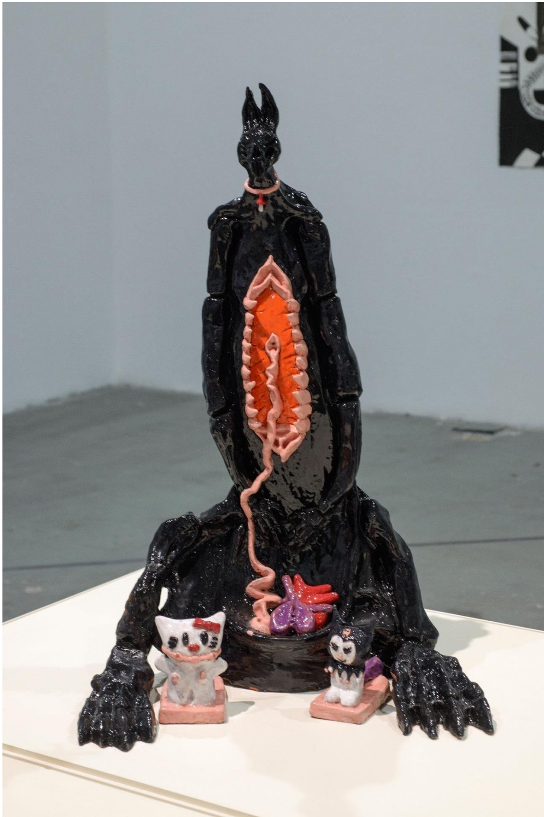
Donnie Darko, 2022, κεραμικό, 50x78x48 εκατοστά