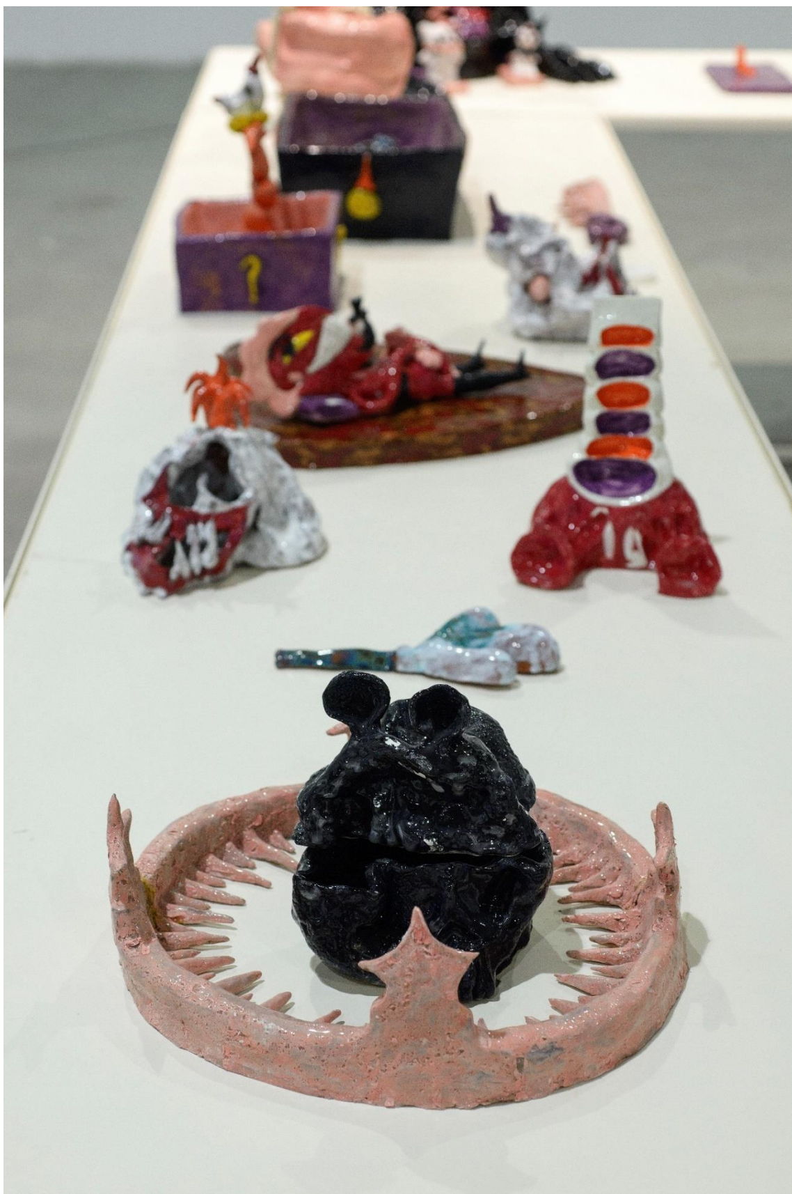
Crown of rain, 2022, κεραμικό, 30x10x30 εκατοστά