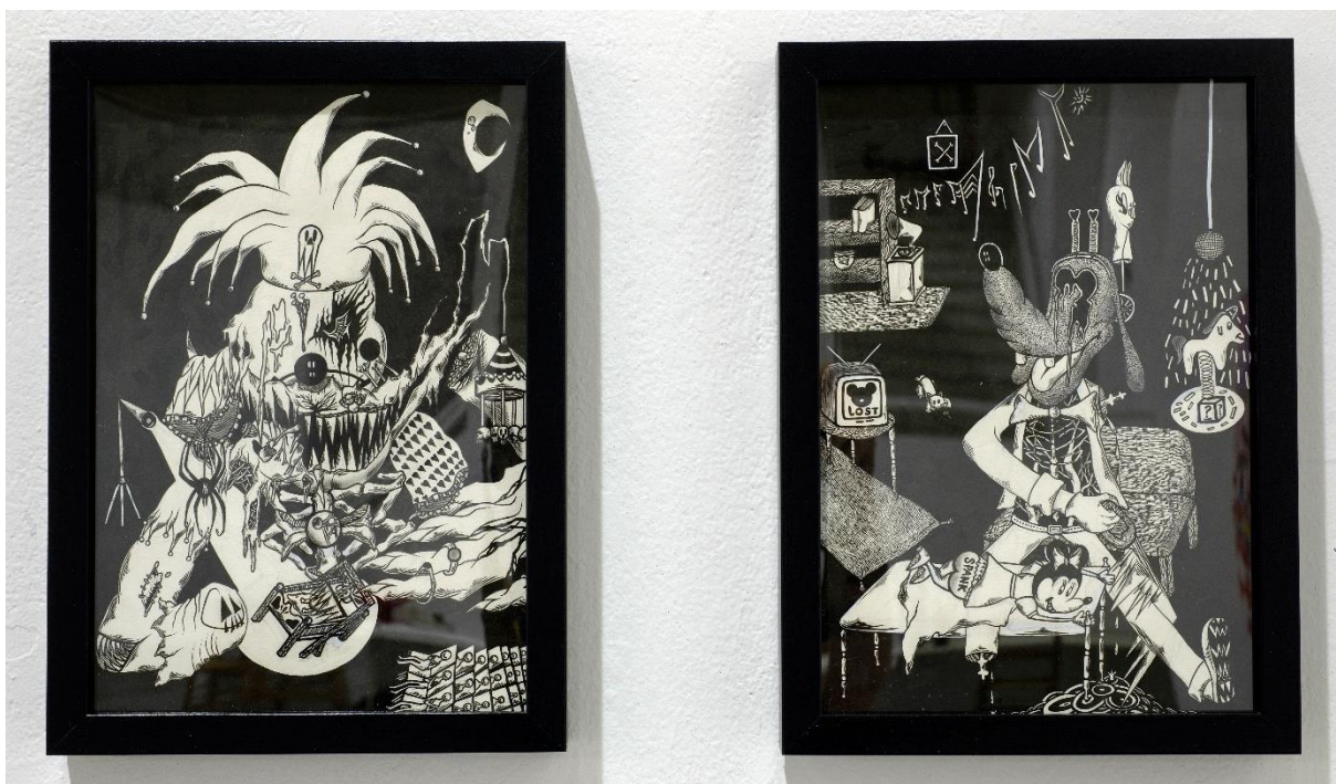
Σύνθεση από 2 σχέδια – χωρίς τίτλο, 2021-22,Μελάνι σε χαρτί, A4