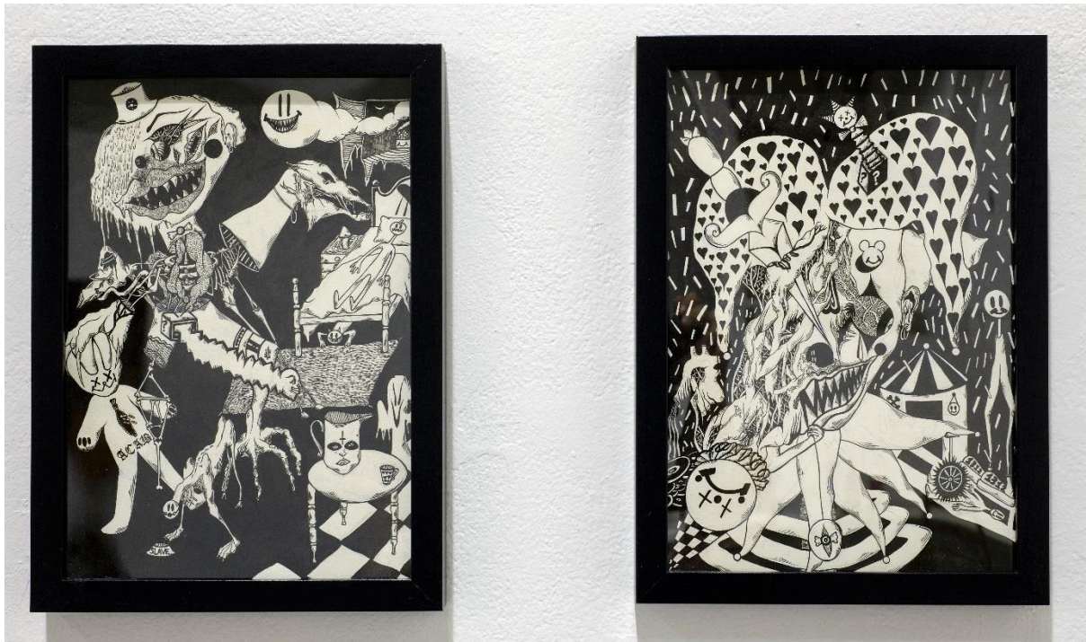
Σύνθεση από 2 σχέδια – χωρίς τίτλο, 2021-22,Μελάνι σε χαρτί, A4