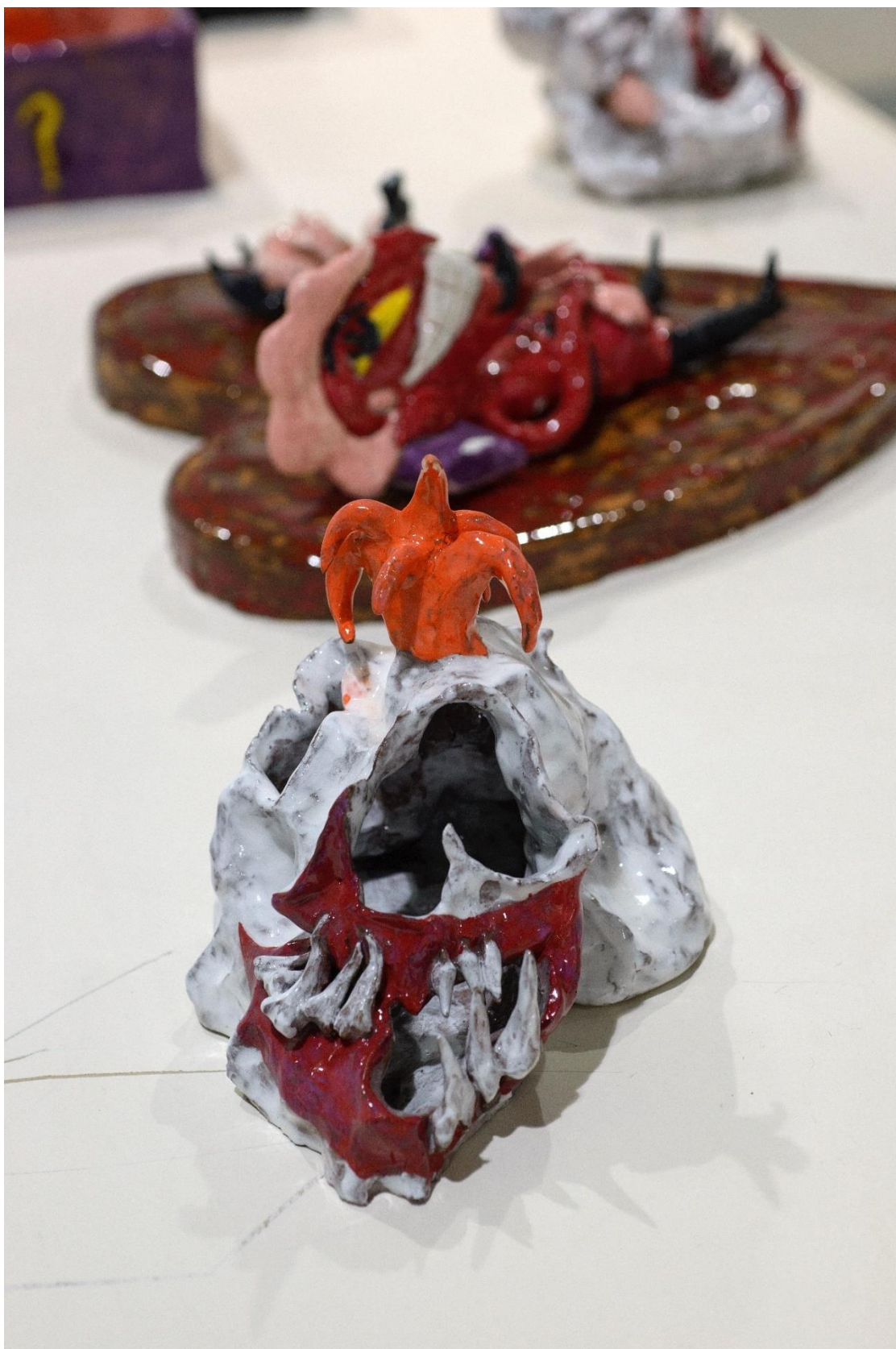
Arlequin head (03), 2022, κεραμικό, 10x18x15 εκατοστά