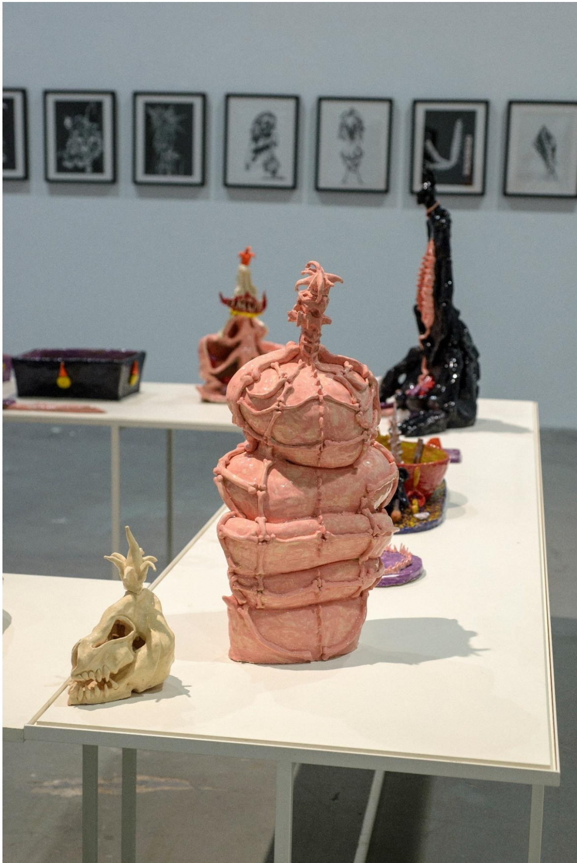
Γενική άποψη της σύνθεσης III