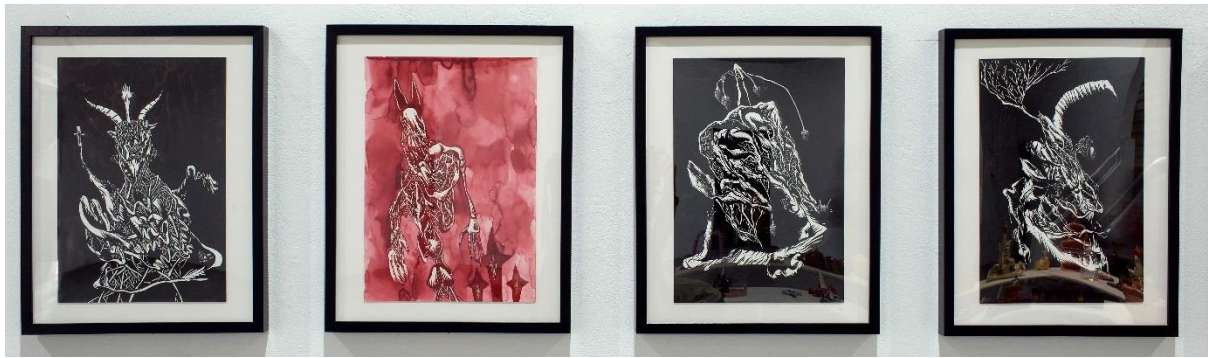
Σύνθεση από 4 σχέδια – χωρίς τίτλο, 2020-21,Μελάνι σε χαρτί, A3