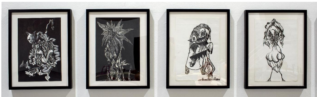
Σύνθεση από 4 σχέδια – χωρίς τίτλο, 2020-21,Μελάνι σε χαρτί, A3