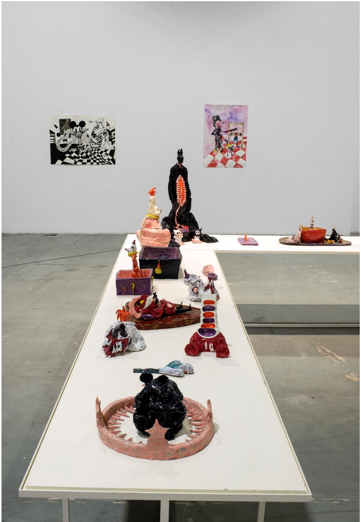
Γενική άποψη της σύνθεσης III