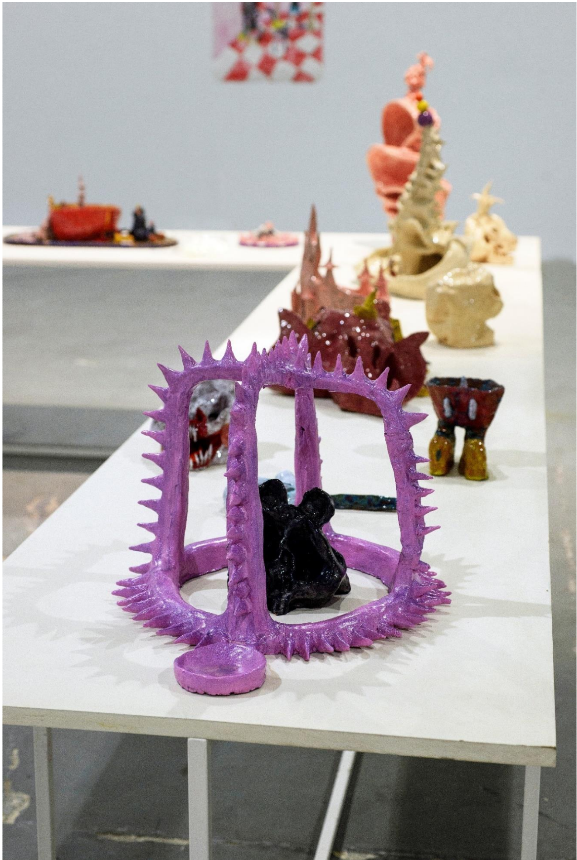
Γενική άποψη της σύνθεσης IV