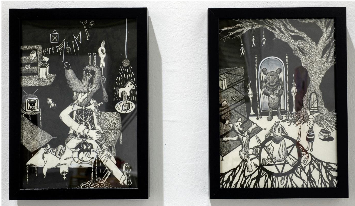
Σύνθεση από 2 σχέδια – χωρίς τίτλο, 2021-22, Μελάνι σε χαρτί, Α4