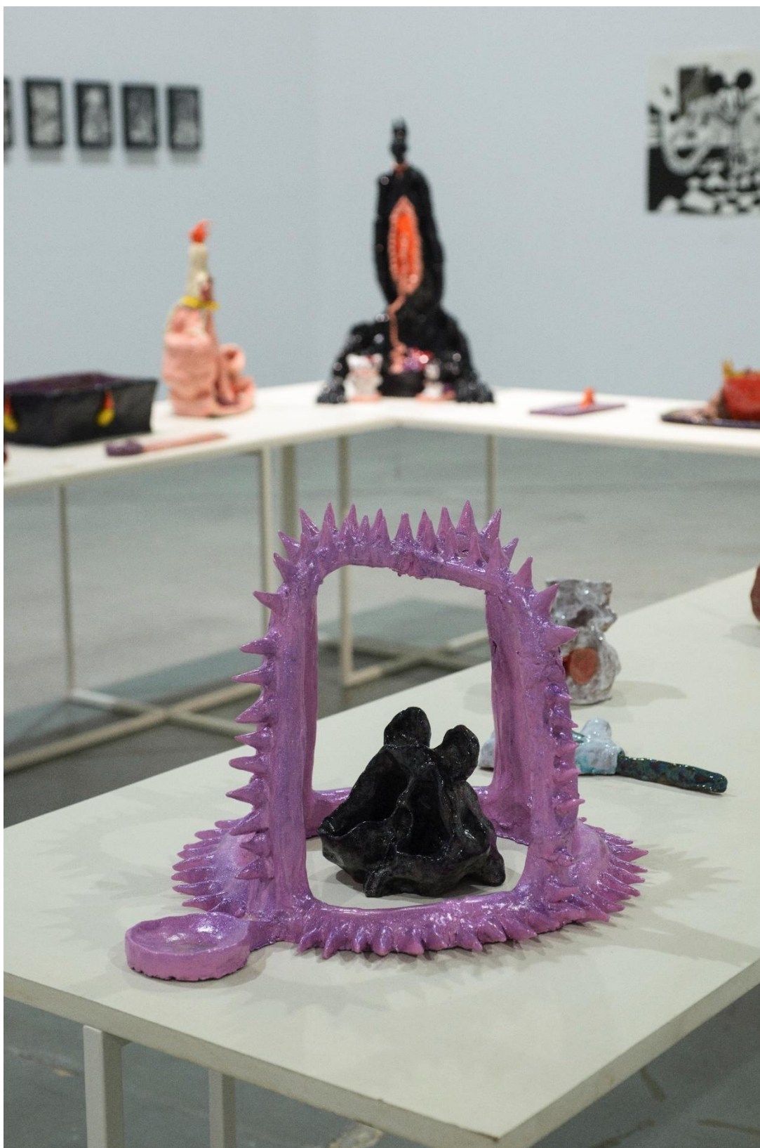
The trap, 2022, κεραμικό, 45x50x55 εκατοστά