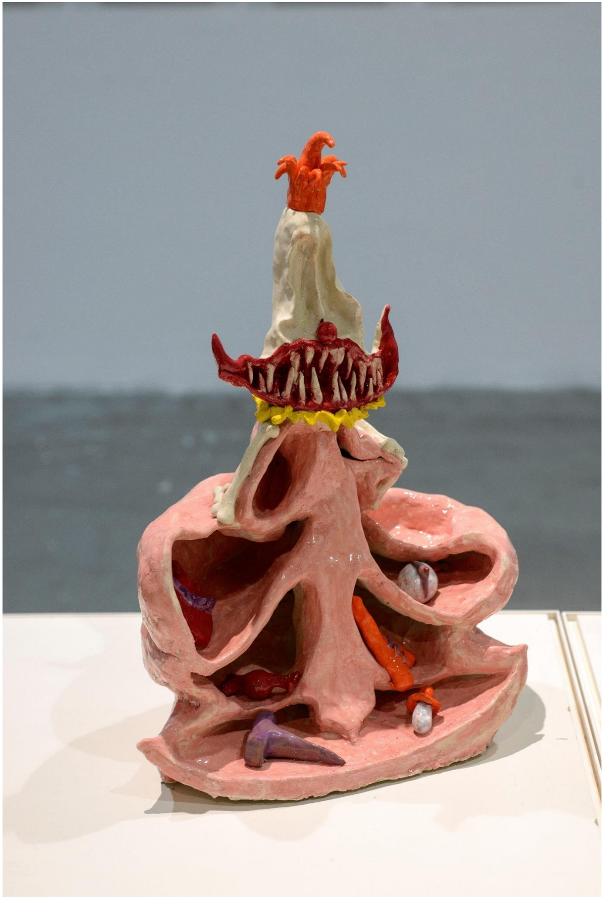
Candy Colored Clown, 2022, κεραμικό, 35x50x30 εκατοστά