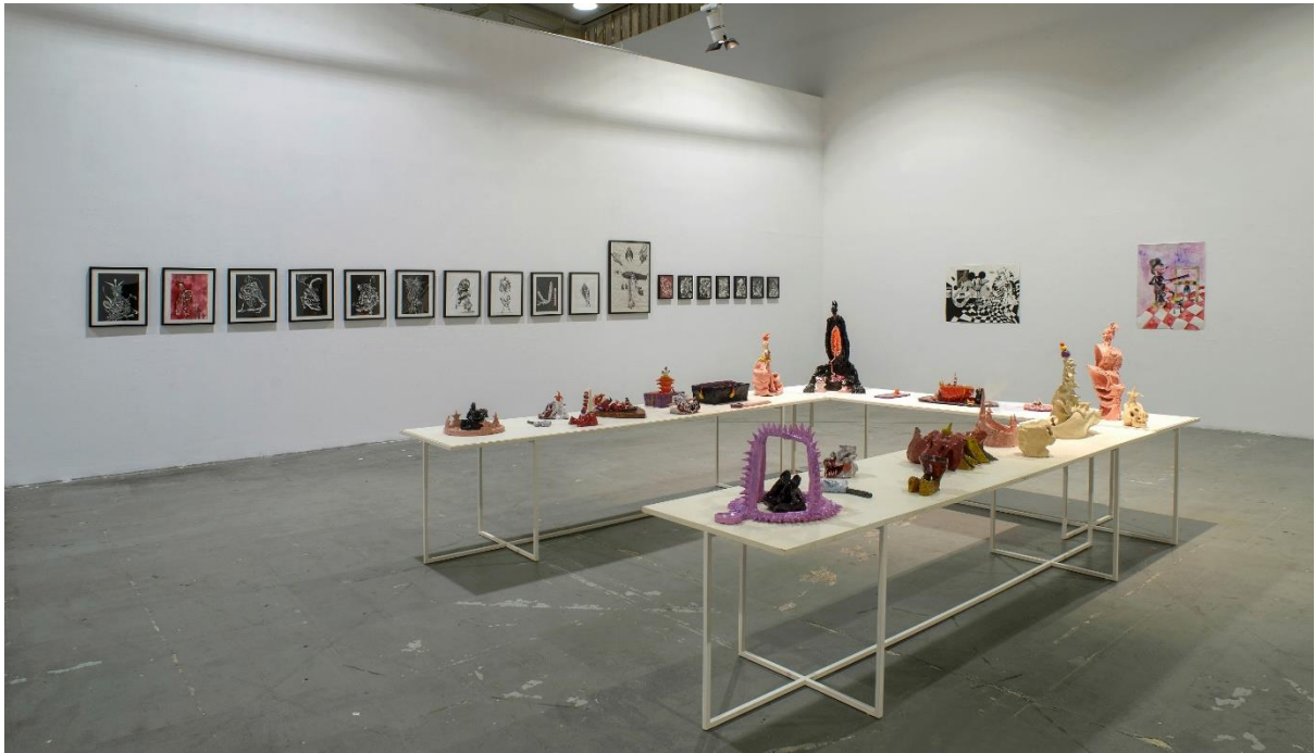
Γενική άποψη της σύνθεσης I