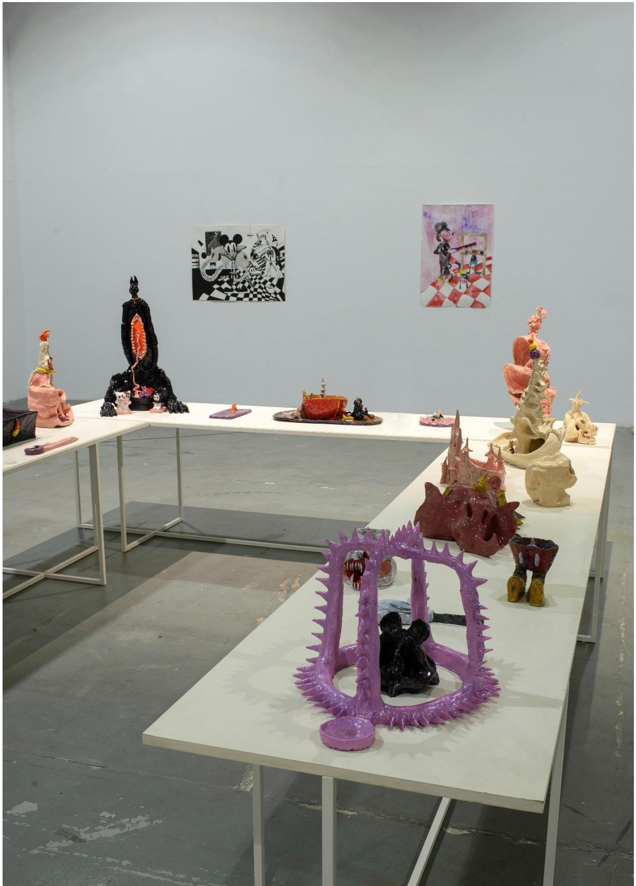
Γενική άποψη της σύνθεσης II