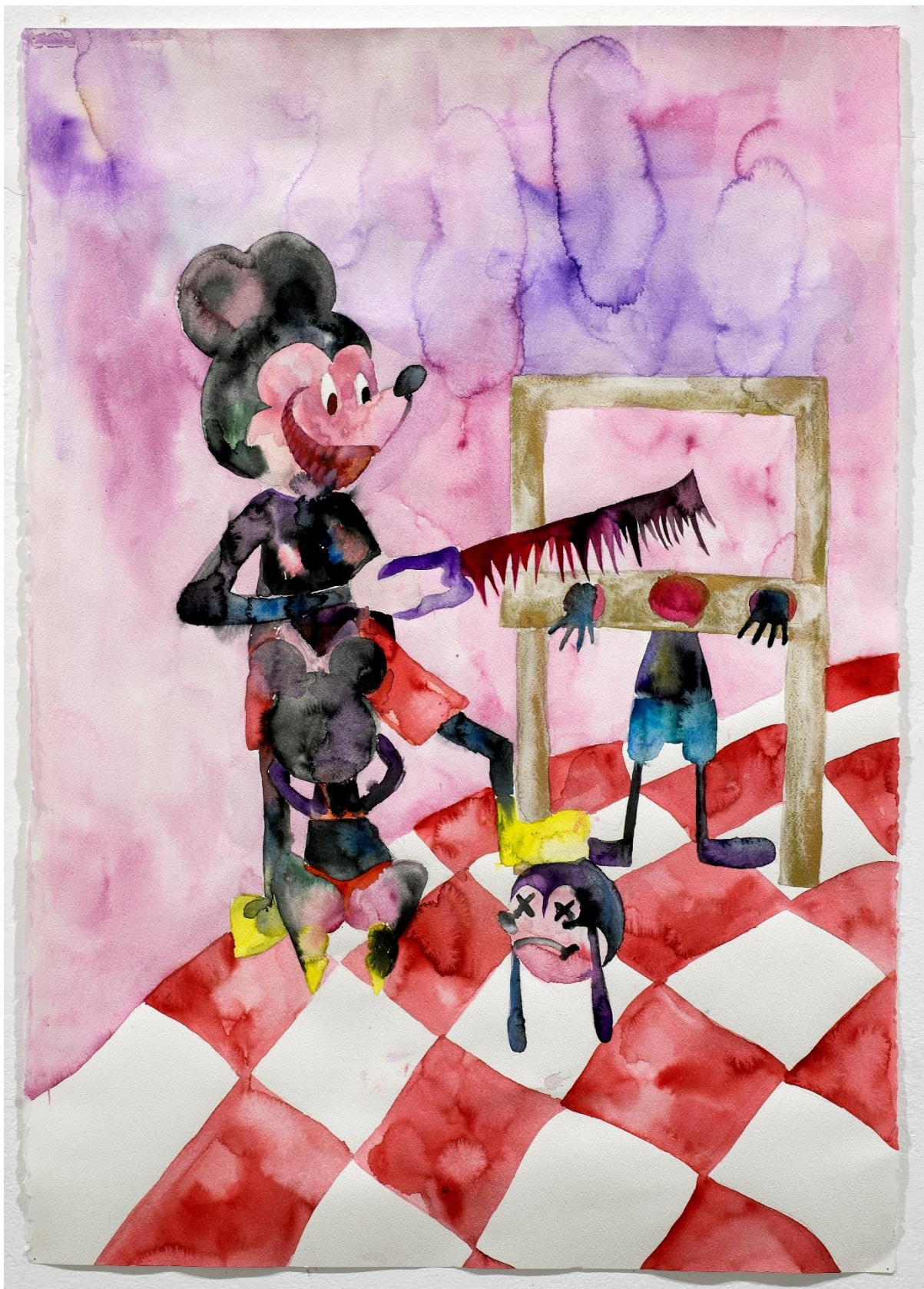
Killing Me, 2020, Μελάνι σε χαρτί, 70x100 εκατοστά