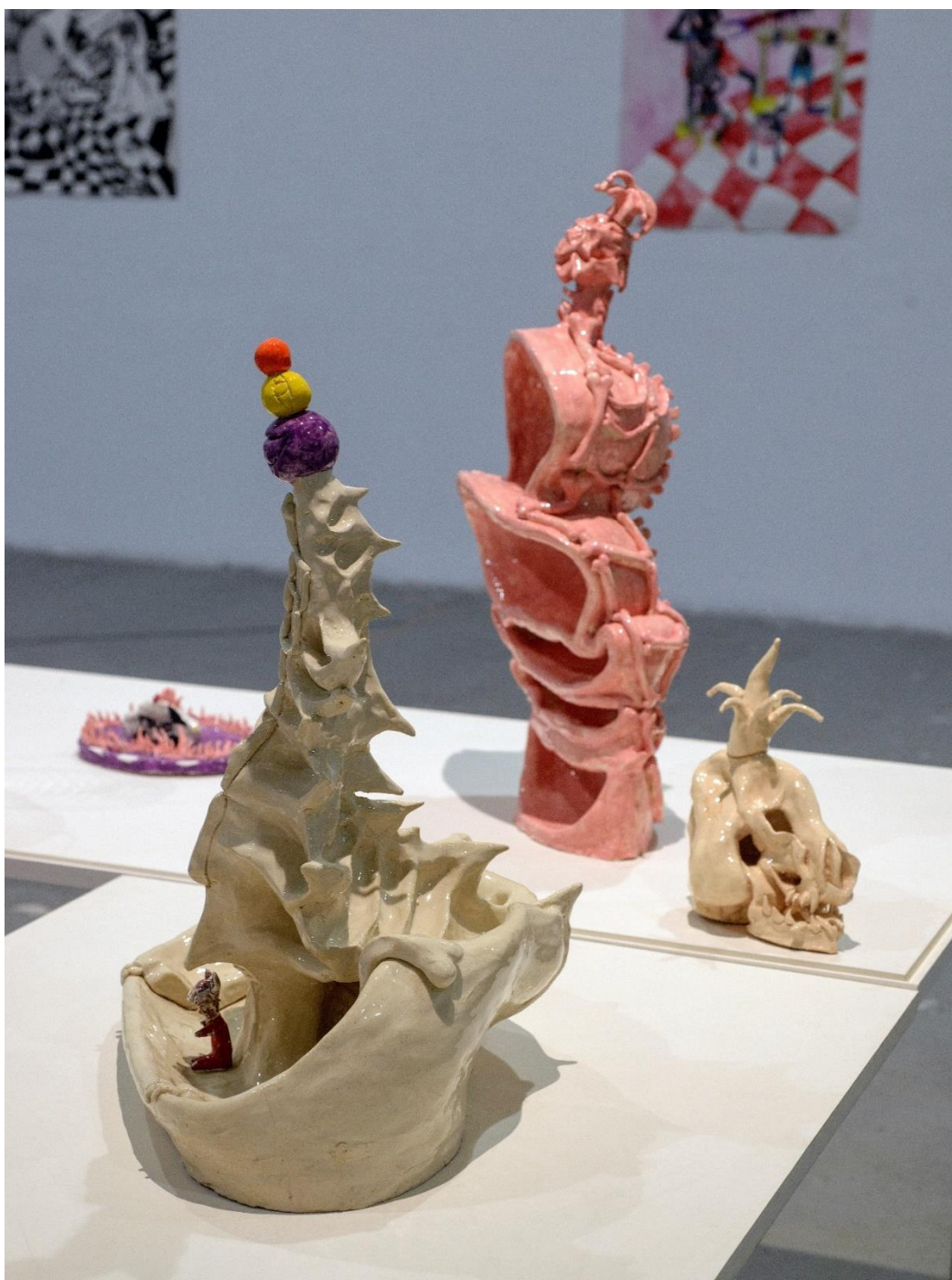
Lollipop Arlequin, 2022, κεραμικό, 45x65x30 εκατοστά