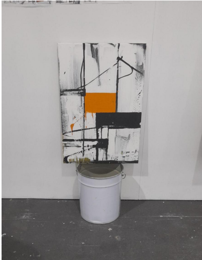
Χωρίς Τίτλο, Έτος δημιουργίας: 2022 Πλαστικό χρώμα σε καμβά Διαστάσεις: 50 x 70 cm