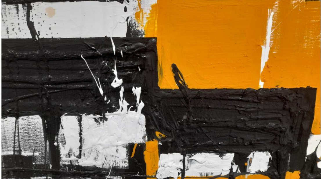
Χωρίς Τίτλο, Έτος δημιουργίας: 2022 Μεικτή τεχνική σε καμβά (πλαστικό χρώμα, λάδι, βερνίκι κόλλα πλακιδίων) Διαστάσεις: 100 x 150 cm