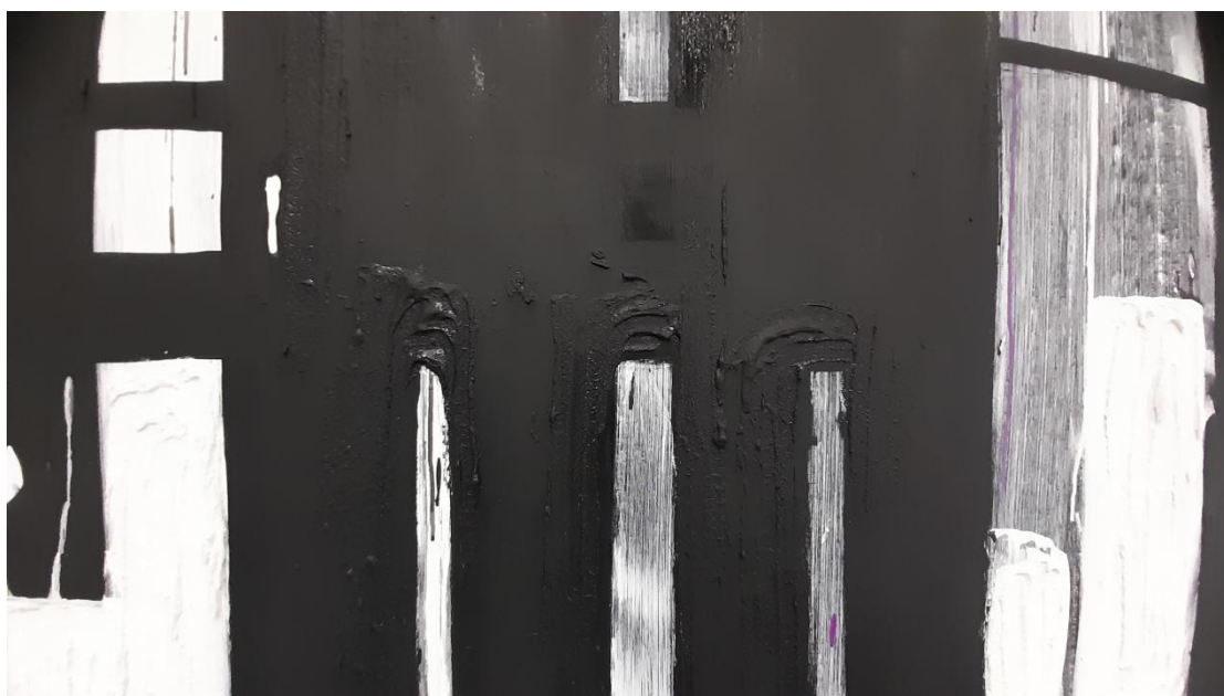
Χωρίς Τίτλο, Έτος δημιουργίας: 2022 Μεικτή τεχνική σε καμβά (πλαστικό χρώμα, λάδι, βερνίκι κόλλα πλακιδίων) Διαστάσεις: 200 x 300 cm