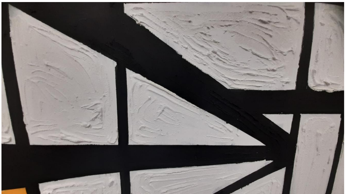
Χωρίς Τίτλο, Έτος δημιουργίας: 2022 Μεικτή τεχνική σε καμβά (πλαστικό χρώμα, κόλλα πλακιδίων) Διαστάσεις: 300 x 300 cm