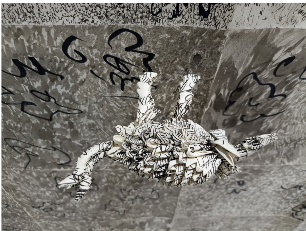
Λεπτομέρεια επιτοίχιας εγκατάστασης.