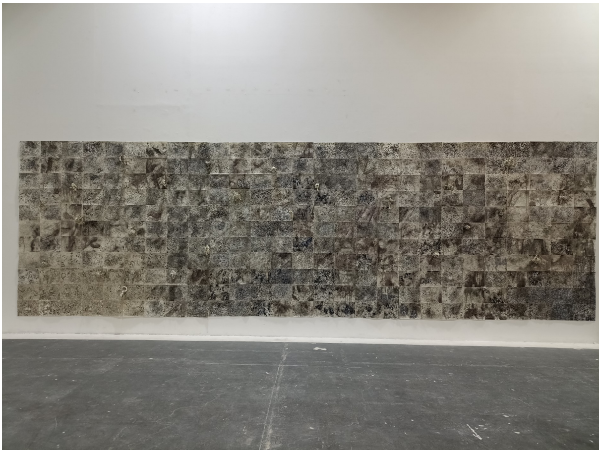
Χωρίς τίτλο, 2021-23, μαρκαδόρος, μελάνι σε χαρτί, 230X750 εκατοστά.