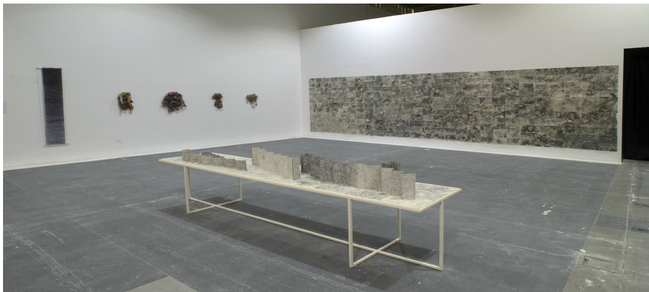
Εγκατάσταση πτυχιακής εργασίας

Γραμμή, origami, χαρτί, υβρίδια, καμουφλάζ, αφαιρετικό, Ιαπωνία.