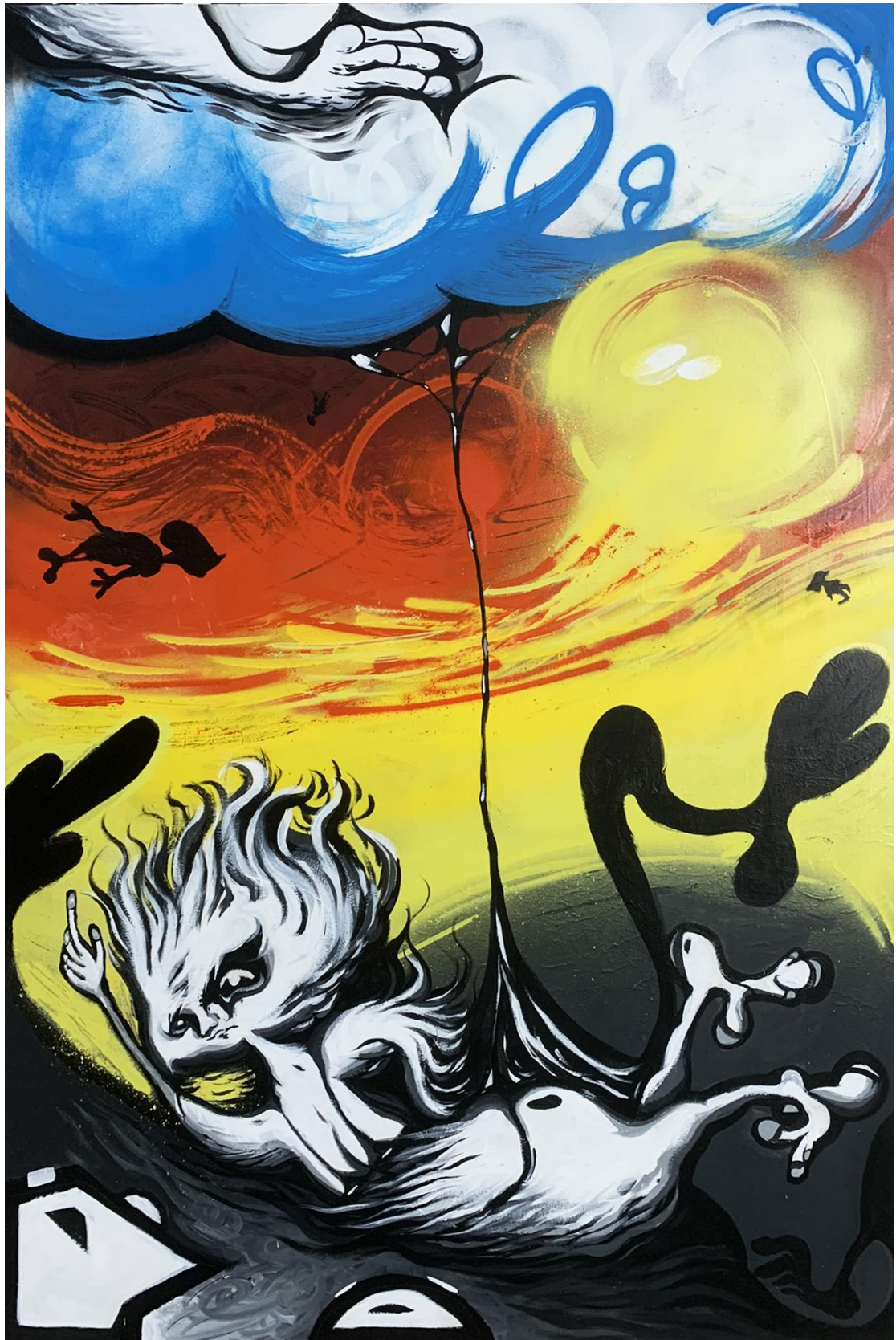
ΧΩΡΙΣ ΤΙΤΛΟ, 2022/ ΜΕΙΚΤΗ ΤΕΧΝΙΚΗ ΣΕ ΚΑΜΒΑ 80X120 ΕΚ.