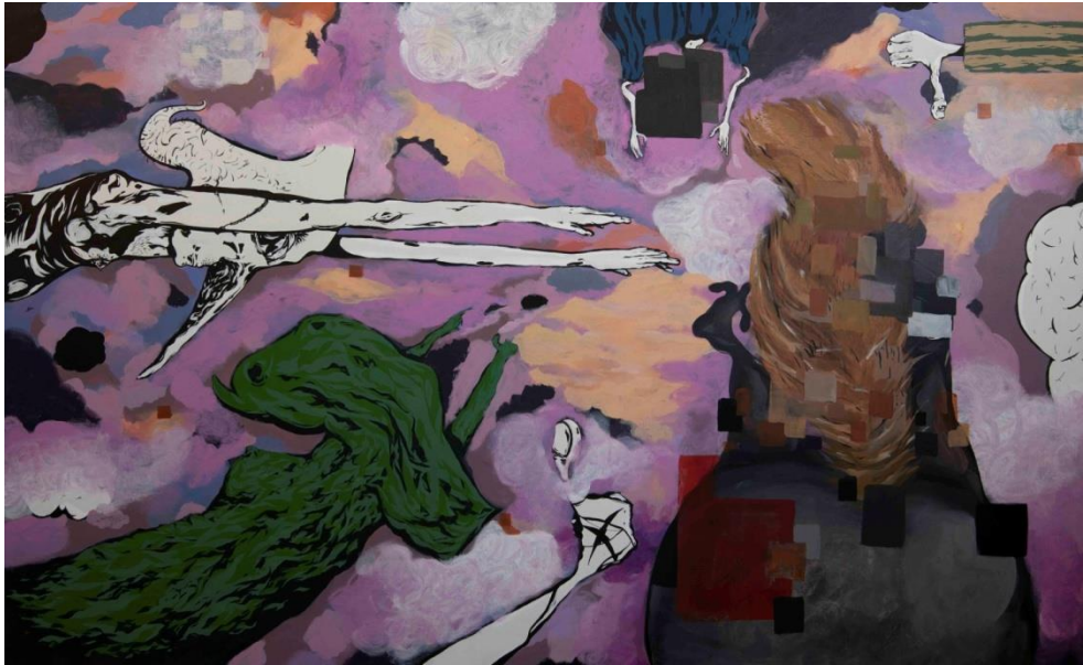
ΟΝΕΙΡΟ, 2022 / ΜΕΙΚΤΗ ΤΕΧΝΙΚΗ ΣΕ ΚΑΜΒΑ 150Χ250 ΕΚ.