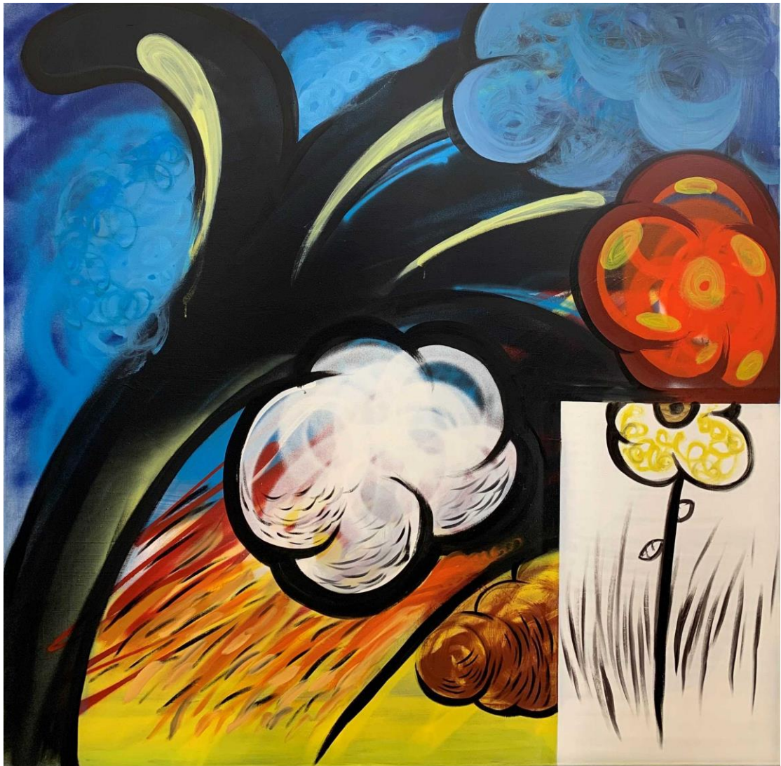
ΤΟ ΧΕΡΙ, 2022/ ΜΕΙΚΤΗ ΤΕΧΝΙΚΗ ΣΕ ΚΑΜΒΑ 150X150 ΕΚ.