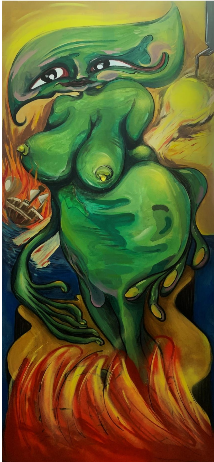
Η ΚΥΡΙΑ, 2022/ ΜΕΙΚΤΗ ΤΕΧΝΙΚΗ ΣΕ ΚΑΜΒΑ 85X190 ΕΚ.