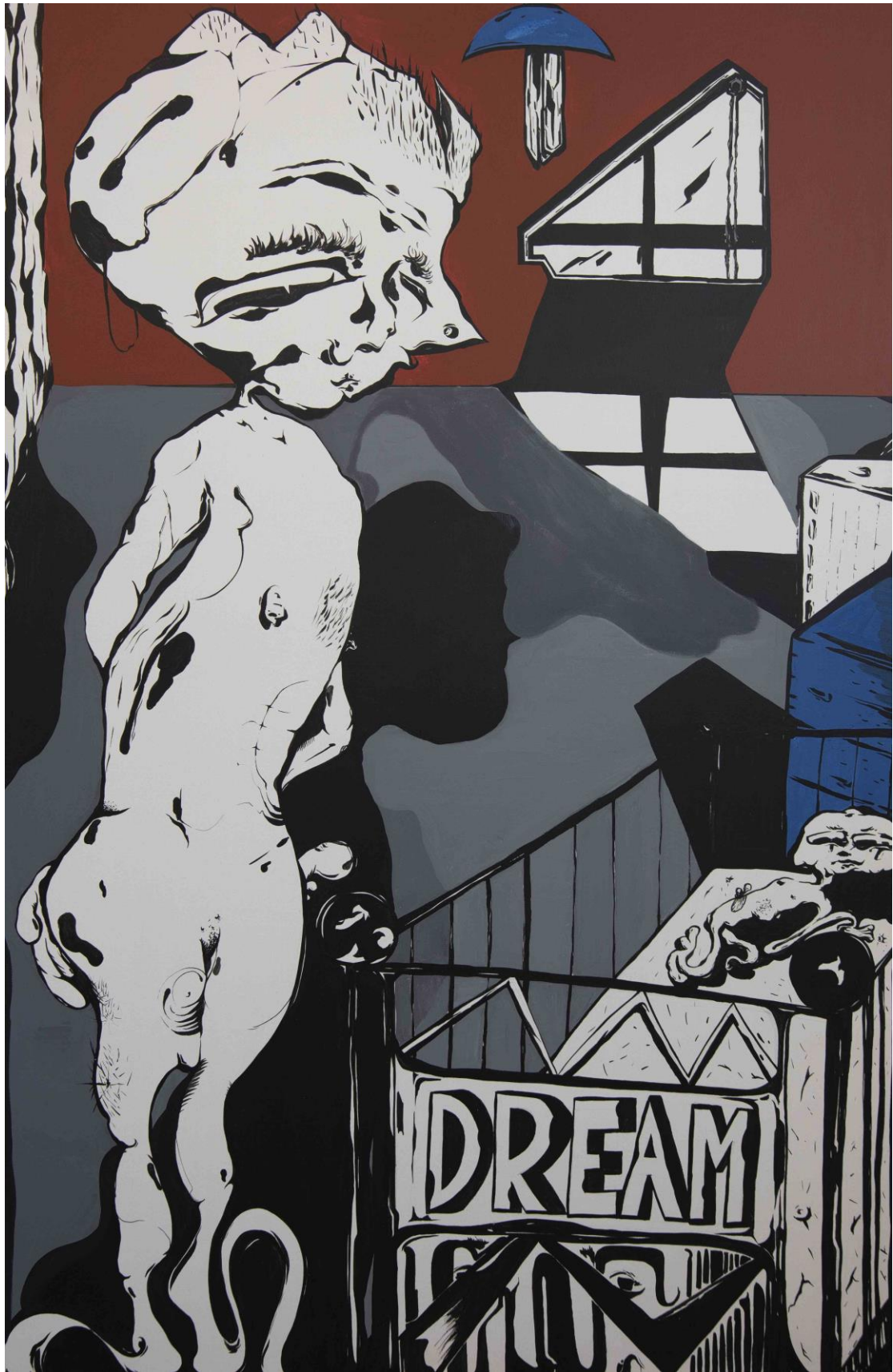
Η ΜΗΤΕΡΑ ΜΕ ΤΟ ΠΑΙΔΙ, 2020/ ΑΚΡΥΛΙΚΑ ΣΕ ΚΑΜΒΑ 70X130 ΕΚ.