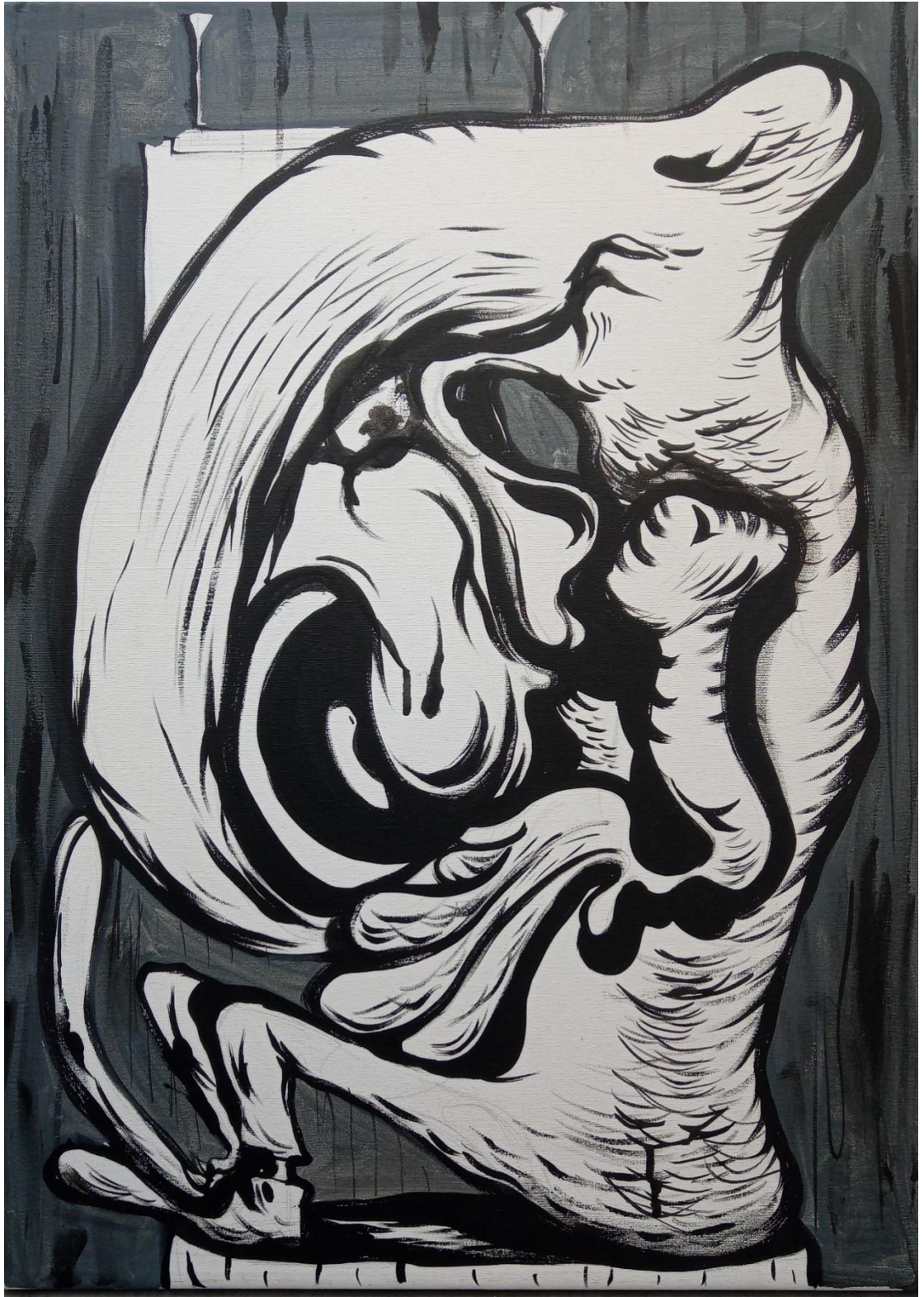
ΑΥΤΙΣΤΙΚΟΣ, 2022/ ΑΚΡΥΛΙΚΑ ΣΕ ΚΑΜΒΑ 30Χ50 ΕΚ.