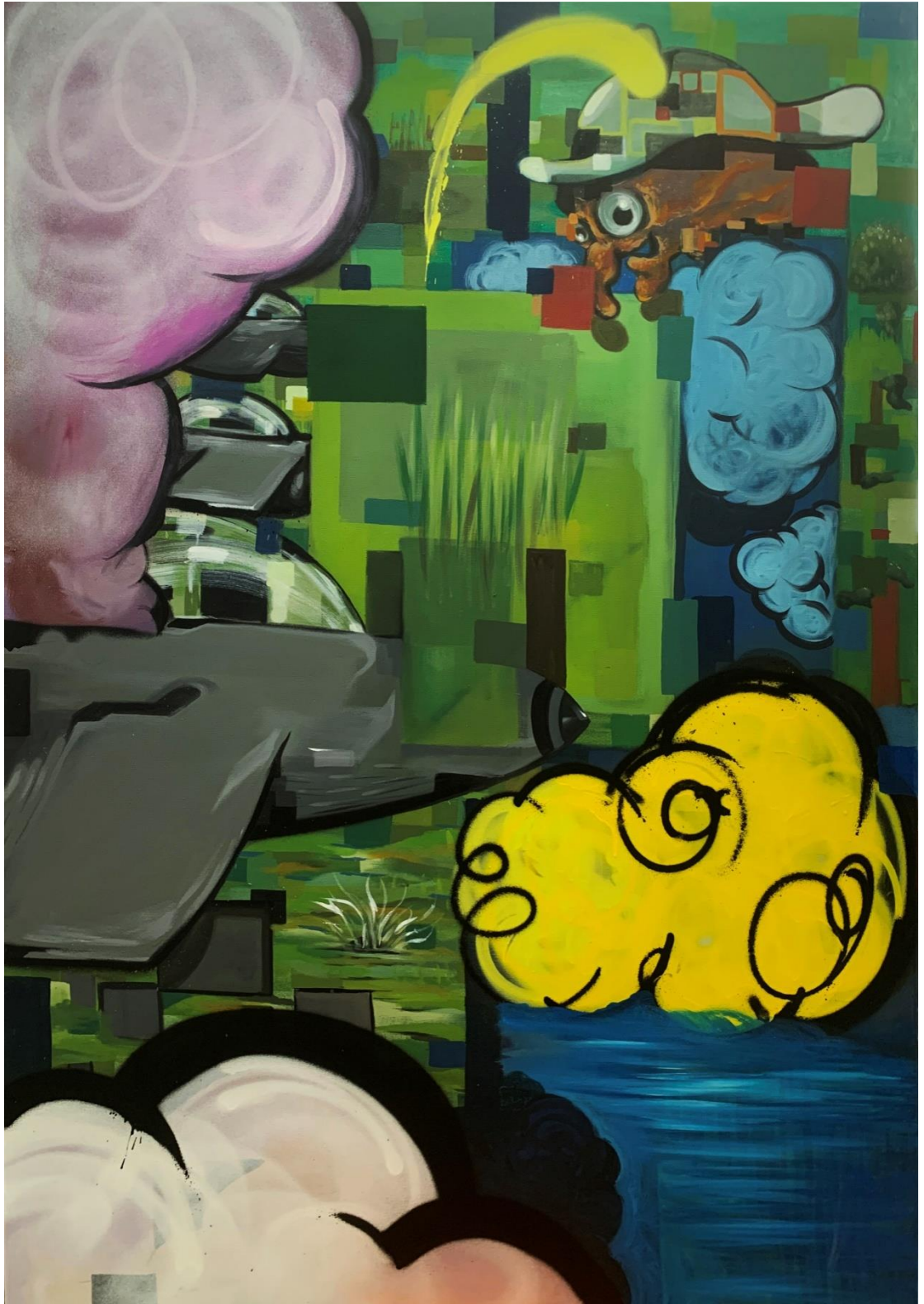
ΣΑΝ ΠΑΙΧΝΙΔΙ, 2022/ ΜΕΙΚΤΗ ΤΕΧΝΙΚΗ ΣΕ ΚΑΜΒΑ 90X150 ΕΚ.