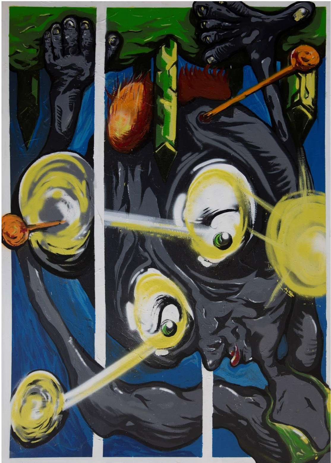
ΚΡΑΘΜΑ, 2022/ ΜΕΙΚΤΗ ΤΕΧΝΙΚΗ ΣΕ ΚΑΜΒΑ 100X140 ΕΚ.