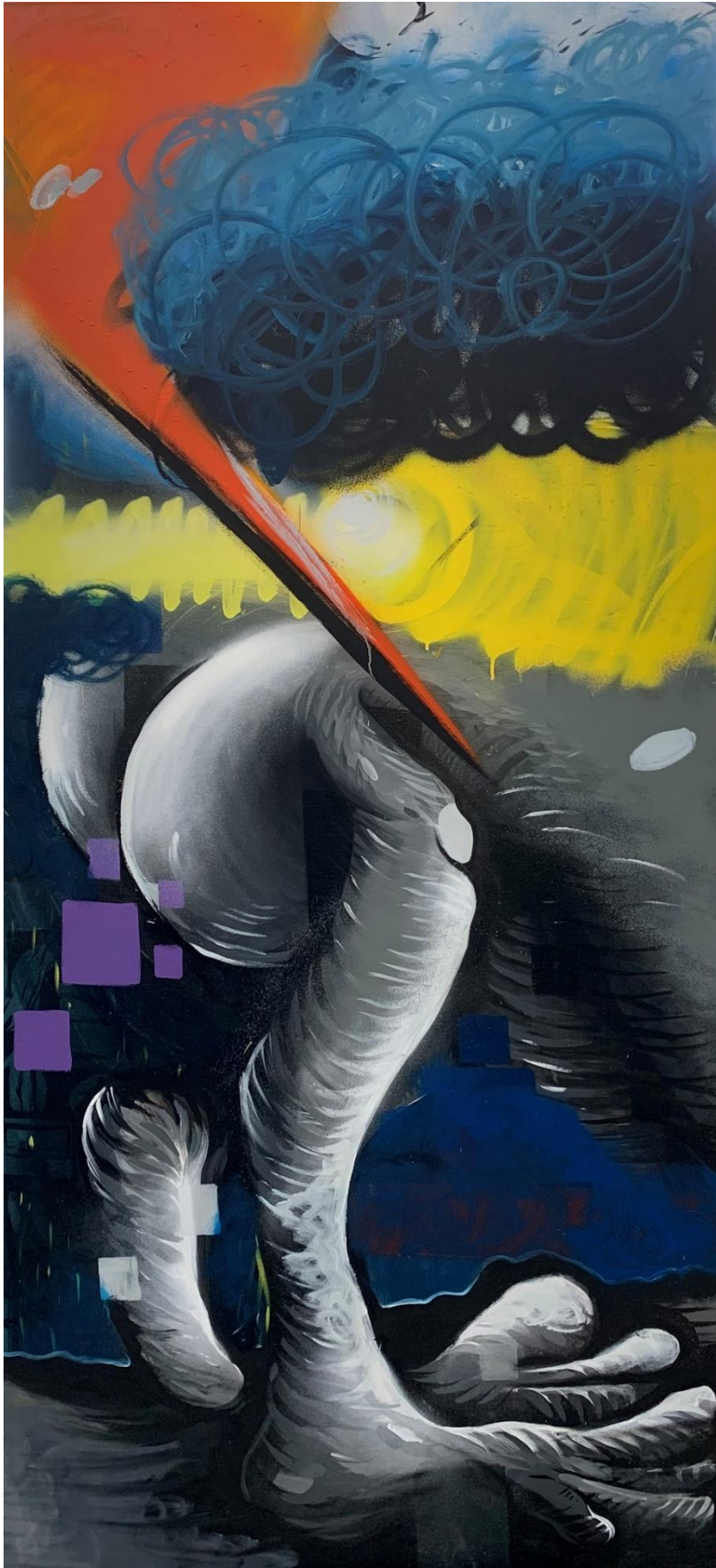
ΧΩΡΙΣ ΤΙΤΛΟ, 2022/ ΜΕΙΚΤΗ ΤΕΧΝΙΚΗ ΣΕ ΚΑΜΒΑ 90X195 ΕΚ.