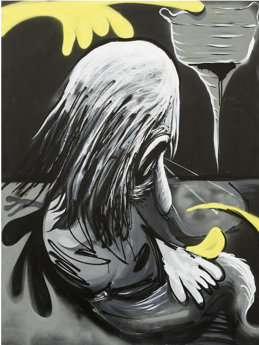
ΠΕΦΤΟΝΤΑΣ, 2021/ ΜΕΙΚΤΗ ΤΕΧΝΙΚΗ ΣΕ ΚΑΜΒΑ 150Χ200 ΕΚ.