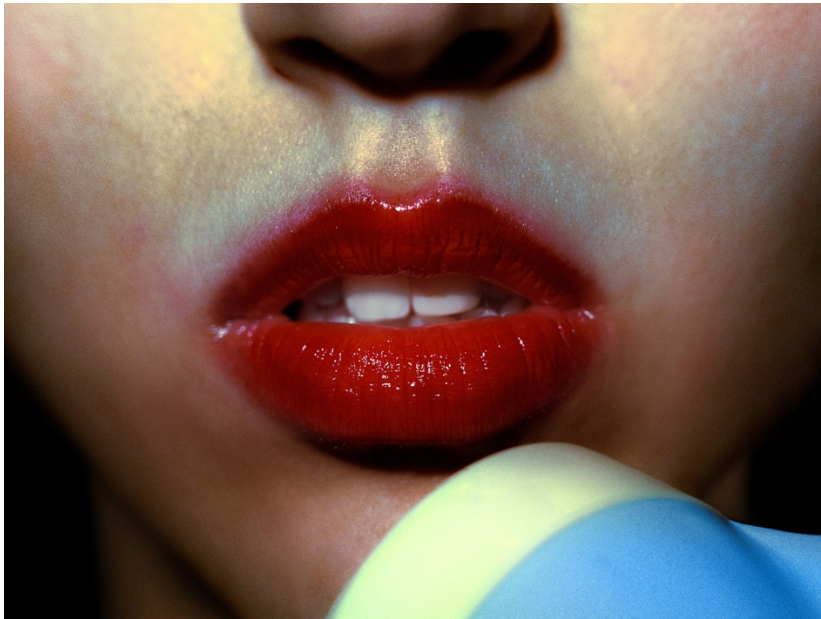
7. «Χωρίς τίτλο», 2025