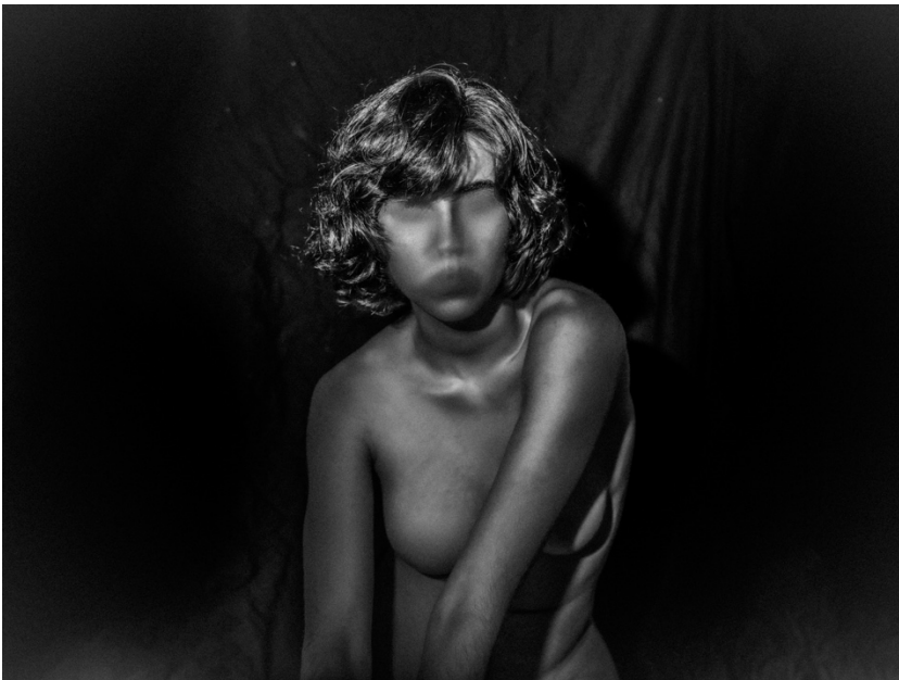
6. «Χωρίς τίτλο», 2025