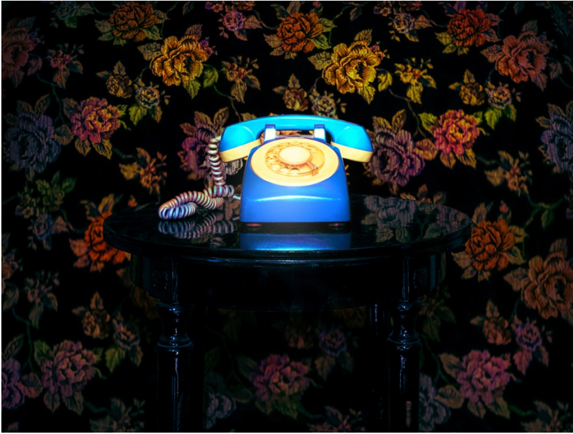
5. «Χωρίς τίτλο», 2025