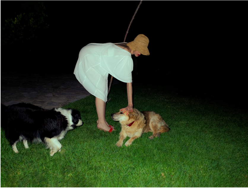
3. «Χωρίς τίτλο», 2025