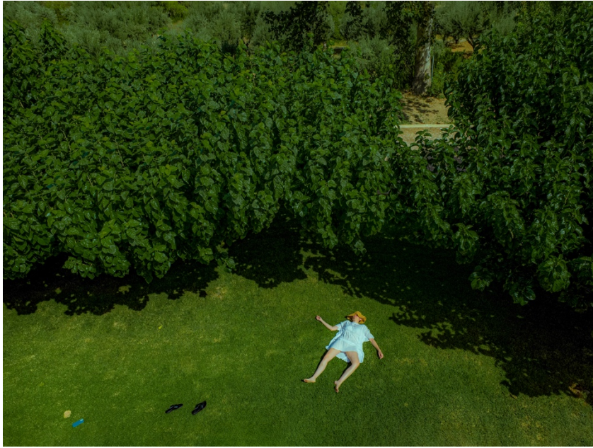
9. «Χωρίς τίτλο», 2025