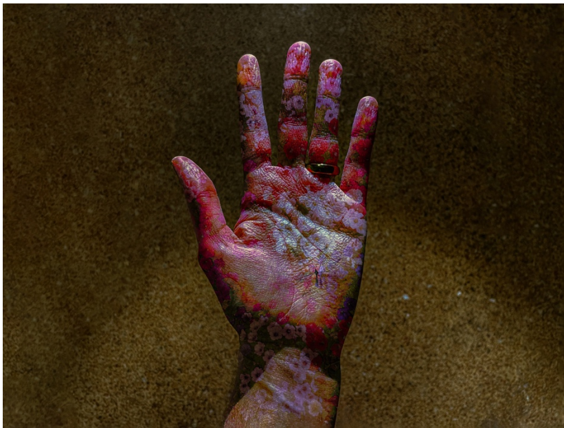
8. «Χωρίς τίτλο», 2025