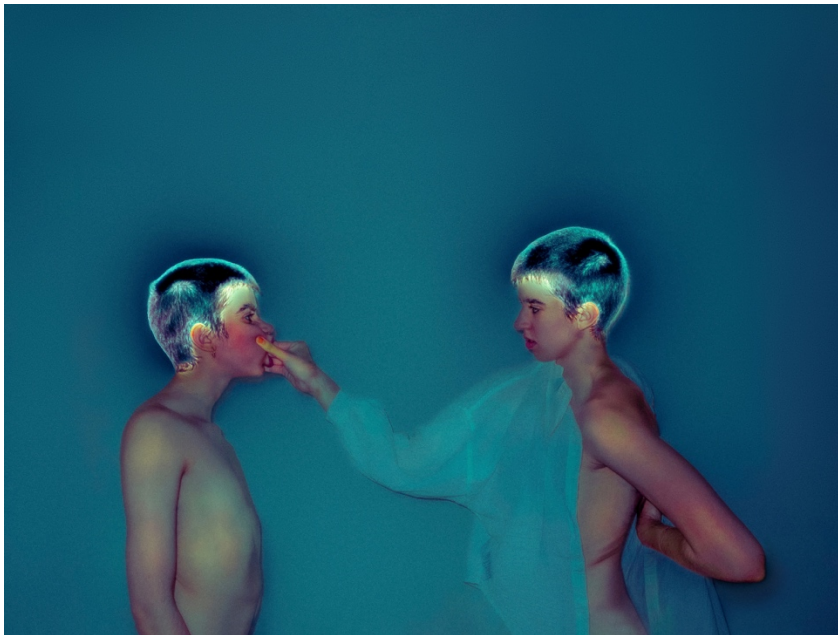
10. «Χωρίς τίτλο», 2025