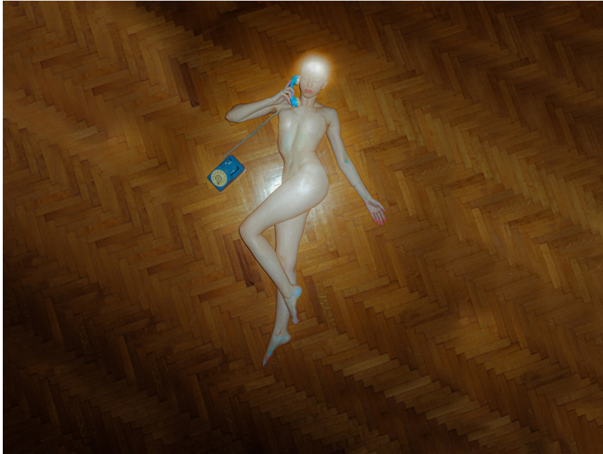
1. «Χωρίς τίτλο», 2025