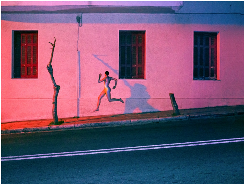
2. «Χωρίς τίτλο», 2025