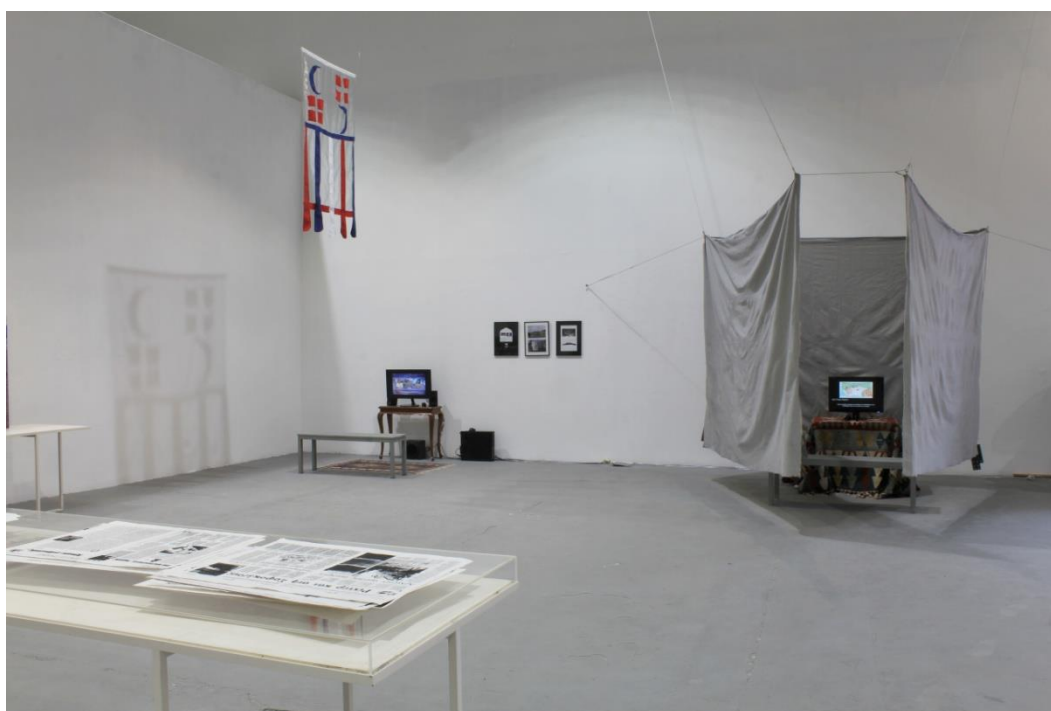
Εικόνα 2, γενική άποψη εγκατάστασης