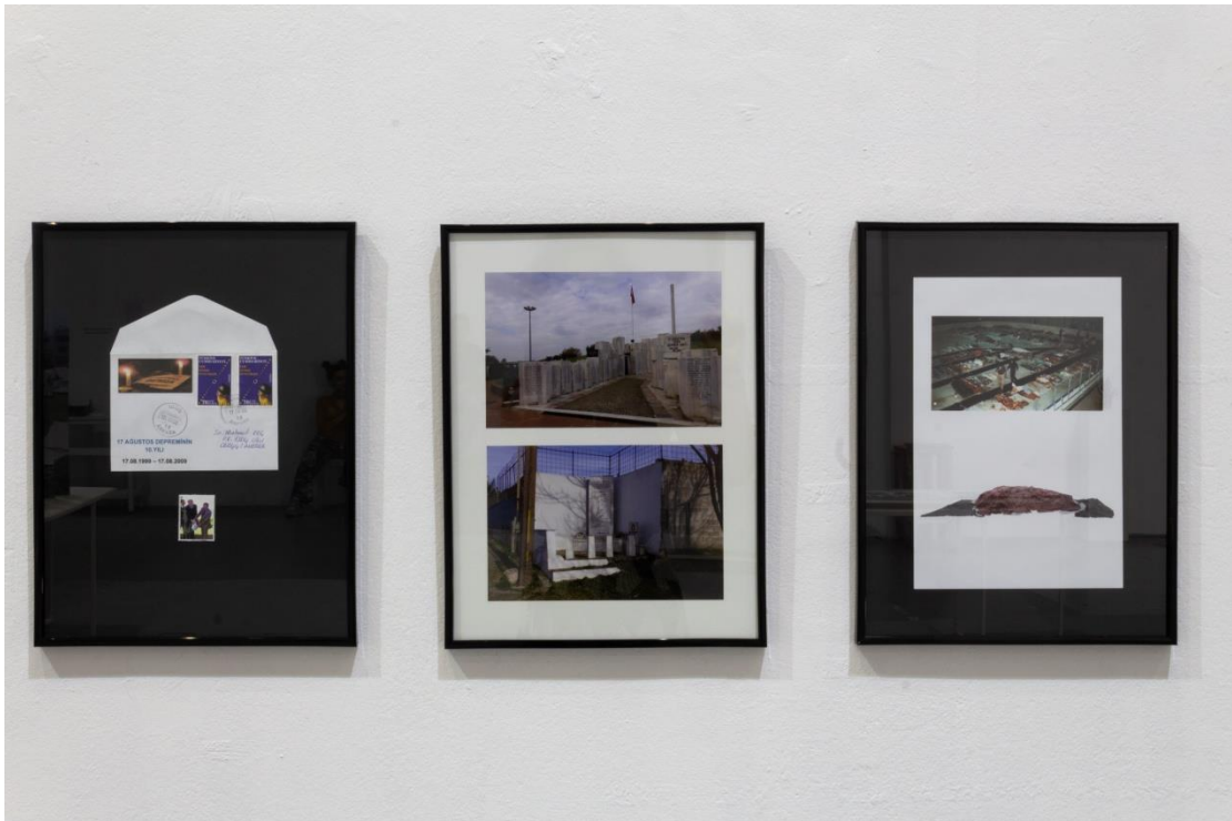
"Parandreou & Cem", 2022