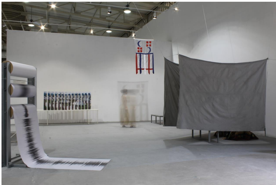
Εικόνα 1, γενική άποψη εγκατάστασης