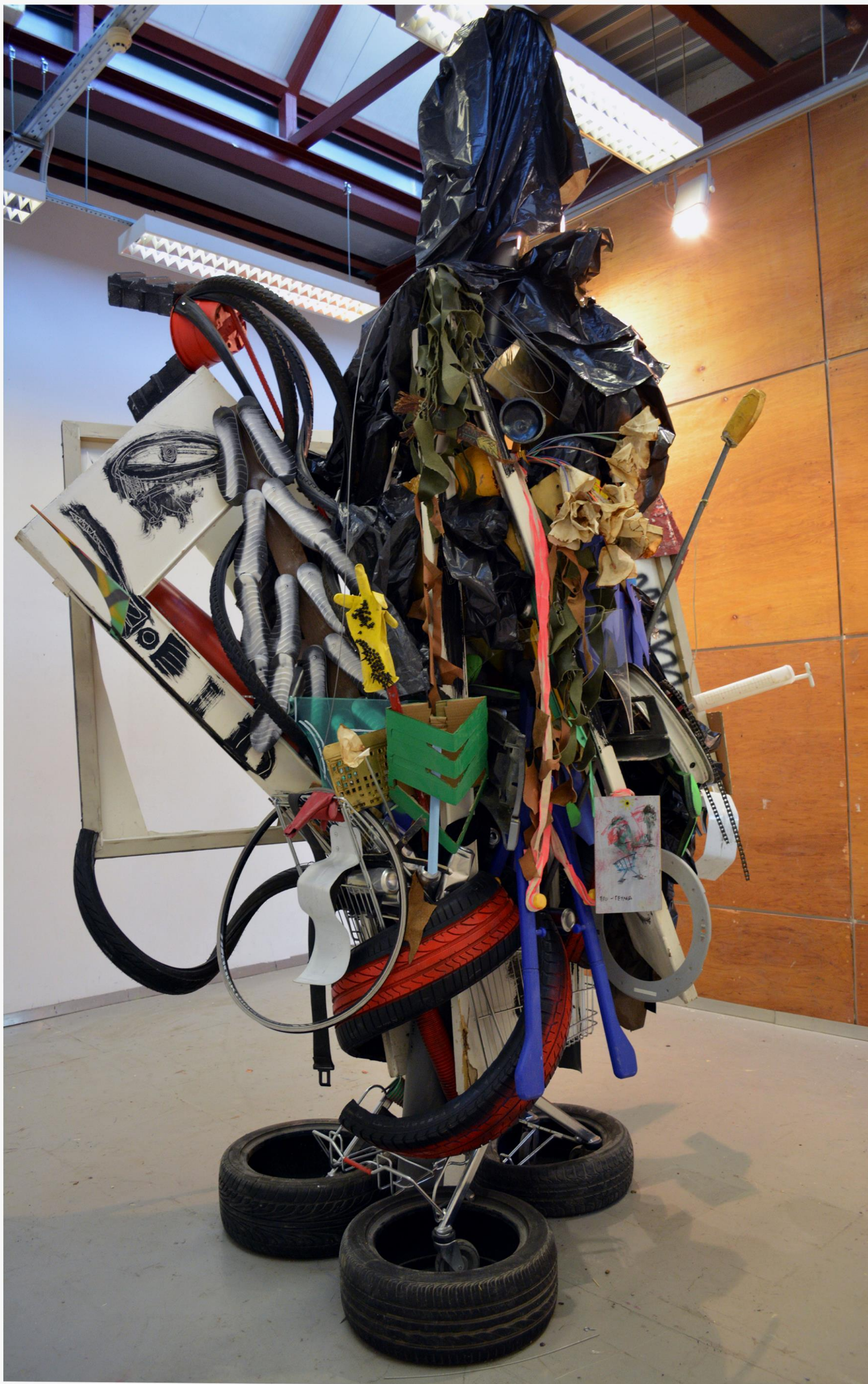
I'll take that too / Διαστάσεις μεταβλητές / 2020/ Πλάγια όψη