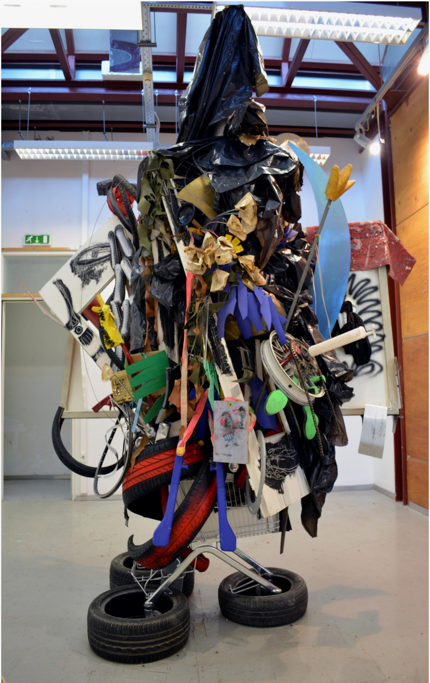
I'll take that too / Διαστάσεις μεταβλητές / 2020/ Πίσω όψη