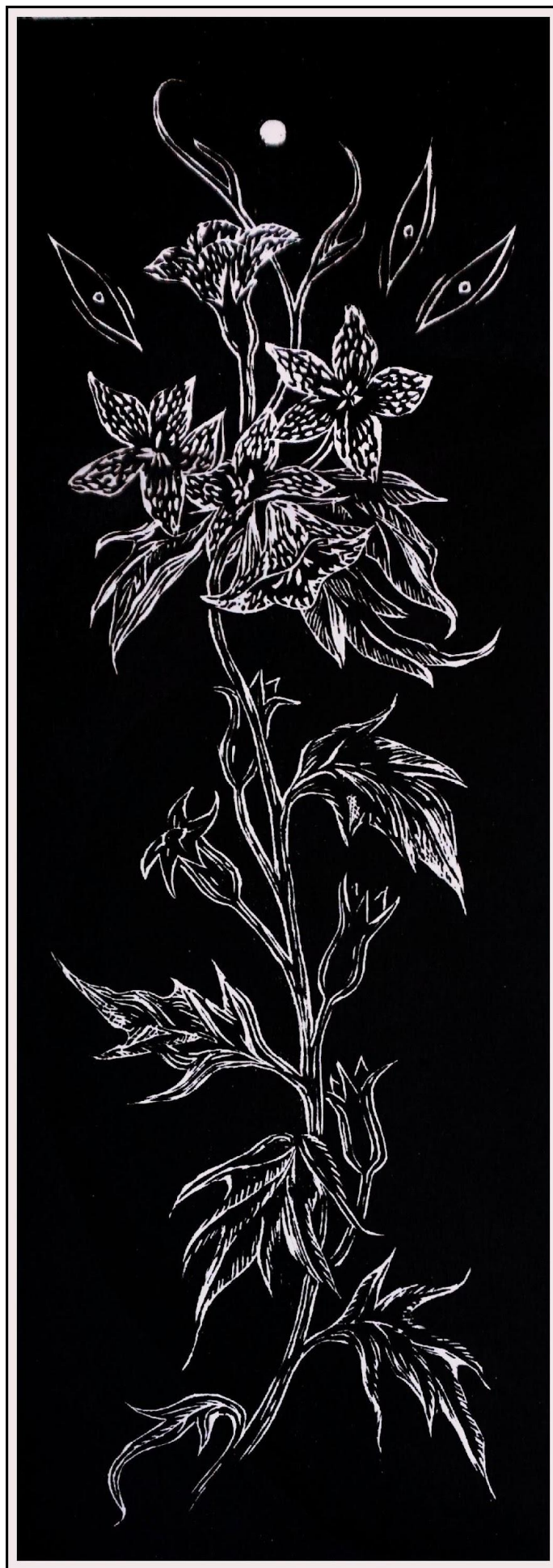
“Yοσκύαμος” 2021, ξυλογραφία, 25x70 εκ