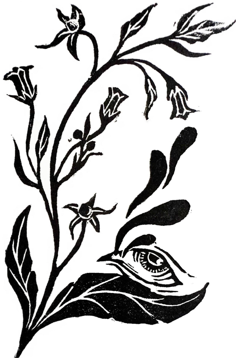
“Μπελαντόνα η άτροπος” 2021, ξυλογραφία, 25x35 εκ