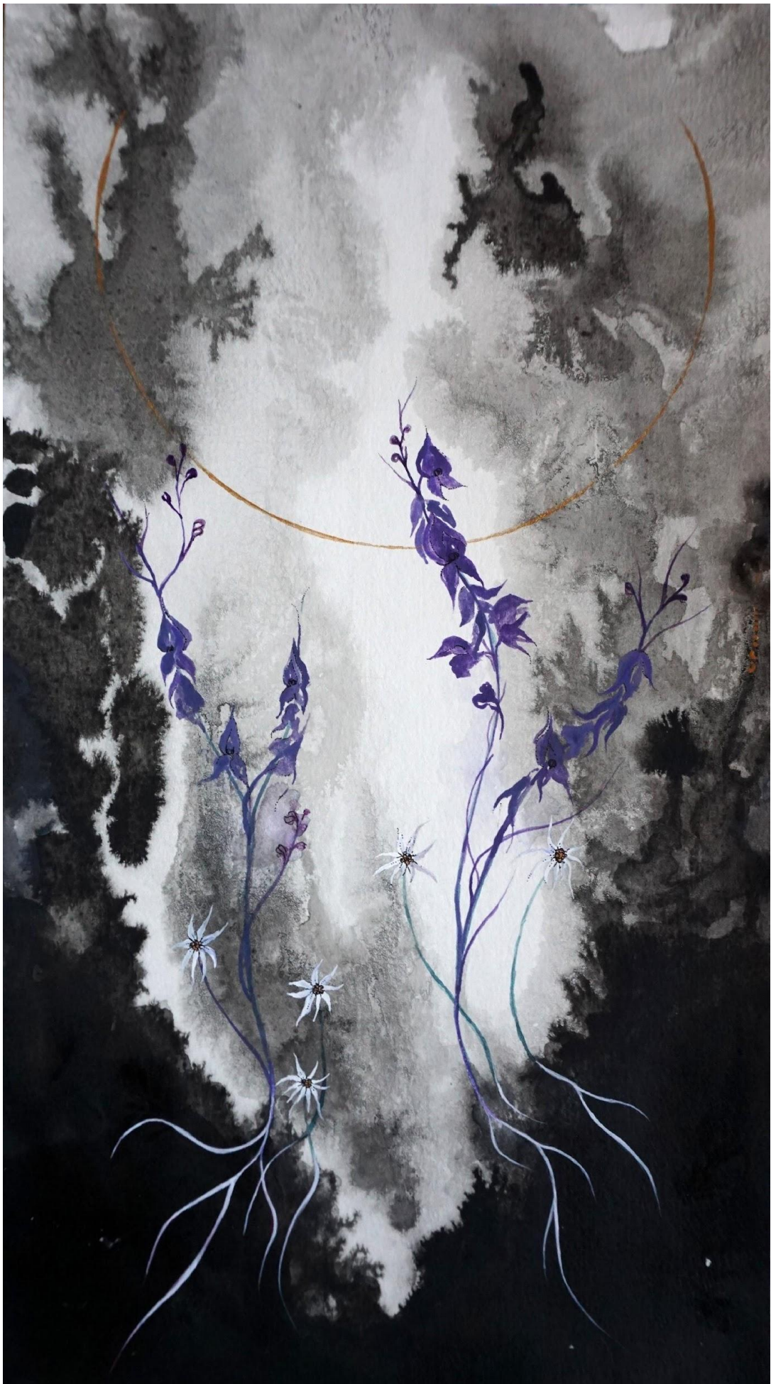
“Ακόνιτο και Εντελβάνις” 2021, ακουαρέλα και μελάνι 20x40 εκ