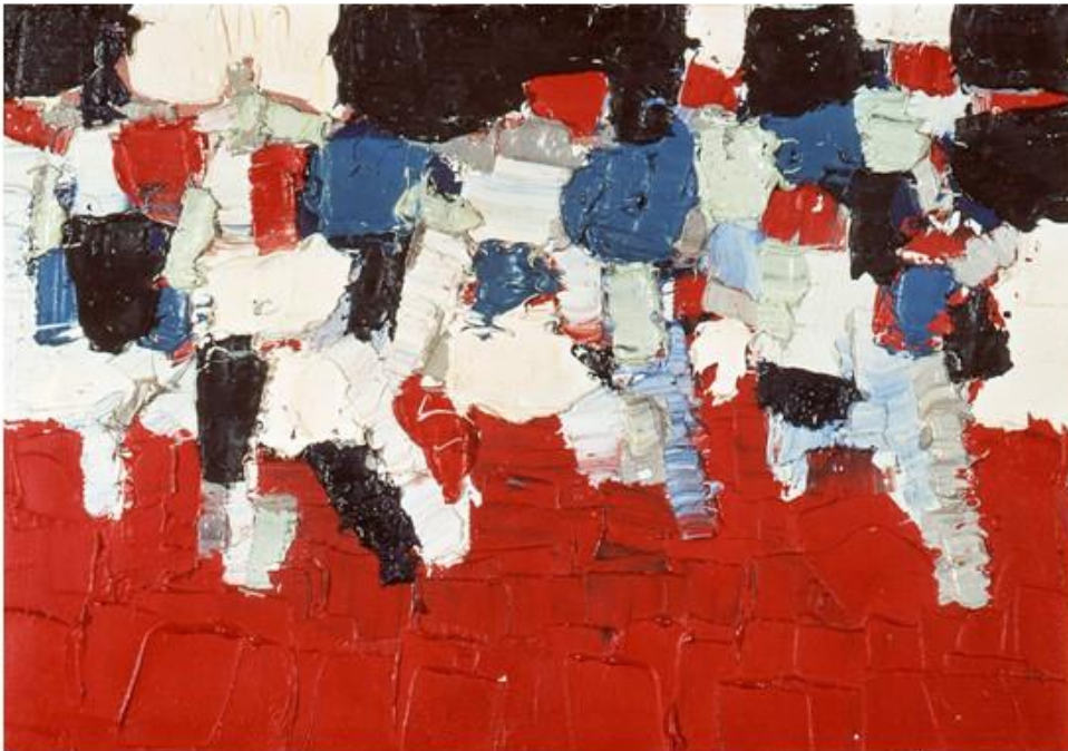
Nicolas de Staël

Η αναφορά στον Nicolas de Staël εντάσσεται στη δική μου πρακτική κυρίως μέσα από τη διαχείριση της ύλης και την επιλογή της απλοποιημένης φόρμας. Ο de Staël, κυρίως στα ώριμα έργα του, δε στηρίζεται καθόλου στη λεπτομέρεια αλλά στη δύναμη της ζωγραφικής ύλης. Η παχύρρευστη πάστα, οι πυκνές στρώσεις και η τάση προς γεωμετρική ή τονική συμπύκνωση φτιάχνουν μια εικαστική γλώσσα που η μορφή είναι πιο πολύ πεδίο έντασης παρά περιγραφική εικόνα. Έτσι, η ζωγραφική αποκτά αυτόνομη δύναμη: γίνεται φορέας ενέργειας, βάρους και σωματικότητας. Η συνάφεια με τον de Staël υποδεικνύει, επομένως, πώς η υλικότητα του μέσου μπορεί να μετατραπεί σε εργαλείο εννοιολογικής έρευνας. Η πάστα δεν είναι διακοσμητικό στοιχείο αλλά αναπαριστά την πίεση, την ένταση και τη βαρύτητα της μάζας, μεταφέροντας τη βιωματική διάσταση του πλήθους στην ίδια τη ζωγραφική επιφάνεια.