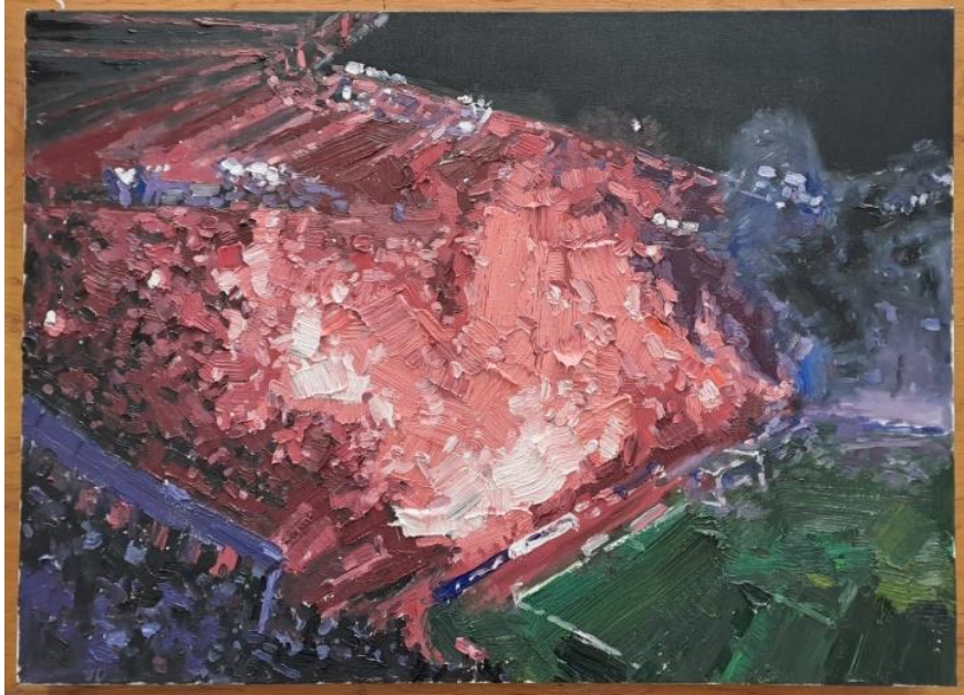
Αιτίλο λάδι σε τελάρα (70x100) 2025