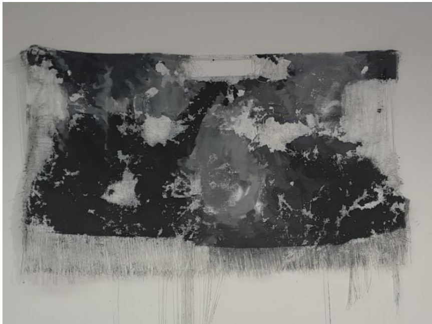
Ατιτίλο 2.35x1,90 Λινάτσα- Ακρίλικο