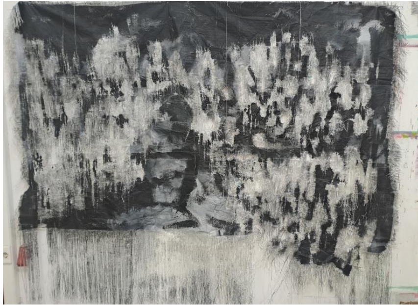
Ατιτίλο 1.20x90 Λινάτσα- Ακρίλικο