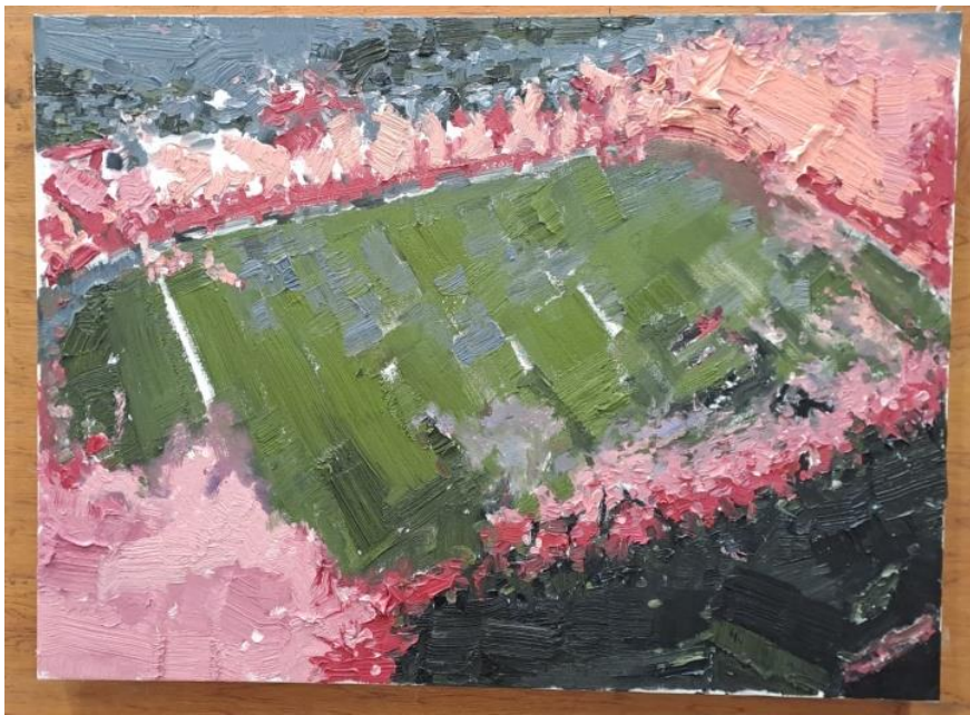
Αιτίλο λάδι σε τελάρα (70x100) 2025