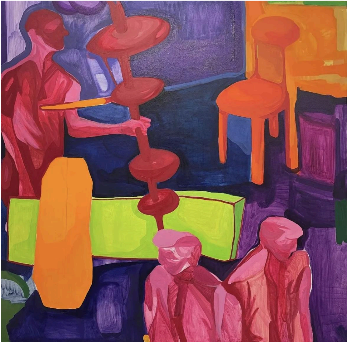
3. «Ανεπαίσθητη παρουσία»