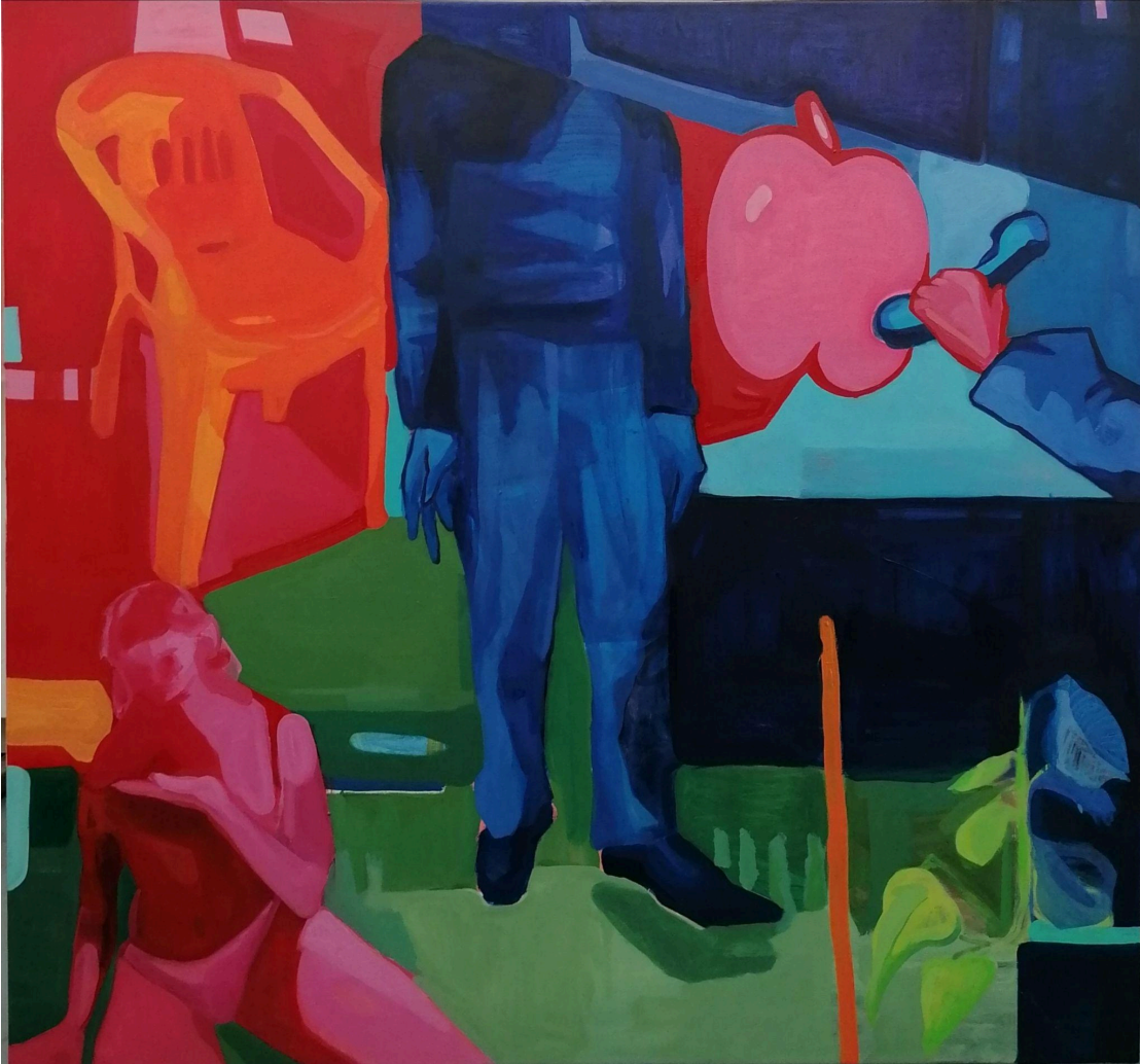
2. «Χωρίς τίτλο»