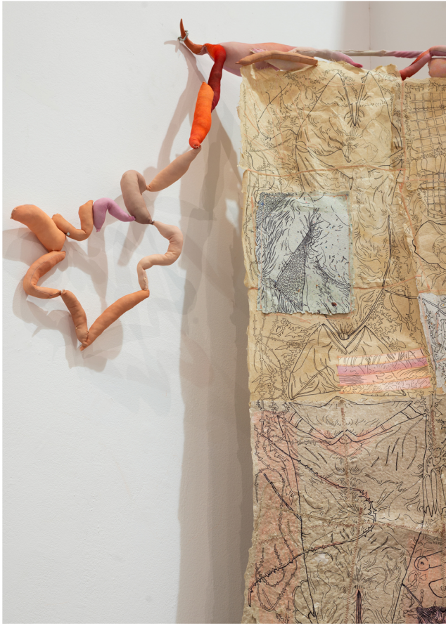
Άτιτλο 7, Χειροποίητα χαρτιά-ραμμένα, πενάκι, ψηφιακή εκτυπωμένο ύφασμα 240 x 130 εκ.