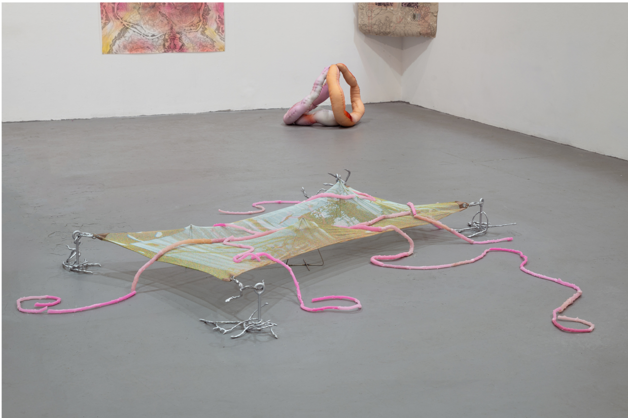
Αττιλο 8, Ψηφιακή εκτύπωση σε ημιδιαφανές ύφασμα, παραφίνη με χρώμα, μεταλλικές λεπτομέρειες, κομμάτια από εποξικό πληρό 30 x 190 x 90 εκ.