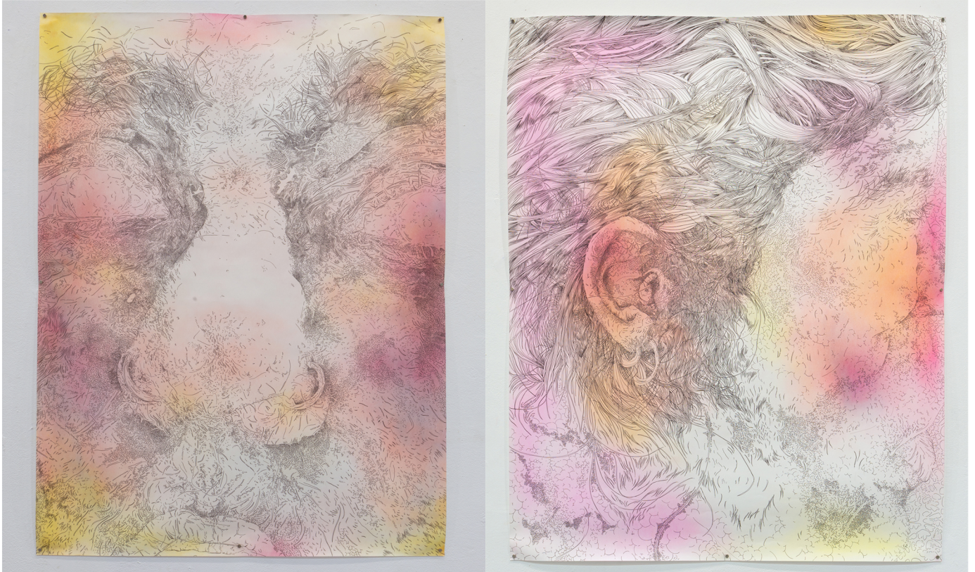
Άτιτλο 3, Ξηρό παστέλ και πενάκι σε χαρτί 150 x 115 εκ.