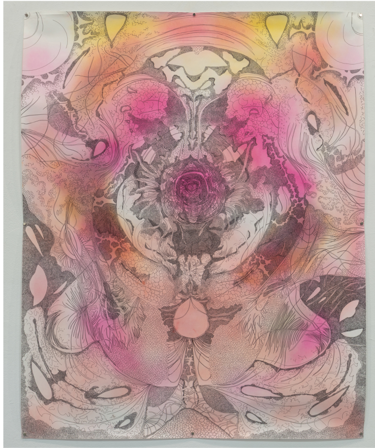
Αττιλο 4, Ξηρό παστέλ και πενάκι σε χαρτί 150 x 120 εκ.