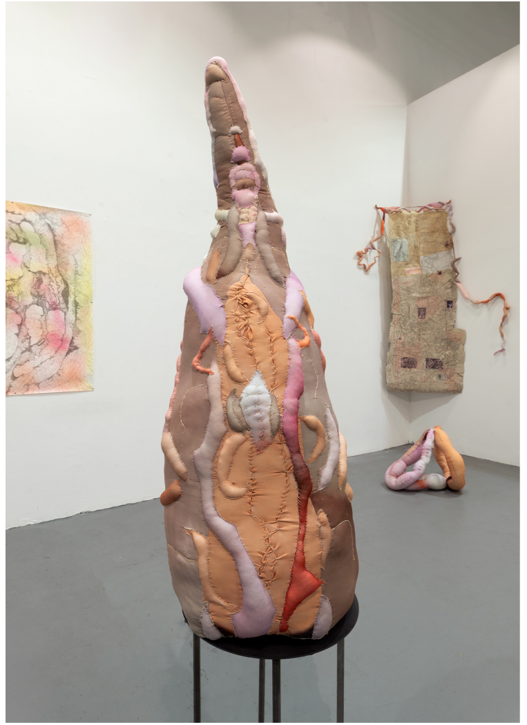
Άτιτλο 9, Ψηφιακά εκτυπωμένο ύφασμα, γέμιση μαξιλαριού, μεταλλική βάση 200 x 30 x 30 εκ.