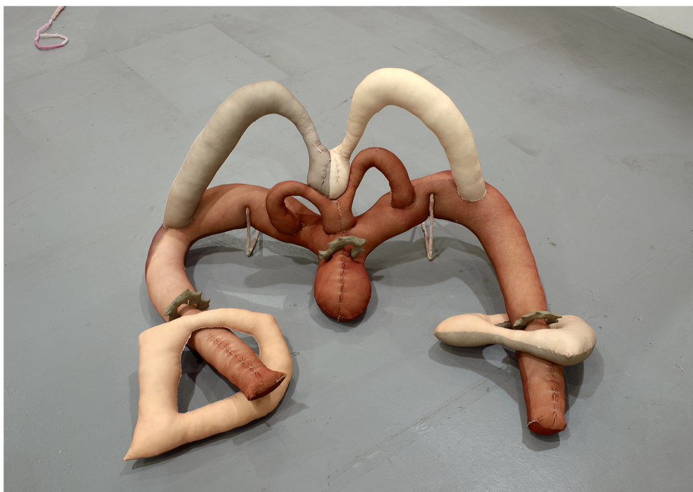
Άτιτλο 11, Ψηφιακά εκτυπωμένο ύφασμα, γέμιση μαξιλαριού, σύρμα, κεραμικά στοιχεία 155 x 100 x 75 εκ.