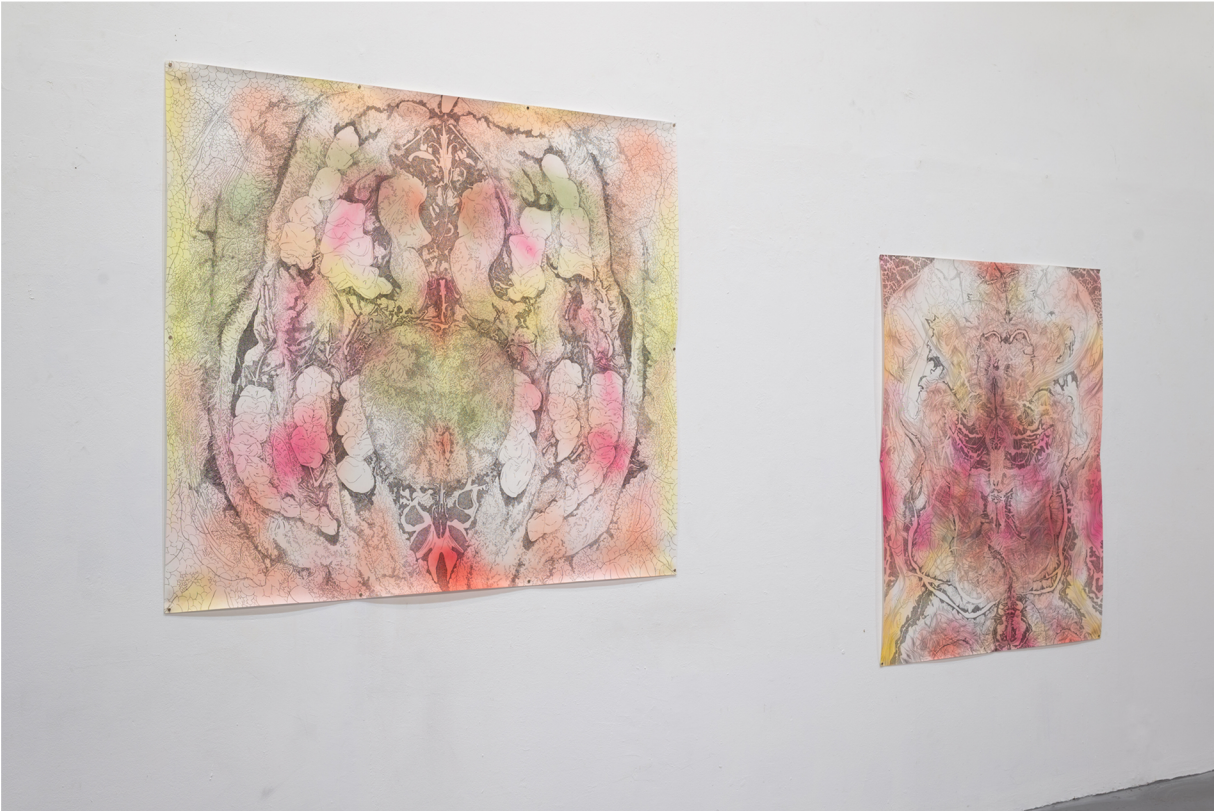
Αιστερά: Άτιτλο 1, Ξηρό παστέλ και πενάκι σε χαρτί 150 x 180 εκ.