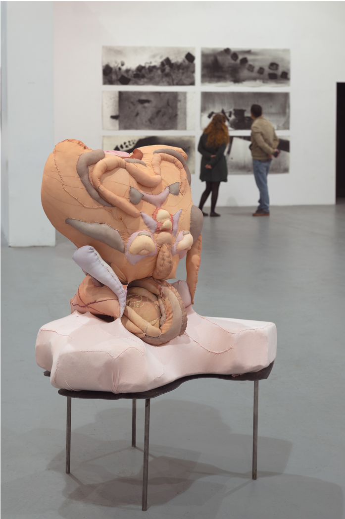
Άτιτλο 10, Ψηφιακά εκτυπωμένο ύφασμα, γέμιση μαξιλαριού, μεταλλική βάση 125 x 100 x 50 εκ..