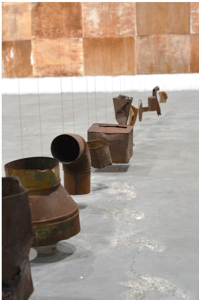
4 ο Μέρος (δώδεκα οξειδωμένα αντικείμενα, κρεμασμένα συνευθειακά από την οροφή)