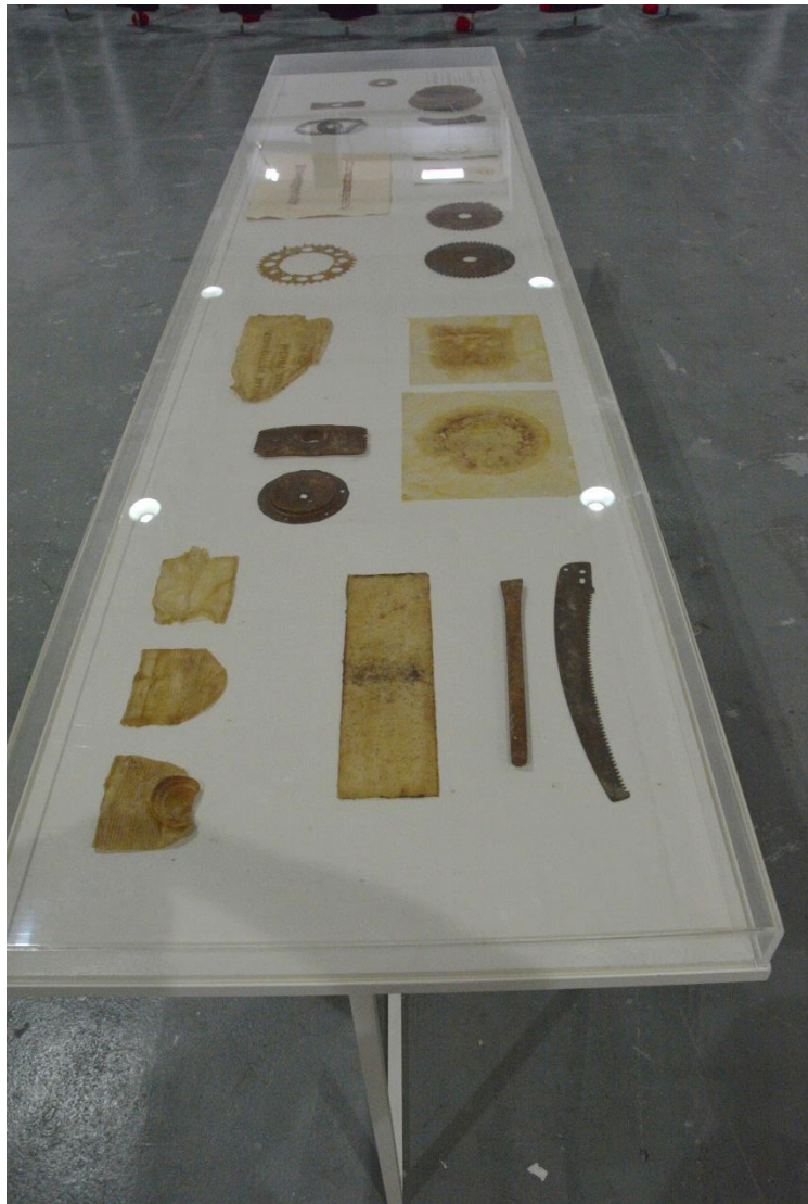
5° Μέρος (η μία από τις δυο προθήκες με οξειδωμένα αντικείμενα και τα αποτυπώματά τους σε χαρτί αφής, χειροποίητο χαρτί και latex)