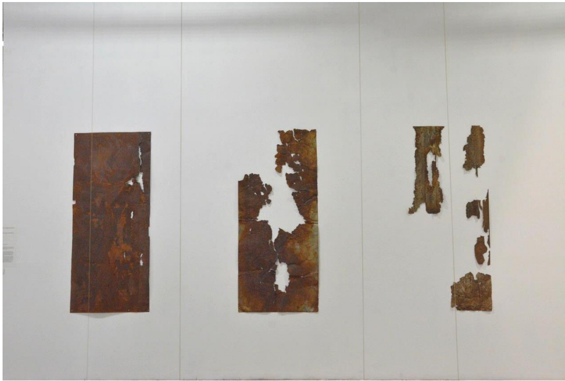
1° Μέρος (τρίπτυχο με οξειδωμένες λαμαρίνες)