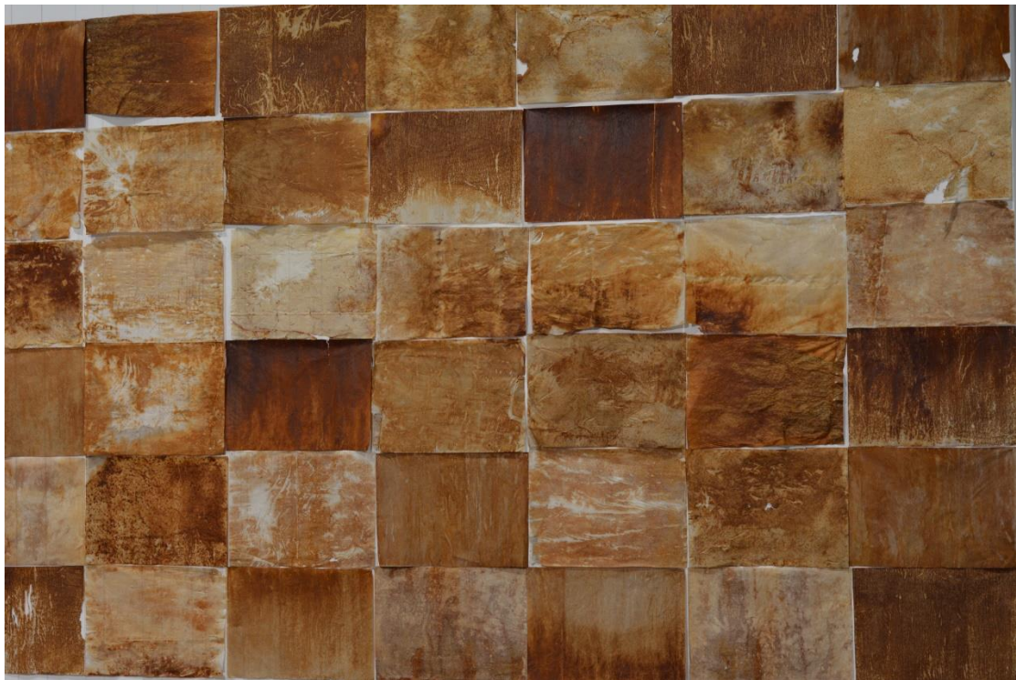
3° Μέρος (Αποτυπώματα με σκουριά πάνω σε χαρτί αφής)