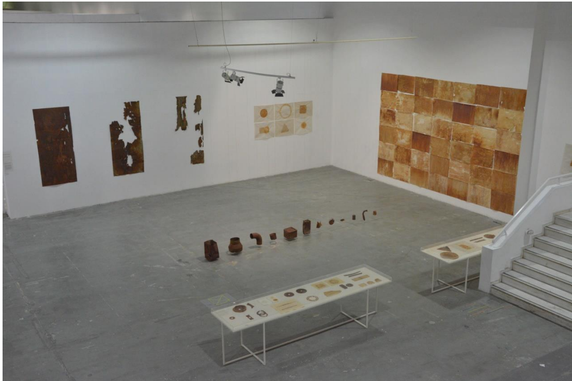
Πανοραμική άποψη της πτυχιακής εργασίας