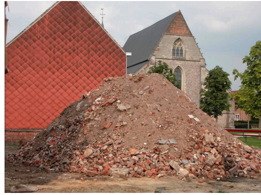
εικόνα 4. Rubble Mountain St Truiden , Lara Almarcegui, 2005