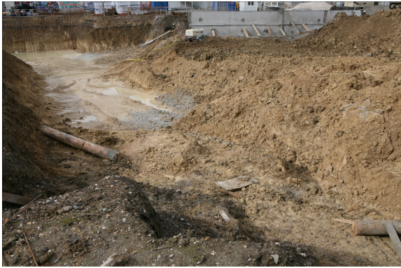
εικόνα 3. Visit to an Excavation Underway , Lara Almarcegui, 2013