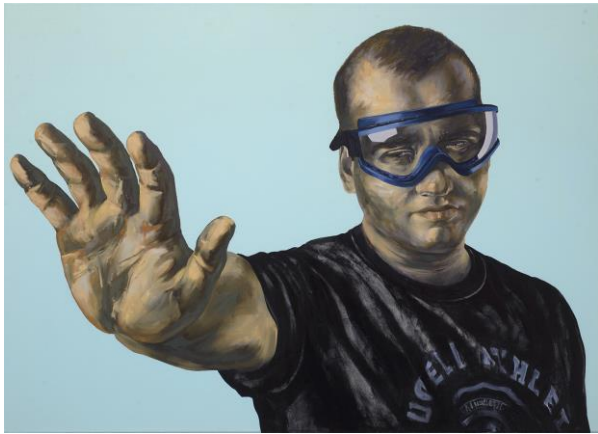
Τίτλος: << Αποστασιοποίηση >> Έτος : 2023 Υλικά: Λάδια σε καμβά Διαστάσεις: 140 x 100 cm