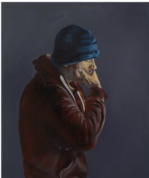
Τίτλος: << Συλλογισμός II >> Έτος : 2023 Υλικά: Λάδια σε καμβά Διαστάσεις: 100 x 120 cm