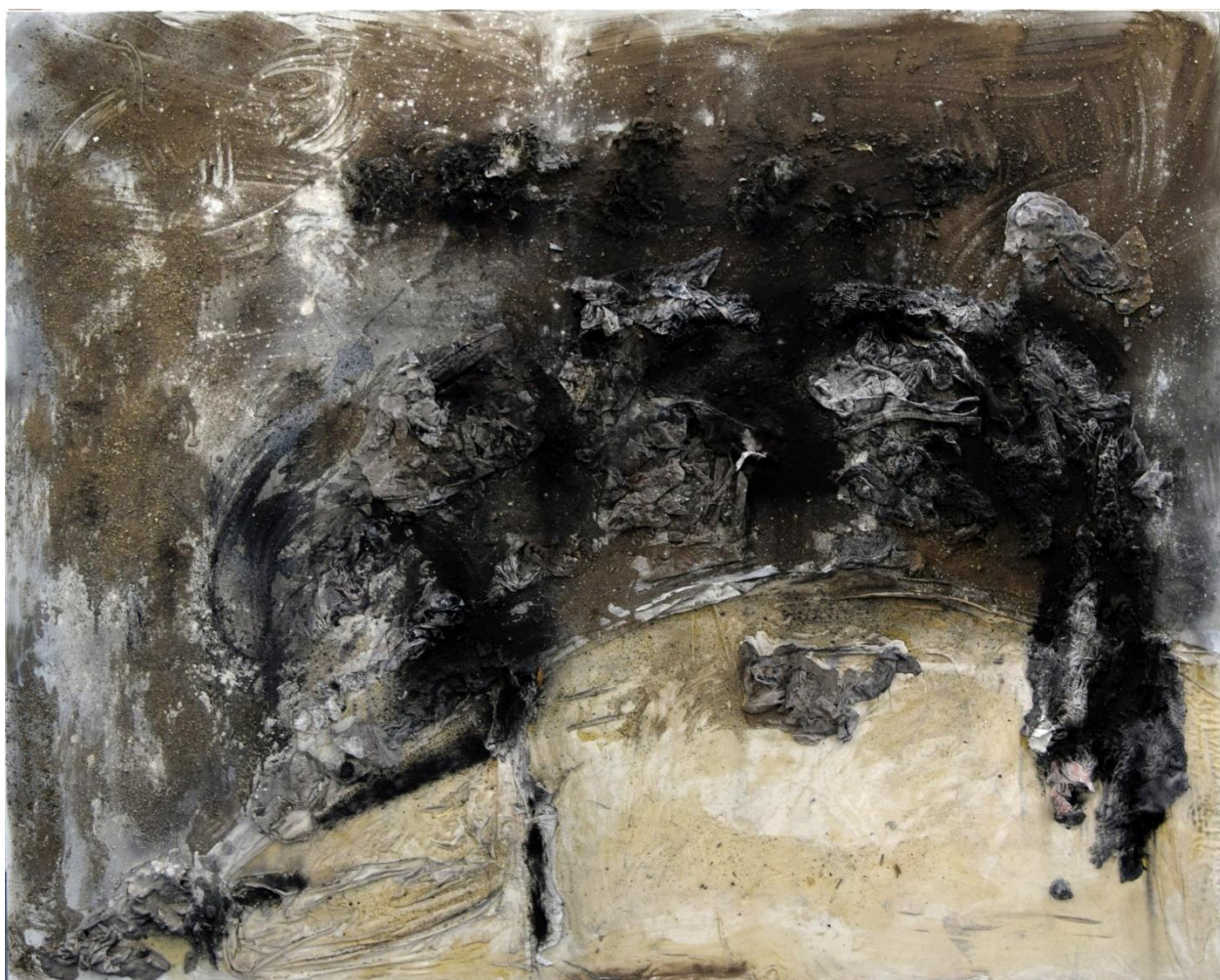
Απομεινάρια Ι, μικτή τεχνική, 200x250εκ, 2024.