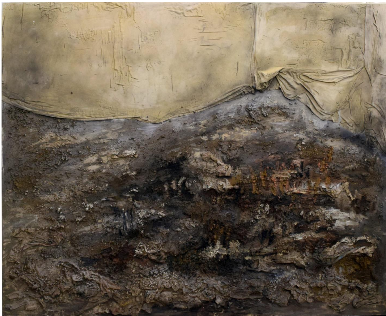
Αποκάλυψη, μικτή τεχνική, 200x250εκ, 2024.