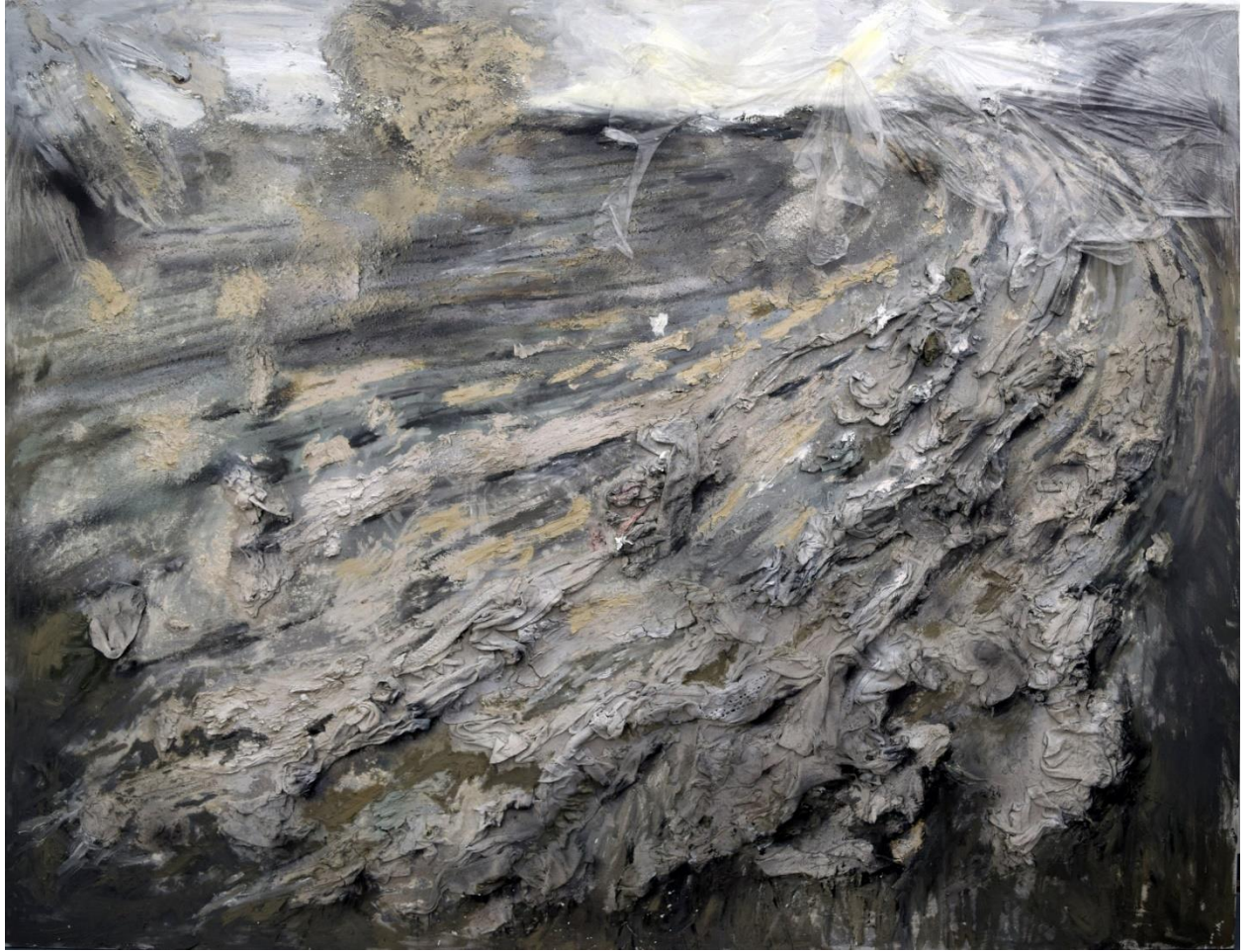
Χωράφι, μικτή τεχνική, 200x250εκ, 2024.