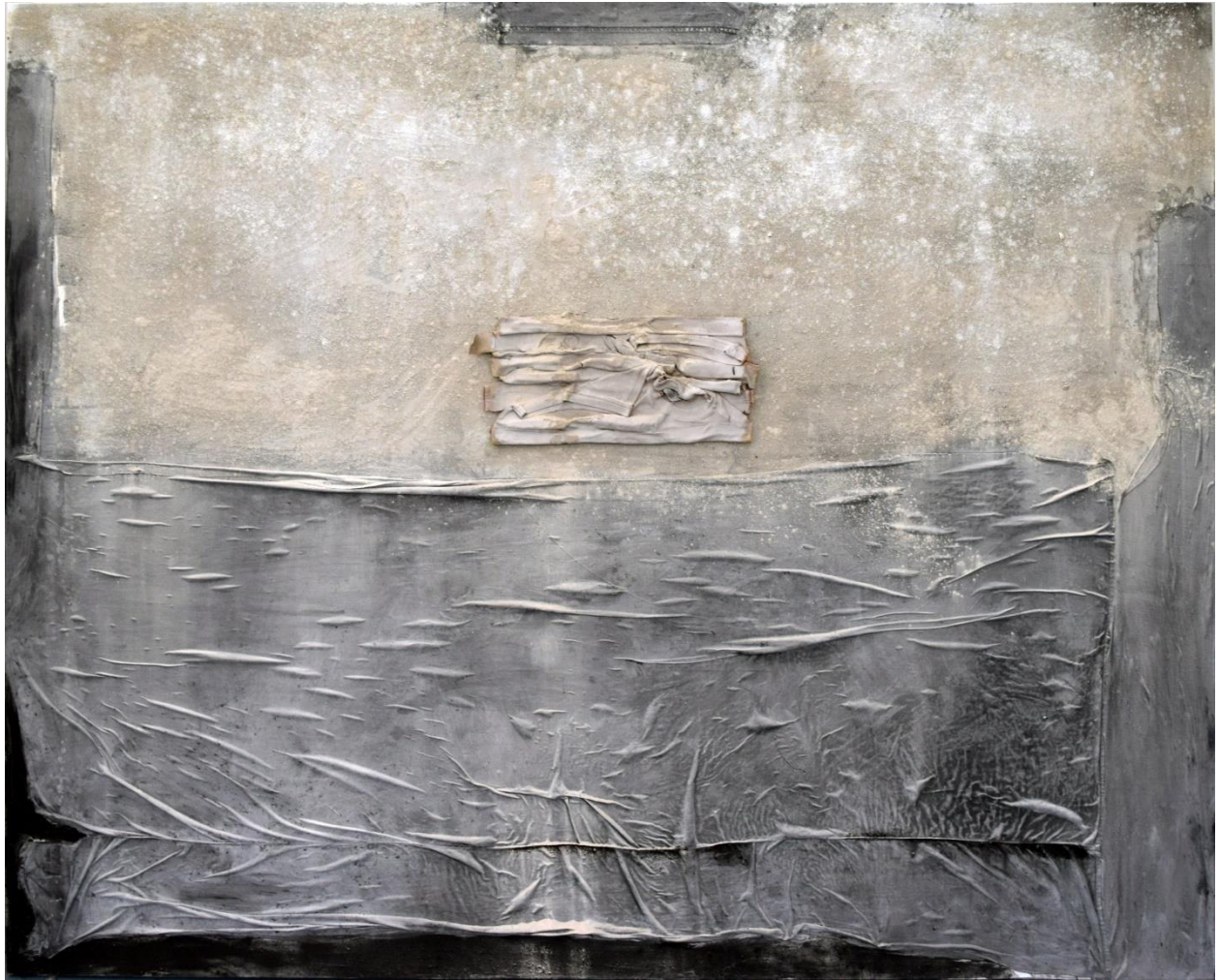
Πέλαγος, μικτή τεχνική, 200x250εκ, 2024.