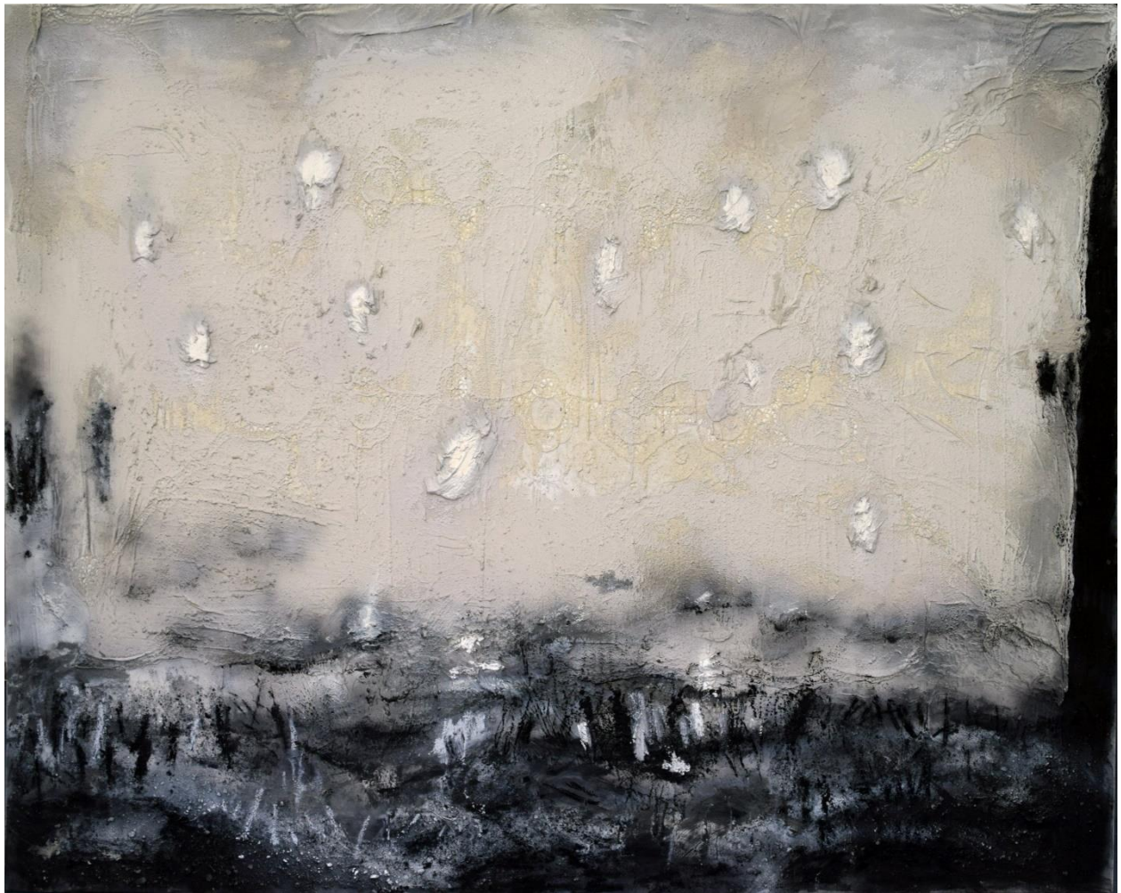
Πληγή, μικτή τεχνική, 200x250εκ, 2024.