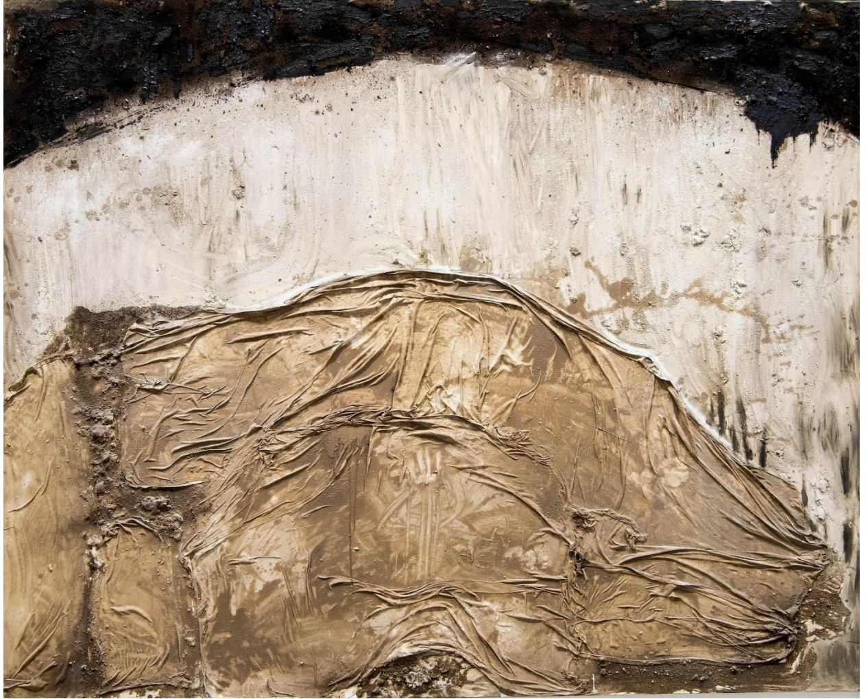
Ανάγλυφο, μικτή τεχνική, 200x250εκ, 2024.