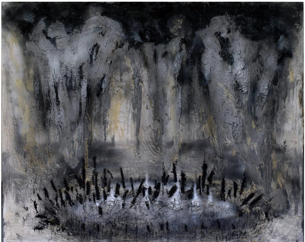
Ψυχές, μικτή τεχνική, 200x250εκ, 2024.