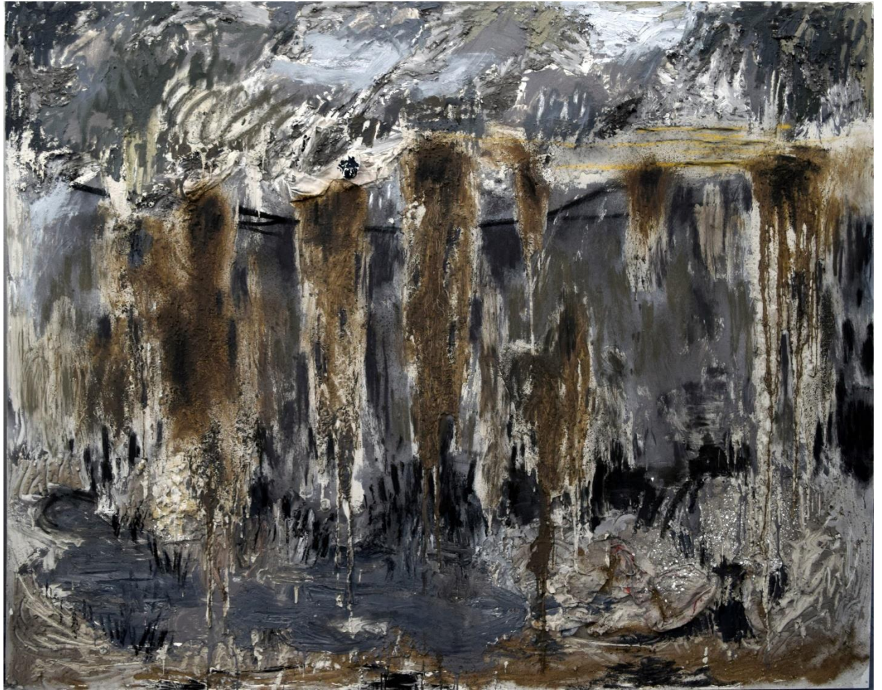
Απόκοσμο, μικτή τεχνική, 200x250εκ, 2024.