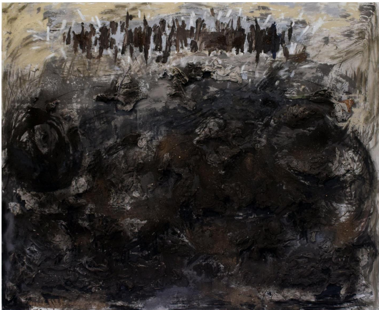
Εκταφή II, μικτή τεχνική, 200x250εκ, 2024.