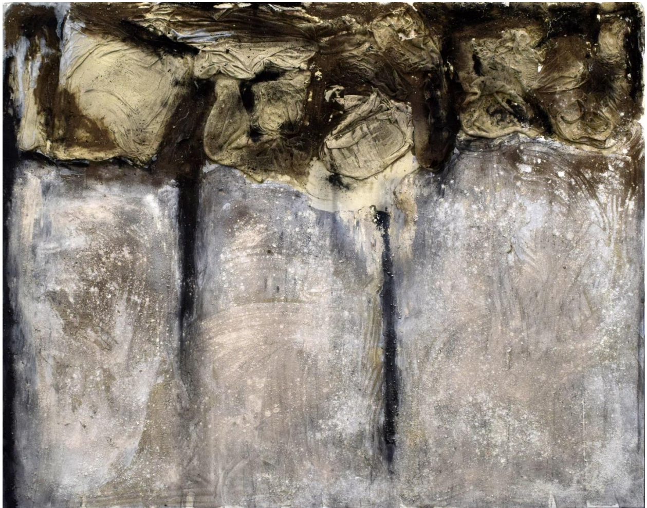
Οδόφραγμα, μικτή τεχνική, 200x250εκ, 2024.