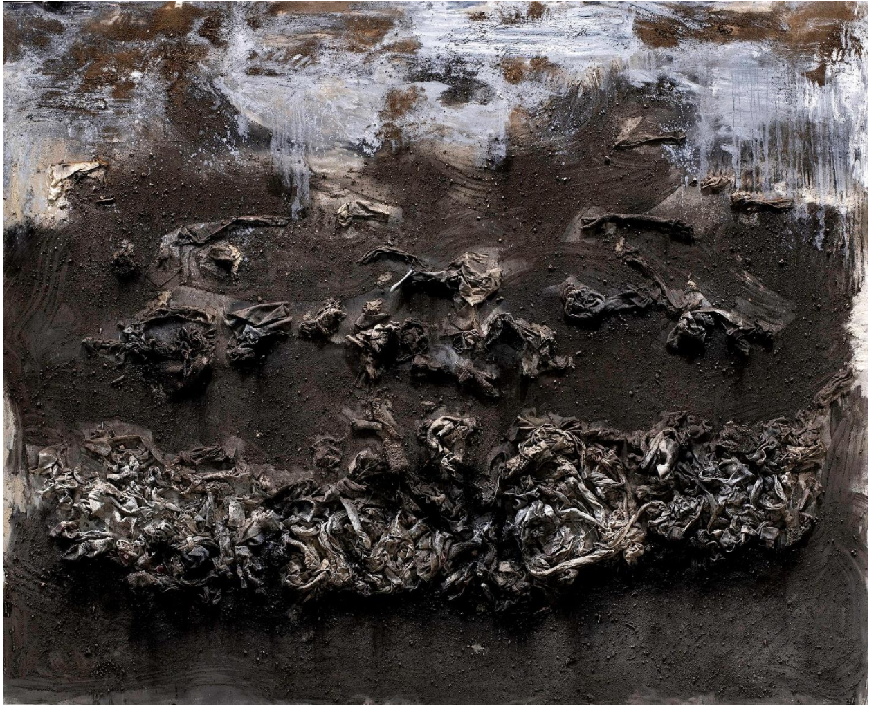
Απομεινάρια II, μικτή τεχνική, 200x250εκ, 2024.