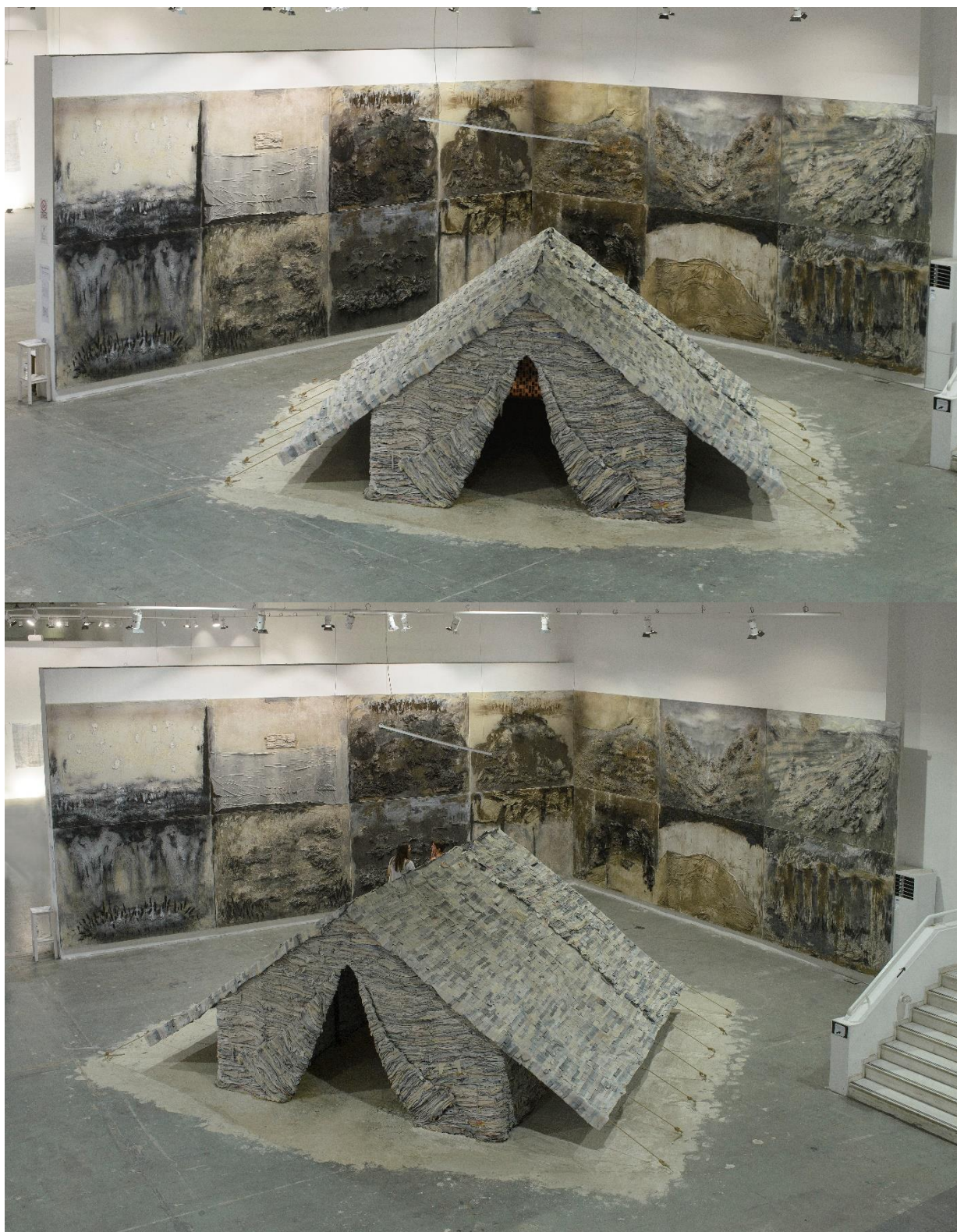
Refugee tent, mixed media, 850x 500 x 250cm, 2024.

Προσφυγικό Αντίσκηνο, μικτή τεχνική, 850 x 500 x 250 εκ, 2024.