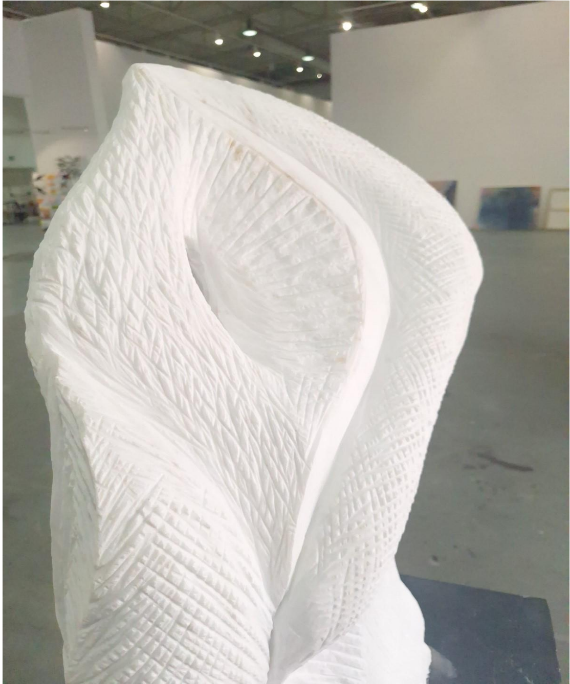
Πληροφορίες έργου: μάρμαρο, 40x80x20 εκ. 2024 Marble, 40x80x20 cm, 2024