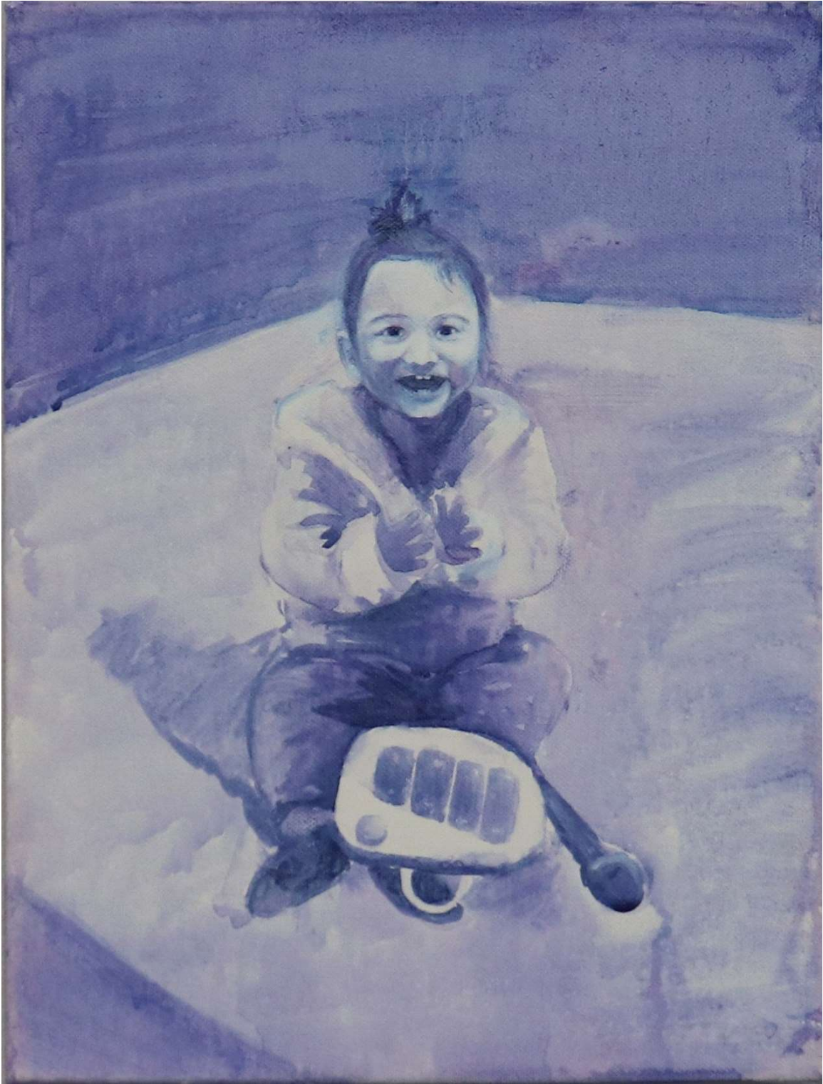
Χωρίς τίτλο ,2022