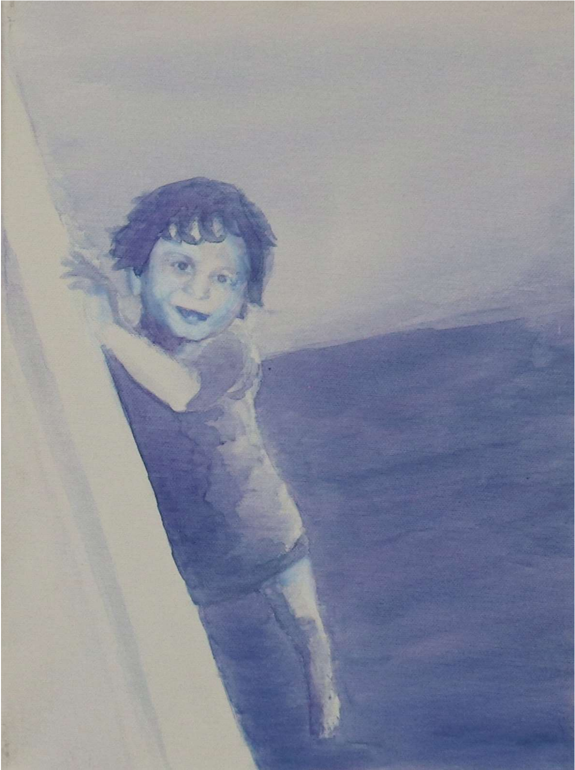
Χωρίς τίτλο ,2022