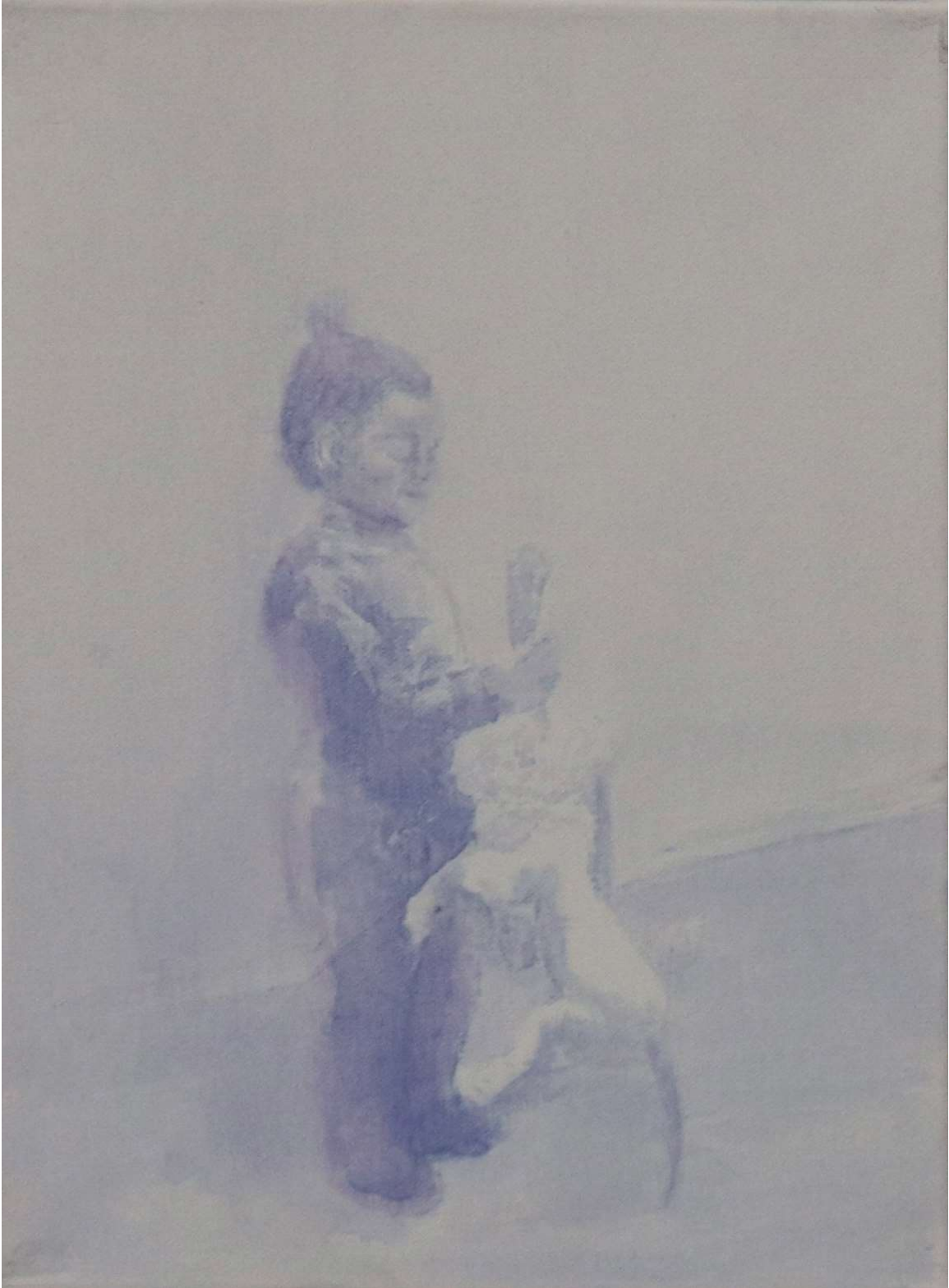
Χωρίς τίτλο ,2022