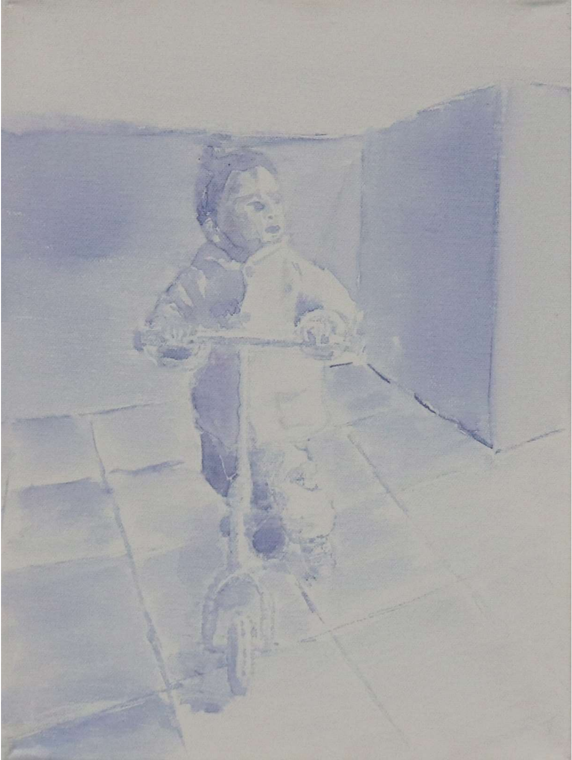
Χωρίς τίτλο ,2022