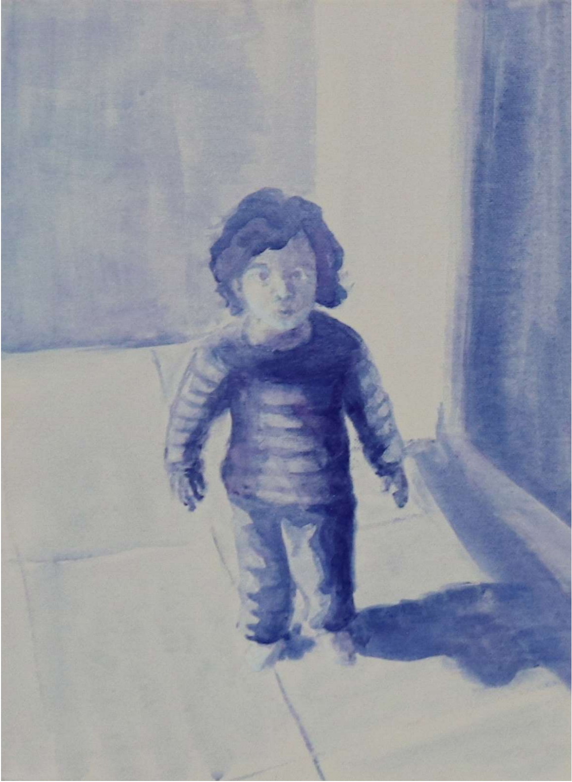
Χωρίς τίτλο ,2022