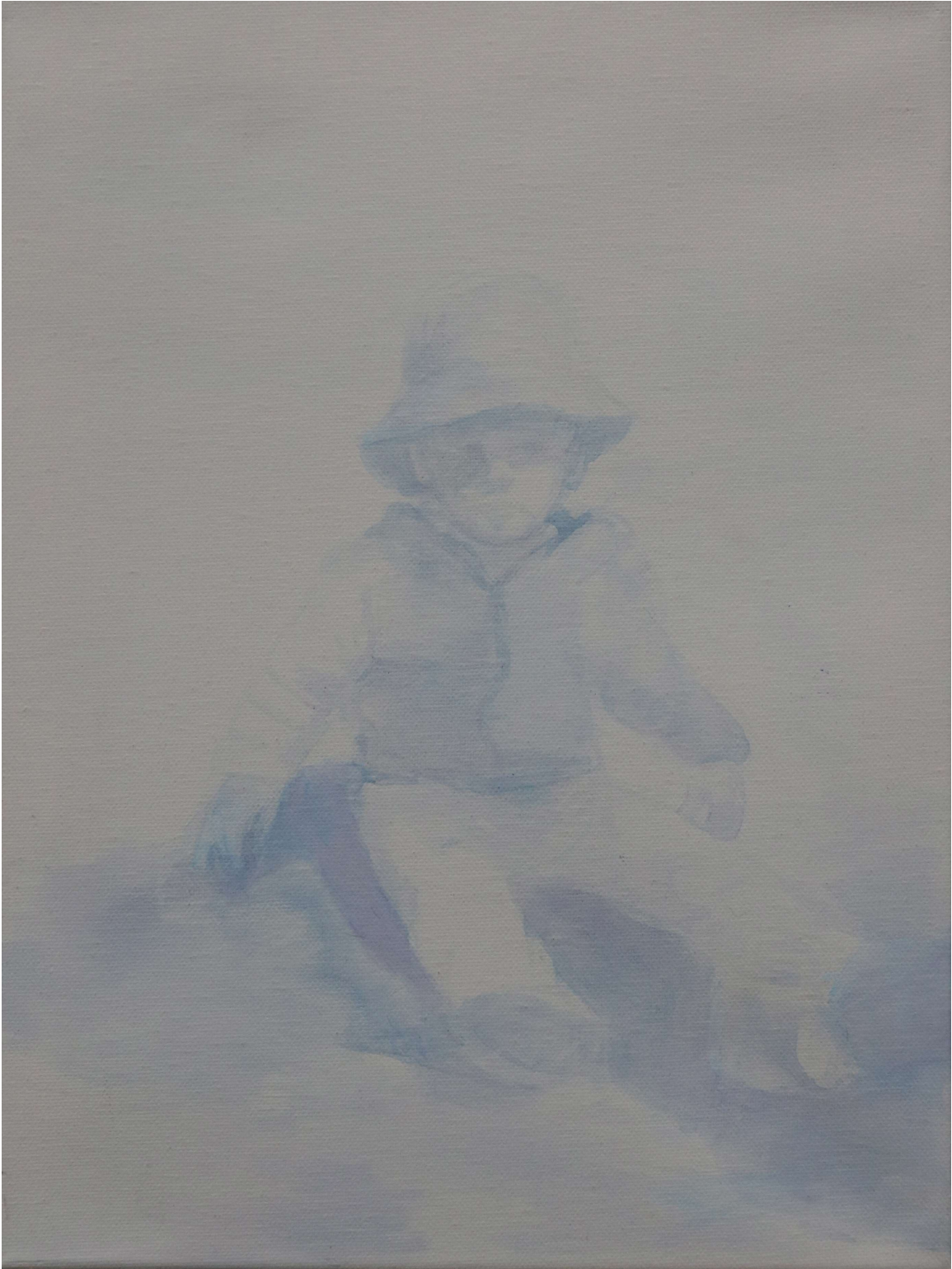
Χωρίς τίτλο ,2023