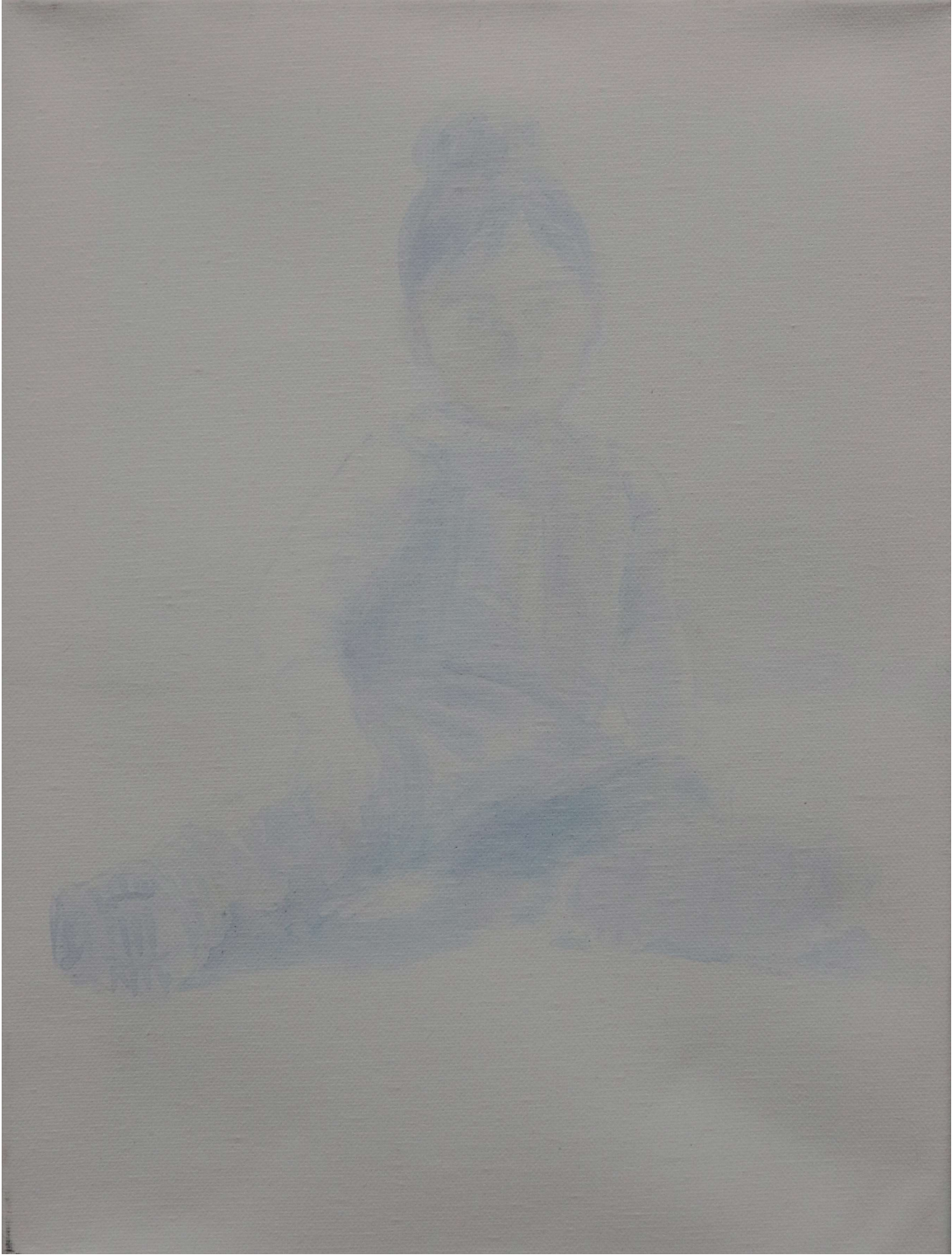
Χωρίς τίτλο ,2023