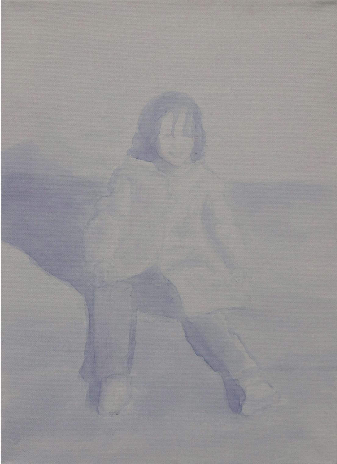
Χωρίς τίτλο ,2022