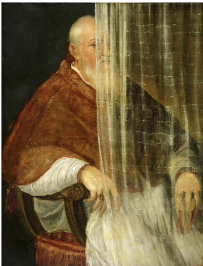
4. Titian, Archbishop Filippo Archinto , 1558

Περπατώντας μέσα στην εγκατάσταση Transparent Colors Conjure Landscapes ο θεατής χάνει από το οπτικό του πεδίο κάποια από τα στοιχεία του έργου για να του αποκαλυφθούν κάποια άλλα. Τα υλικά μοιάζει να παίζουν μεταξύ τους καλύπτοντας σε σημεία το ένα το άλλο, είτε ολοκληρωτικά είτε εν μέρει. Τα έντονα χρώματα, τα φώτα και οι σκιές συμβάλλουν και αυτά στο παιχνίδι με σκοπό να δημιουργηθεί ένα αίσθημα ασάφειας και σαφήνειας την ίδια στιγμή.