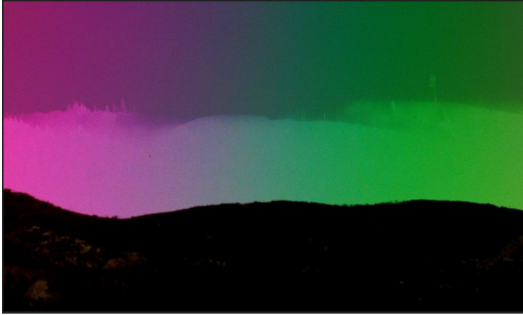
7. Sky Hopinka, στιγμιότυπο από: Anti-objects or spaces without path or boundary , 2017