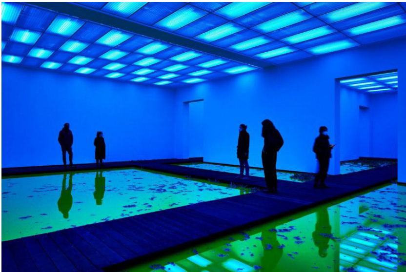
2. Olafur Eliasson, Life , 2021

Εξάλλου όπως αναφέρει ο Olafur Eliasson (1967) με αφορμή το έργο του Life στο ίδρυμα Beyeler της Ελβετίας το 2021: «Η ζωή δεν έχει ξεκάθαρα όρια, δεν έχει στεγανά και σίγουρα δεν παραμένει ποτέ σταθερή, αλλάζει, μεταμορφώνεται συνεχώς μέσα από την προσωρινή συνύπαρξη των ζωντανών στοιχείων της». 10