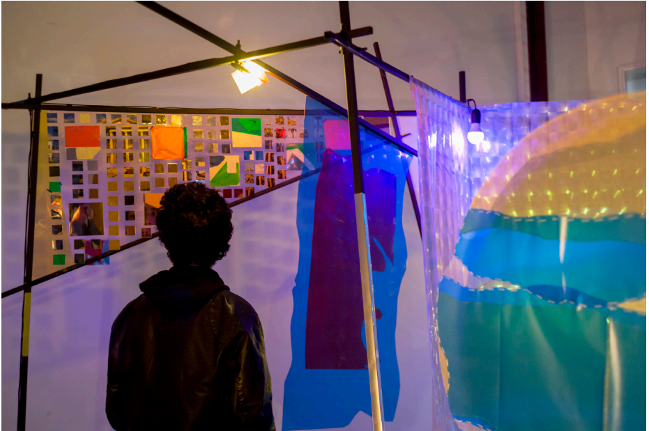
Λεπτομέρεια από την εγκατάσταση Transparent Colors Conjure Landscapes, 2022