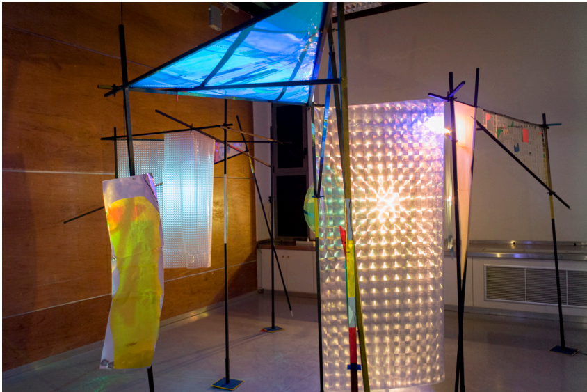
Transparent Colors Conjure Landscapes , 2022