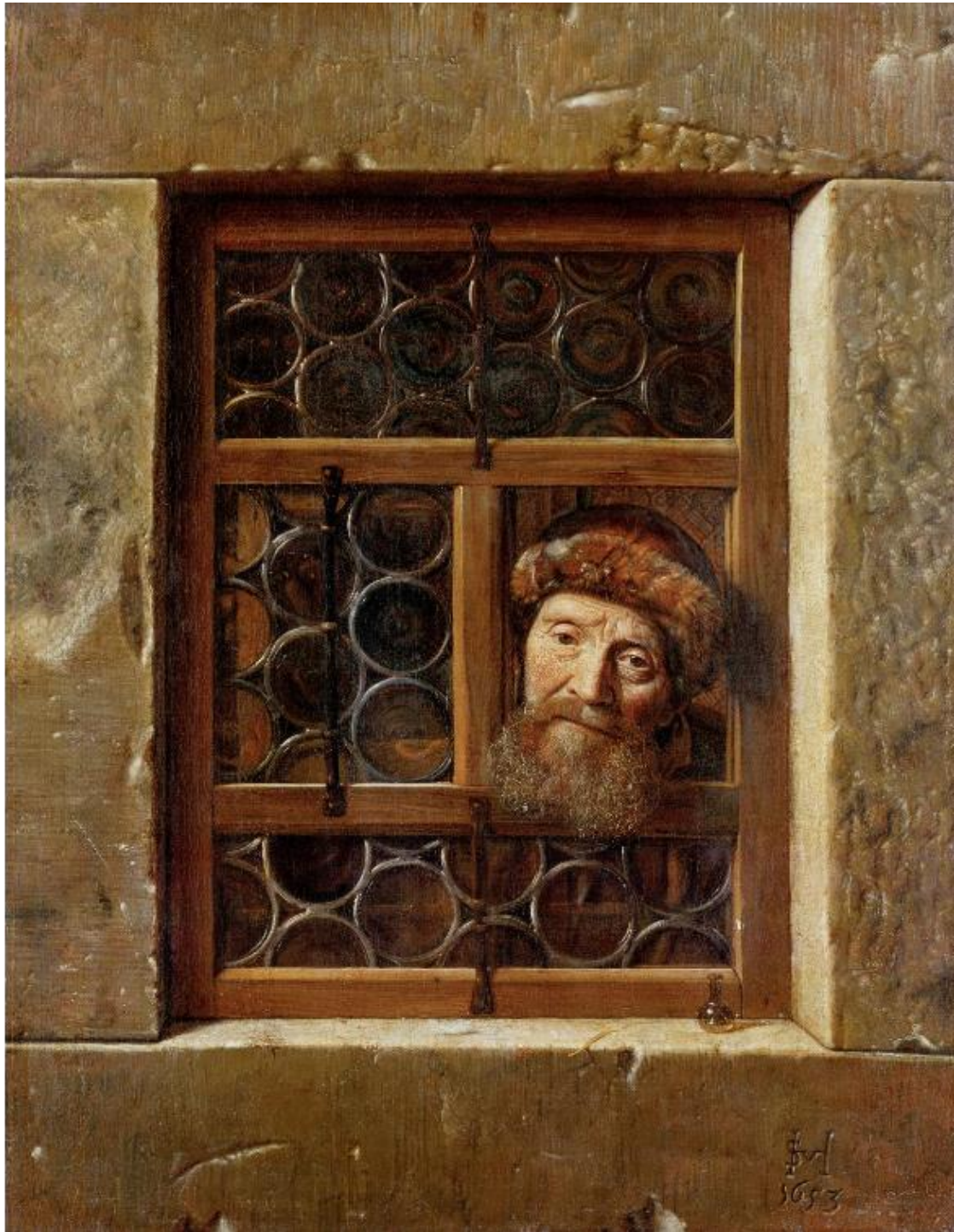
Εικ. 5. Samuel Van Hoogstraten, Ηλικιωμένος άνδρας στο παράθυρο , 1653, λάδι σε καμβά, 111 x 86,5 εκ. (χωρίς κάδρο), Kunsthistorisches Museum Wien, Gemäldegalerie, Βιέννη.