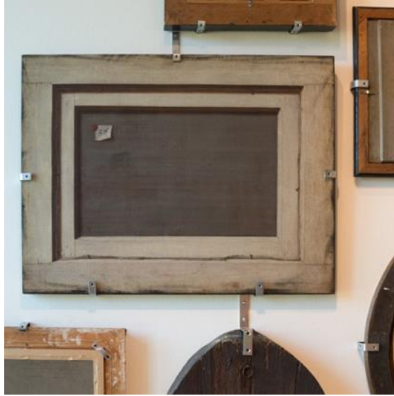
Εικ. 2. Φωτογραφία από την έκθεση Flip Sides / Bagsider , Σεπτέμβριος 2018 - Μάρτιος 2019, Statens Museum for Kunst, Κοπεγχάγη.