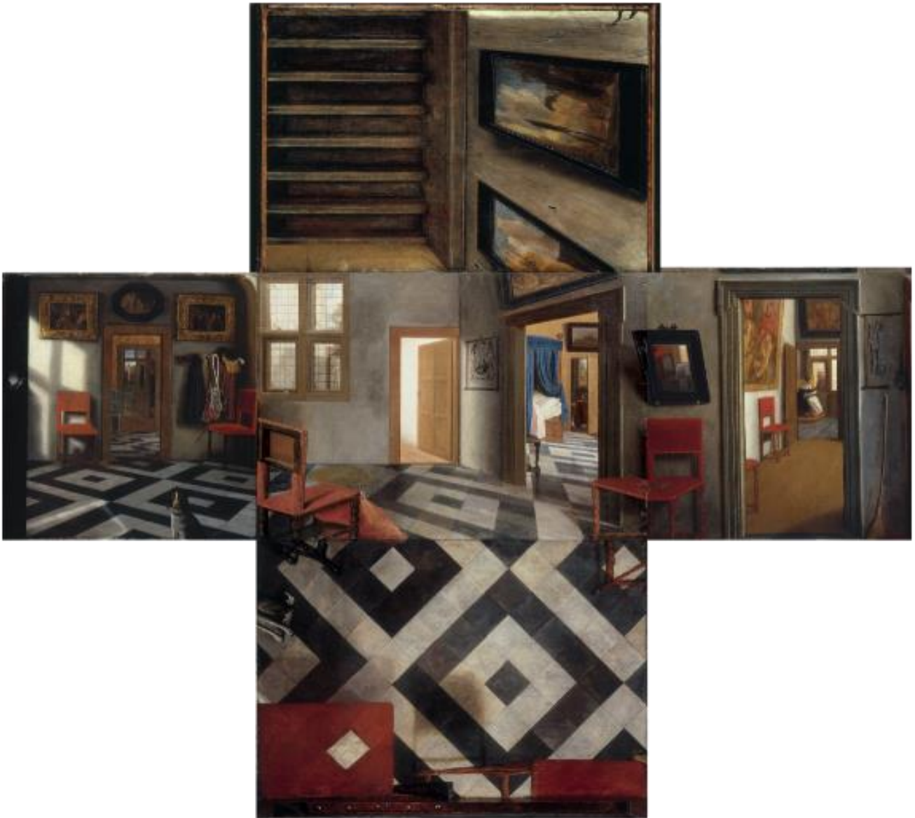
Εικ. 8. Samuel Van Hoogstraten, Προοπτικό κουτί με απόψεις εσωτερικού ολλανδικής κατοικίας , 1655-1660, λάδι και αυγό σε ξύλο, 58 x 88 x 60.5 εκ., The National Gallery, Λονδίνο.