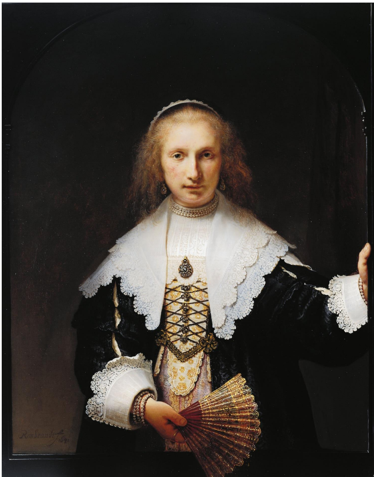
Εικ. 11. Rembrandt van Rijn, Αγκαθα Μπας , 1641, λάδι σε καμβά, 105.4 x 83.9 εκ. (χωρίς κάδρο), Royal Collection Trust, Λονδίνο.