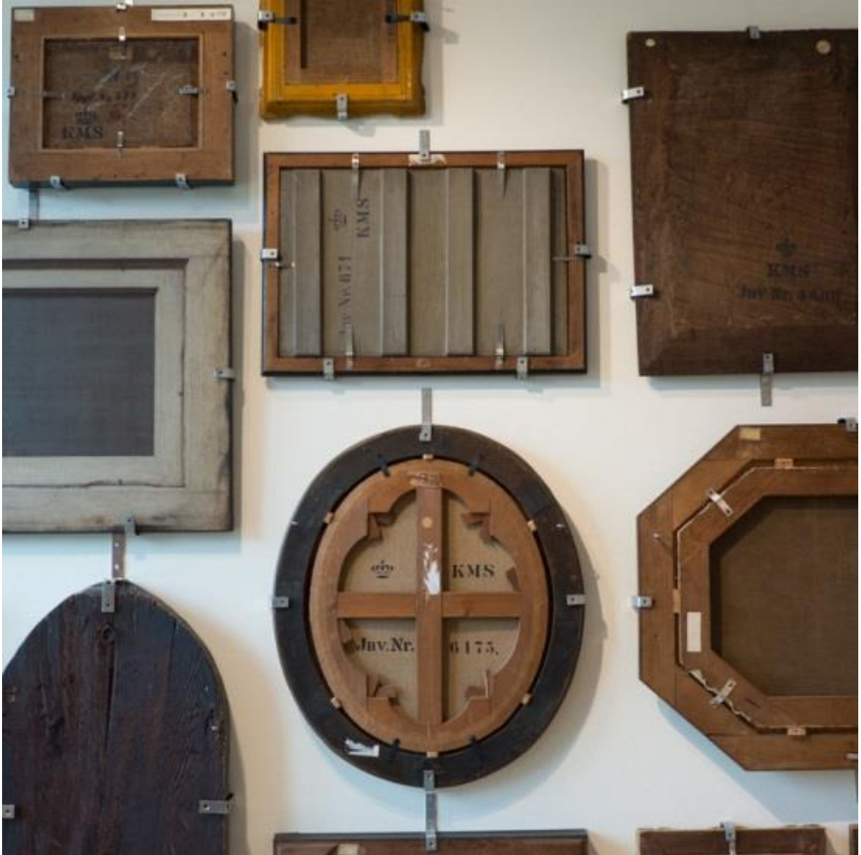
Εικ. 1. Φωτογραφία από την έκθεση Flip Sides / Bagsider , Σεπτέμβριος 2018 - Μάρτιος 2019, Statens Museum for Kunst, Κοπεγχάγη.