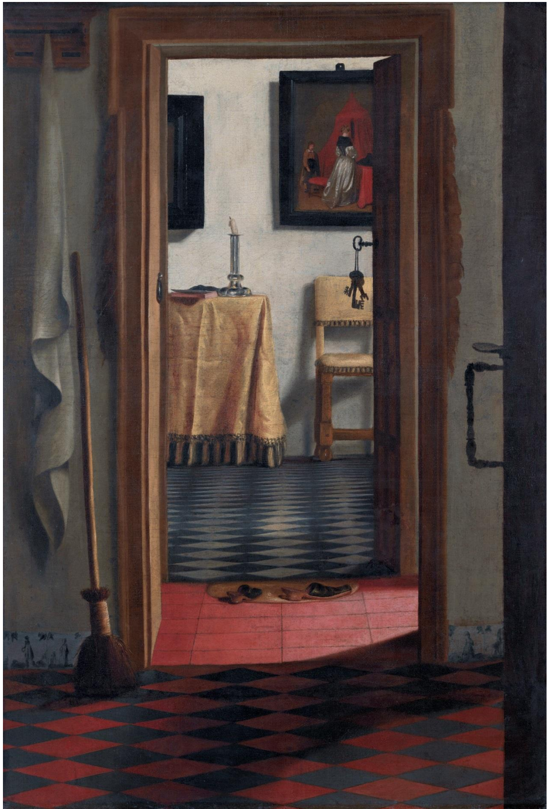
Εικ. 10. Samuel van Hoogstraten, Οι παντόφλες ή Αποψη εσωτερικού χώρου , 1650-1675, λάδι σε καμβά, 103 x 70 εκ., Musée du Louvre, Département des Peintures, Παρίσι.