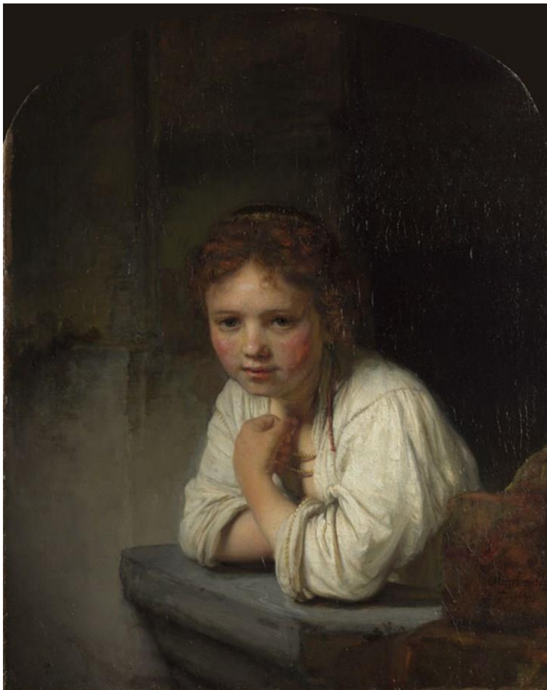
Εικ. 4. Rembrandt Harmensz van Rijn, Κορίτσι στο παράθυρο , 1645, λάδι σε καμβά 81.8 x 66.2 εκ., Dulwich Picture Gallery, Λονδίνο.