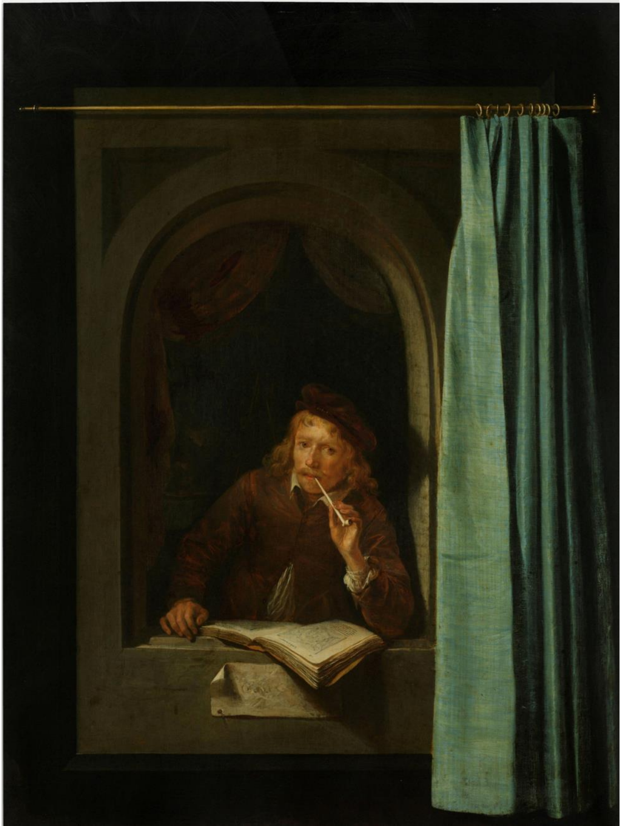
Εικ. 12. Gerard Dou, Άνδρας που καπνίζει πίπα , 1650, λάδι σε καμβά, 48 x 37 εκ., Rijksmuseum, Άμστερνταμ.