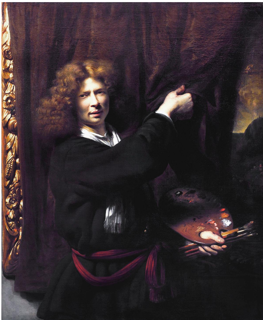
Εικ. 6. Cornelis Bisschop, Αυτοπροσωπογραφία ως Ζεύξις , 1668, λάδι σε καμβά, 117 x 98.6 εκ., Dordrechts Museum, Ντόρντρεχτ.