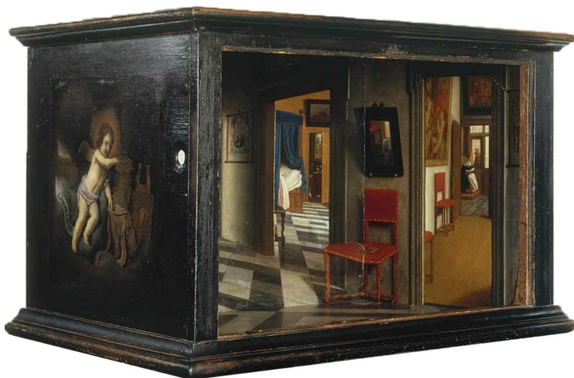
Εικ. 7. Samuel Van Hoogstraten, Προοπτικό κουτί με απόψεις εσωτερικού ολλανδικής κατοικίας , 1655-1660, λάδι και ανγό σε ξύλο, 58 x 88 x 60.5 εκ., The National Gallery, Λονδίνο.