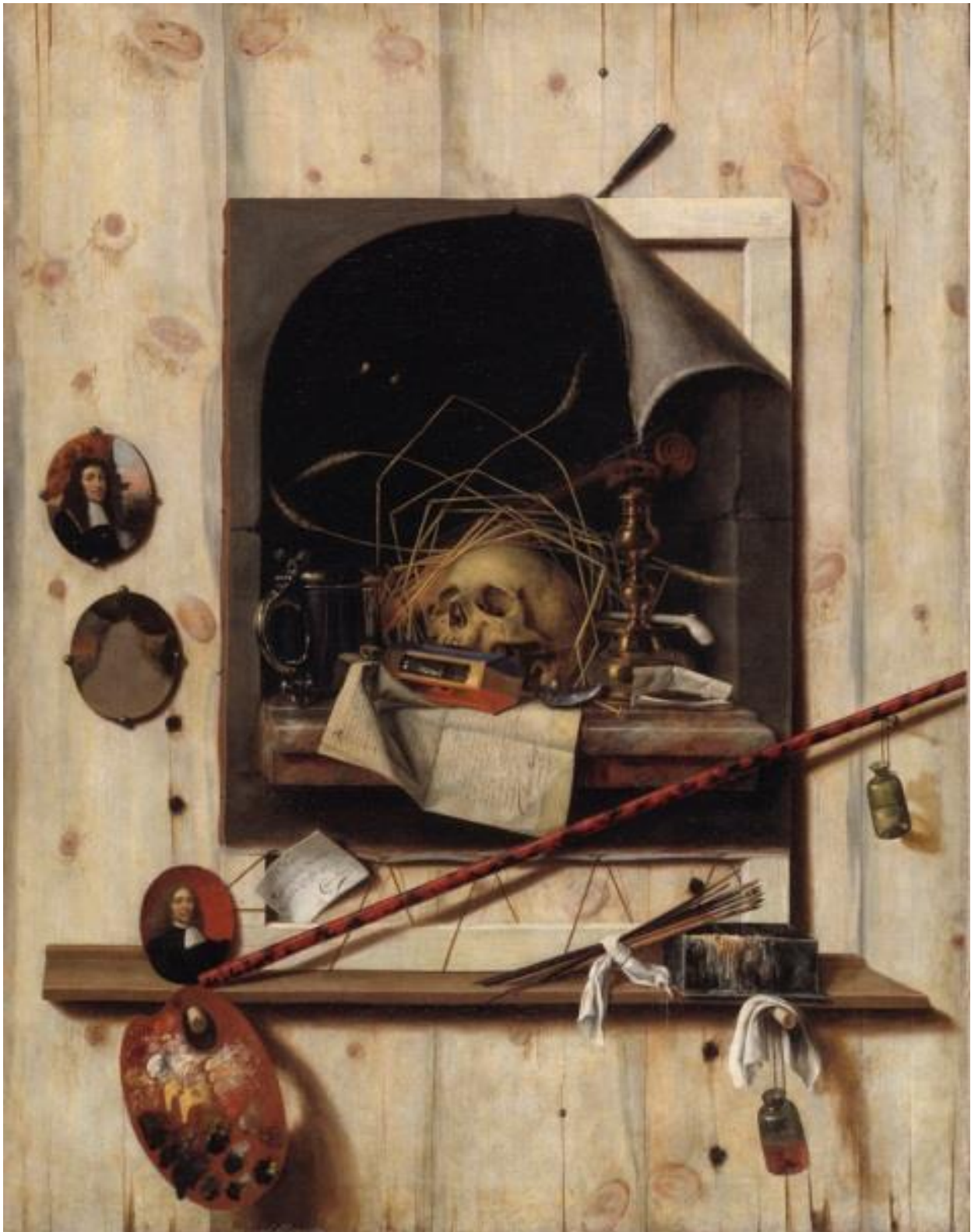
Εικ. 14. Cornelius Norbertus Gijsbrechts, Trompe l'oeil με νεκρή φύση στον τοίχο του εργαστηρίου , 1668, λάδι σε καμβά, 152 x 118 εκ., Statens Museum for Kunst, Κοπεγχάγη.