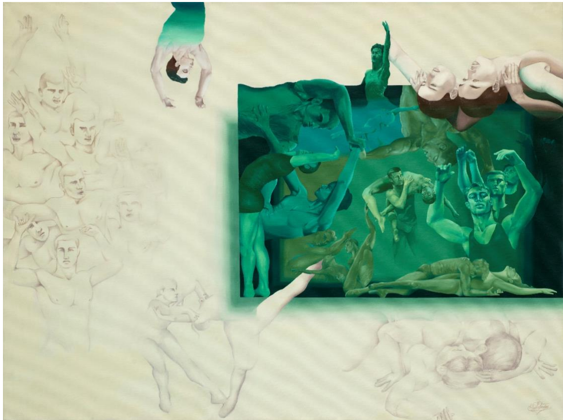
Λάδια, 130x100, 2022