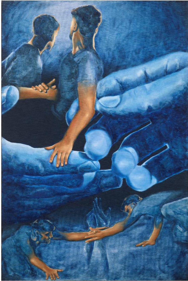
Λάδια, 120x80, 2024