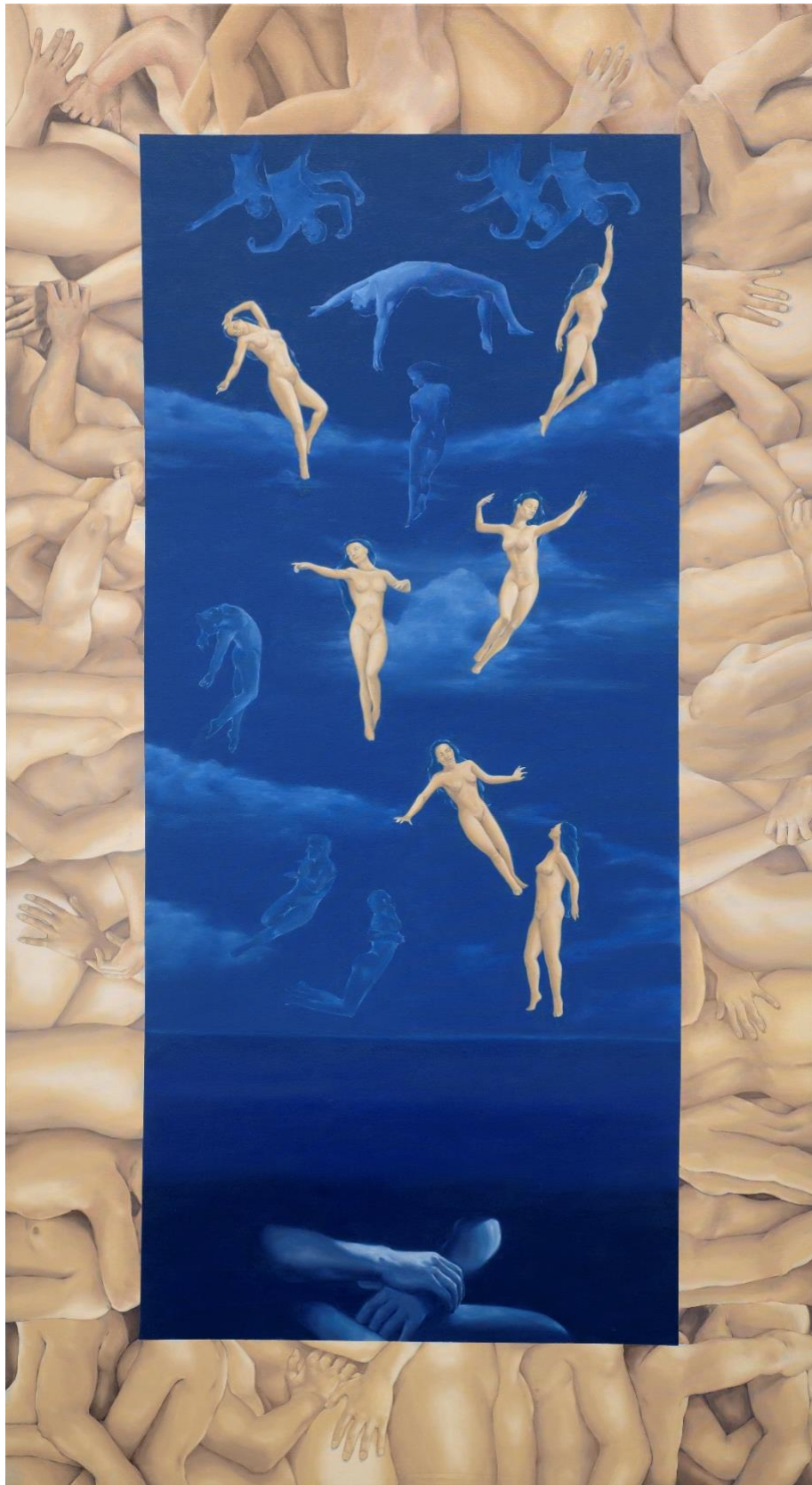
Λάδια, 195x100, 2024