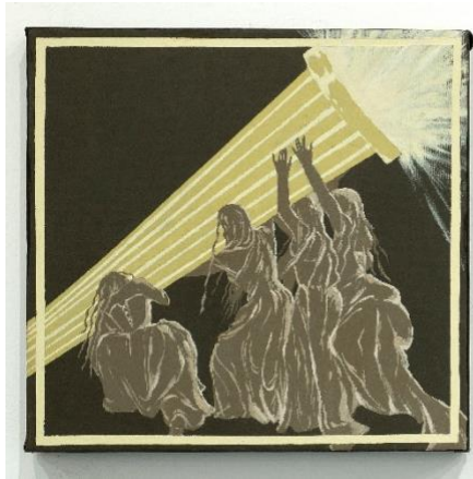
Ακρυλικά, 25x25 2021