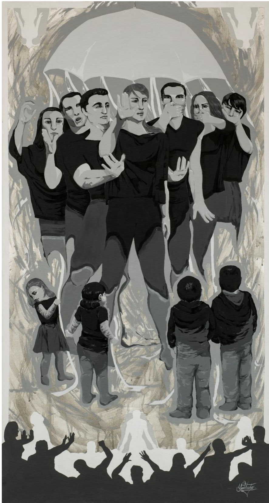
Ακρυλικά, 150x80, 2021