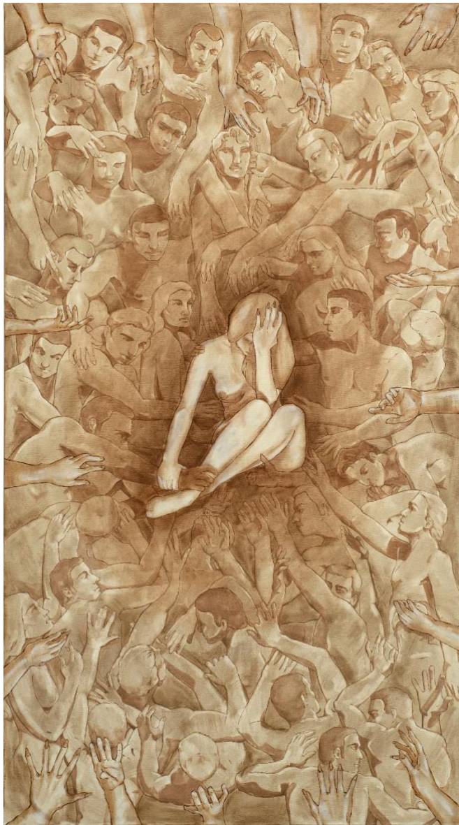
Λάδια, 180x100, 2024