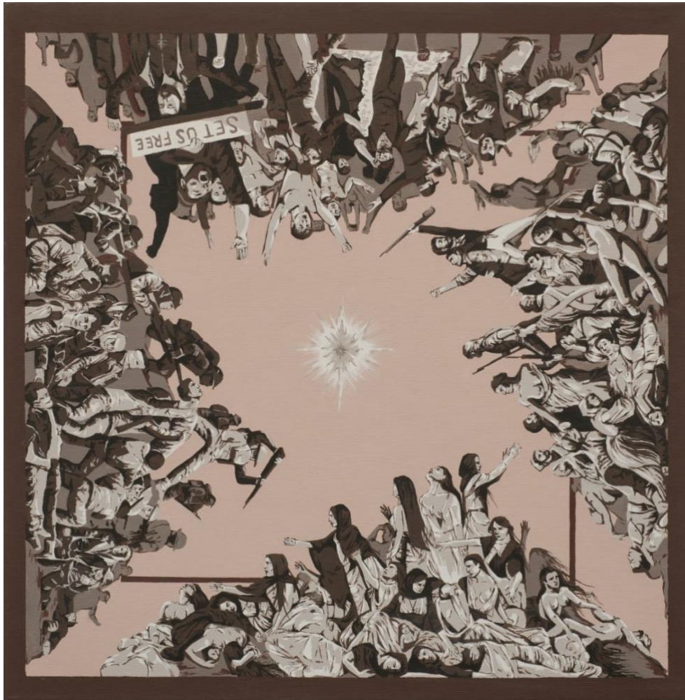
Ακρυλικά, 65x65, 2021