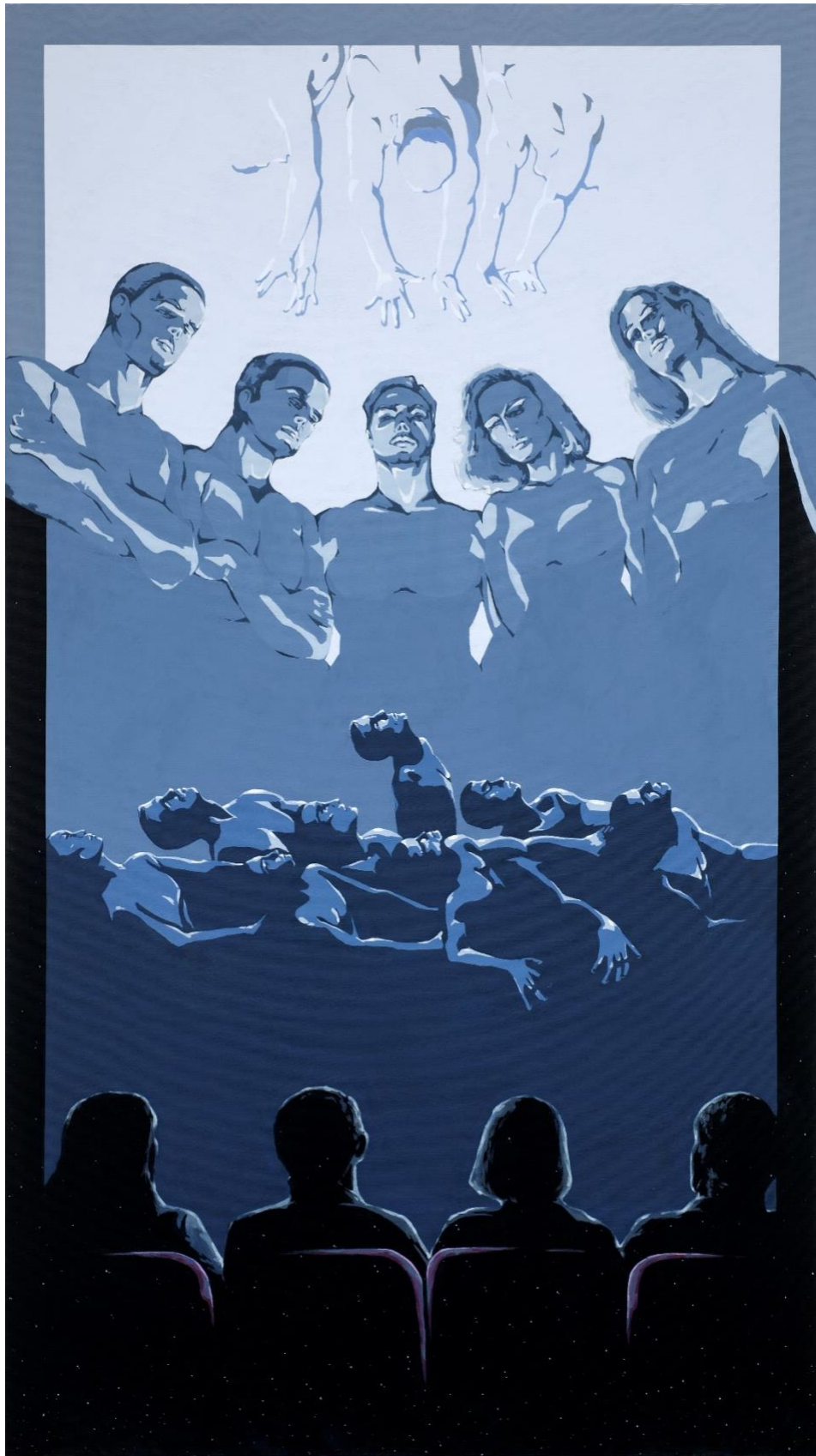
Ακρυλικά, 180x100, 2024