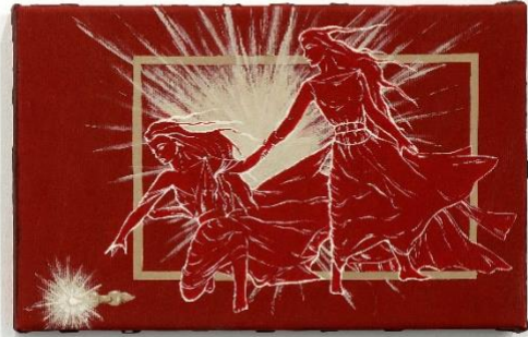
Ακρυλικά, 20x30, 2021