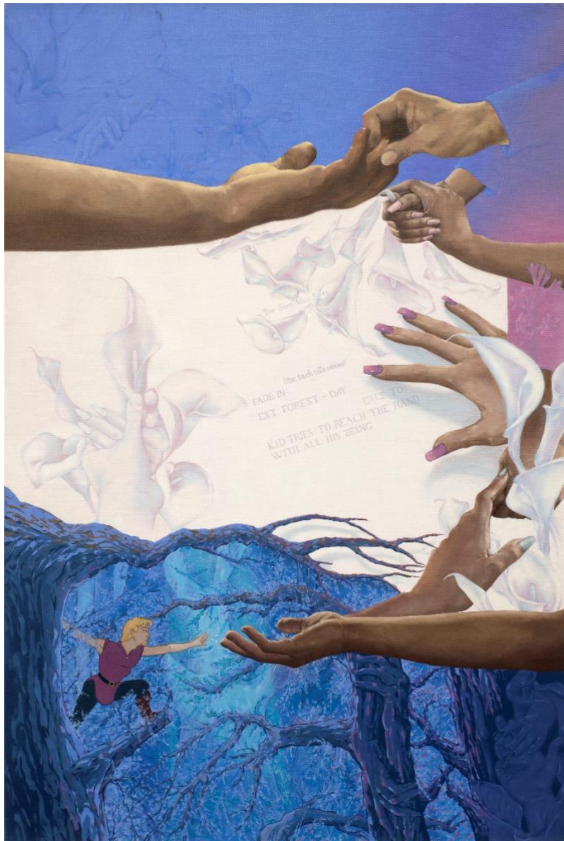
Λάδια, 120x80, 2024