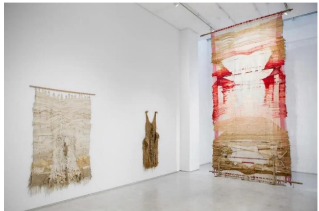
Εικόνα 13- Josep Grau-Garriga. February Light, 1978-81