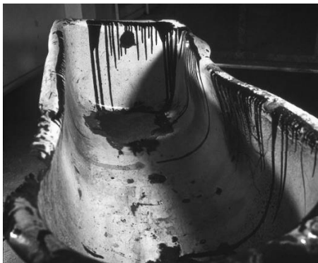
Εικόνα 4- Kenneth Kemble, Arte Destructivo , 1961