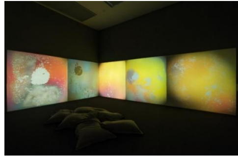
Εικόνα 7- Gustav Metzger, Liquid Crystal Environment, 1965