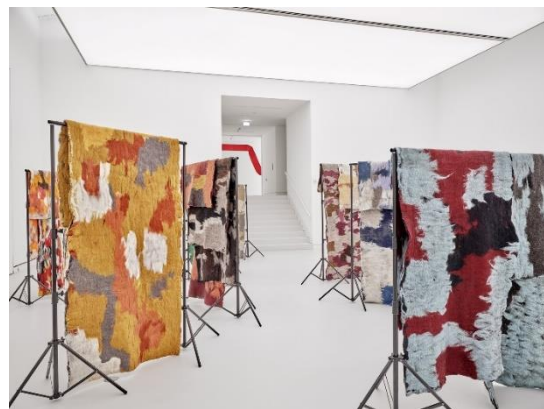
Εικόνα 15- Hana Miletić, Pieces, 2023