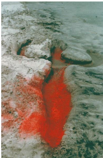
Εικόνα 2- Ana Mendieta, Silueta series , 1973- 1977