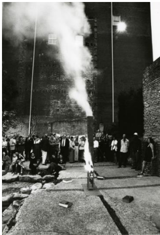
Εικόνα 8- John Latham, Skoob Tower, 1966-67