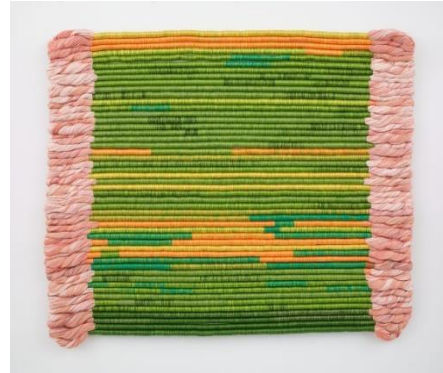
Εικόνα 11- Sheila Hicks