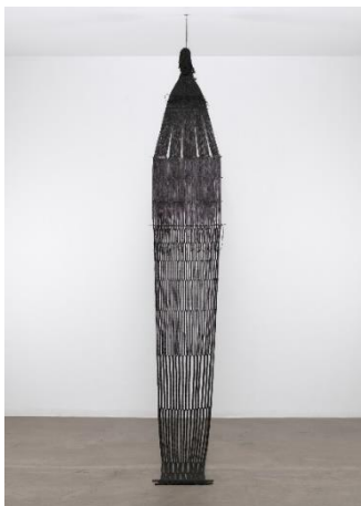
Εικόνα 14- Lenore Tawney, Shrouded River, 1966