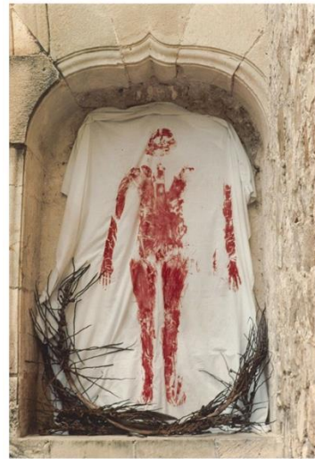
Εικόνα 3- Ana Mendieta, Silueta series , 1976