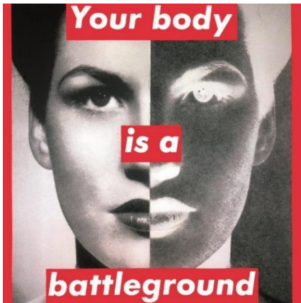
Εικόνα 1- Barbara Kruger, Untitled (Your body is a battleground) , 1989