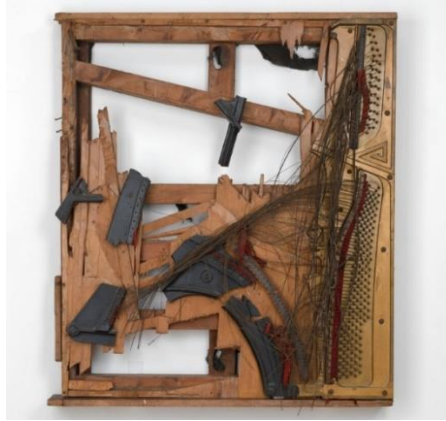
Εικόνα 6- Raphael Montañez Ortiz, Duncan Terrace Piano Destruction Concert, 1966