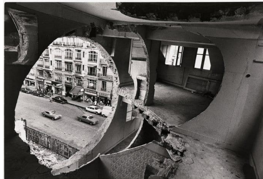
Εικόνα 9- Gordon Matta Clark, Anarchitecture, 1975