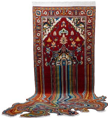
Εικόνα 12- Faig Ahmed, Liquid, 2014