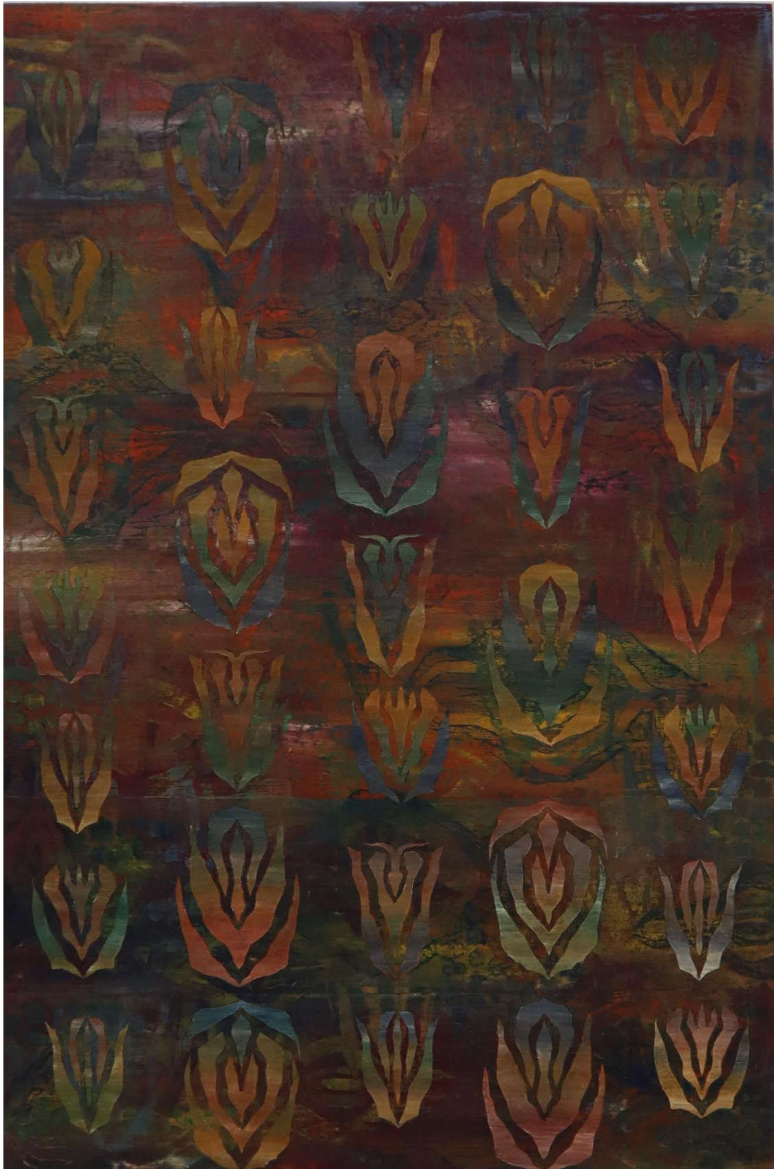
Χωρίς τίτλο, 2022 Λάδι σε μουσαμά 150 x 100 cm