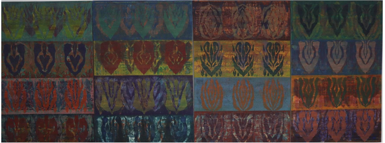
Χωρίς τίτλο, 2022 Λάδι σε μουσαμά 120 x 320 cm