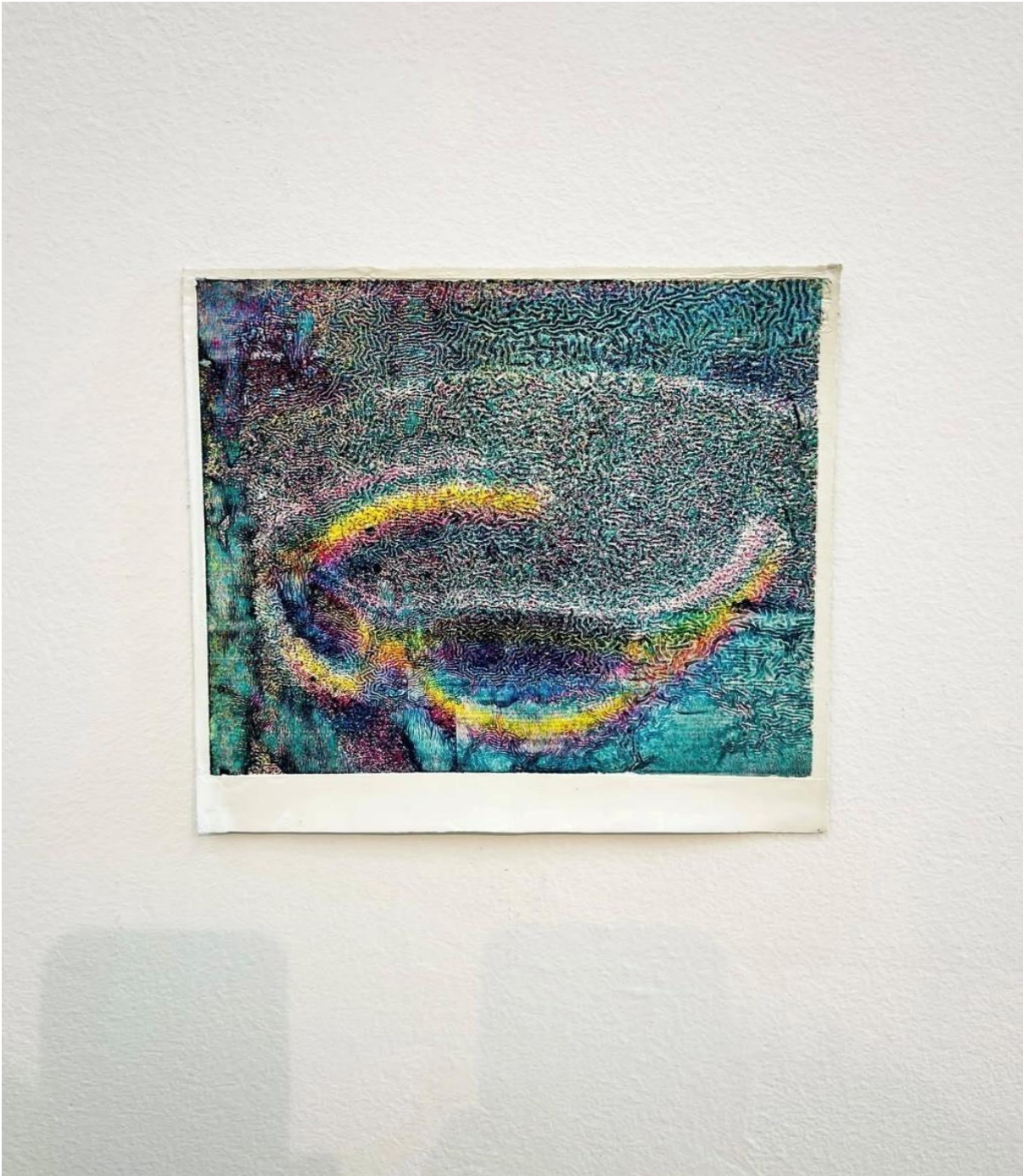
Εικόνα 4: I've Seen the Light and It's Dark