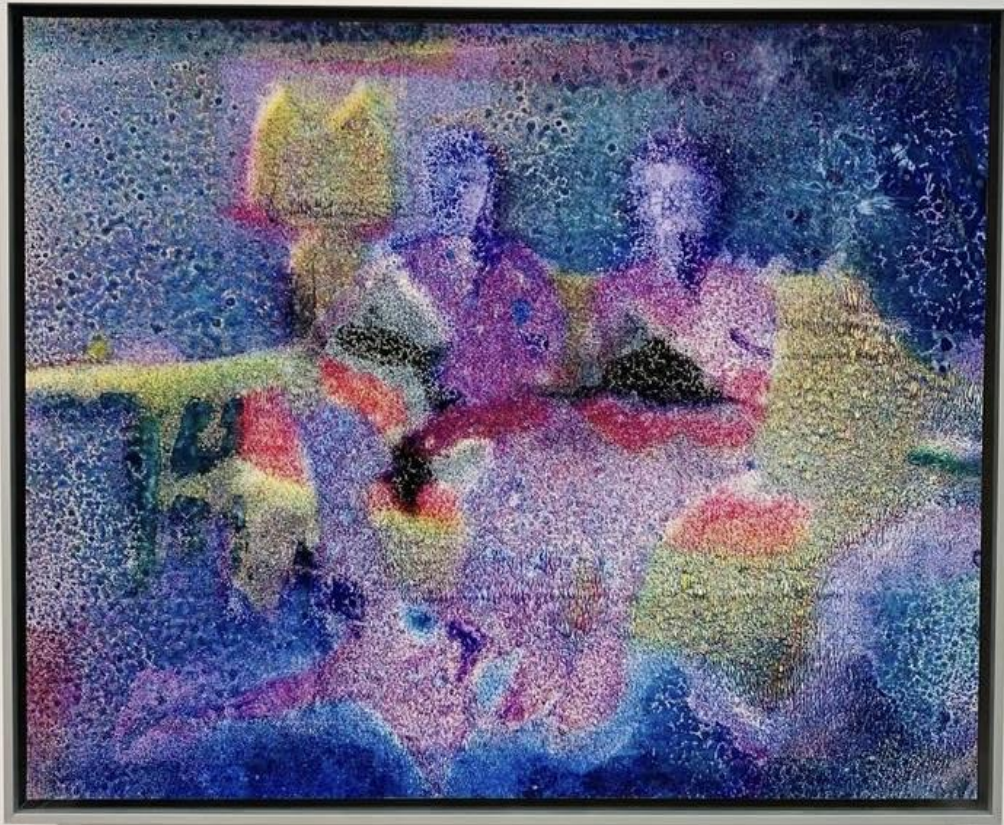
Εικόνα 2: Berlin&Bisenthal