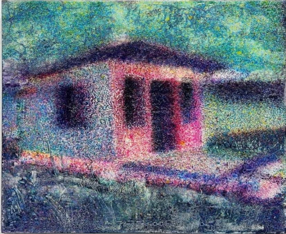
Εικόνα 1: BiginJapan (cover)