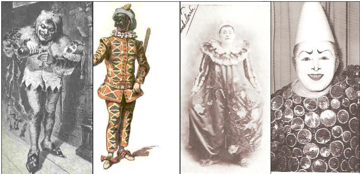
1) Αυλικός Τζέστερ, 19ος αι.