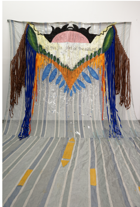
All this in part of the nature 200*350cm, acrylics and crepe paper on fabric (2024)