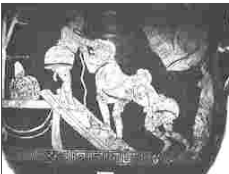
Αρχαίοι Ρωμαίοι Κλόουν, 4ος αι. Συλλογή Μάνσελ.