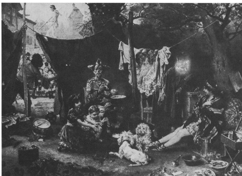
Λ.Κναυς. Vor und Hinter dem Vorhang (μπροστά και πίσω από την κουρτίνα), λάδι σε καμβά, 1880, Gemildegalerie, Δρέσδη.