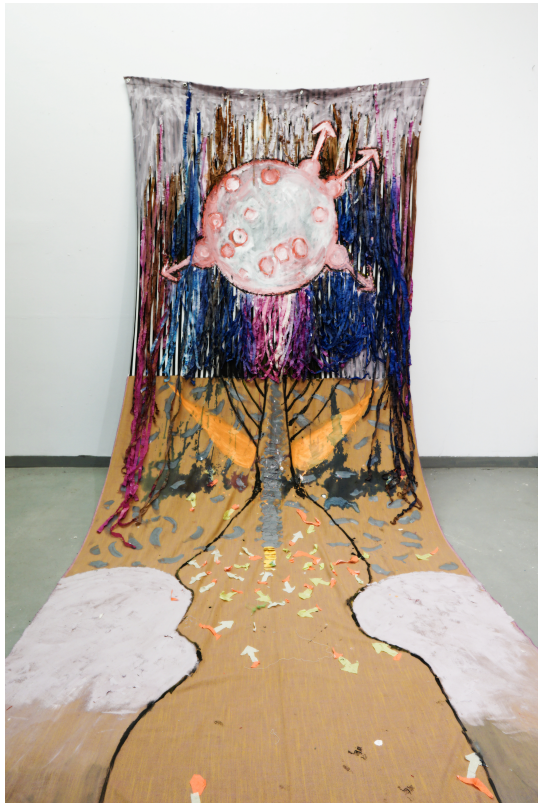
From the centre you have a different perspective 120*300cm, acrylics and crepe paper on fabric (2024)