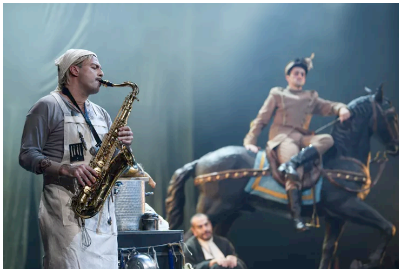
Μ.Μπρέχτ, Μάνα κουράγιο, σκην. Στ. Λιβαθινός, 2024/25,