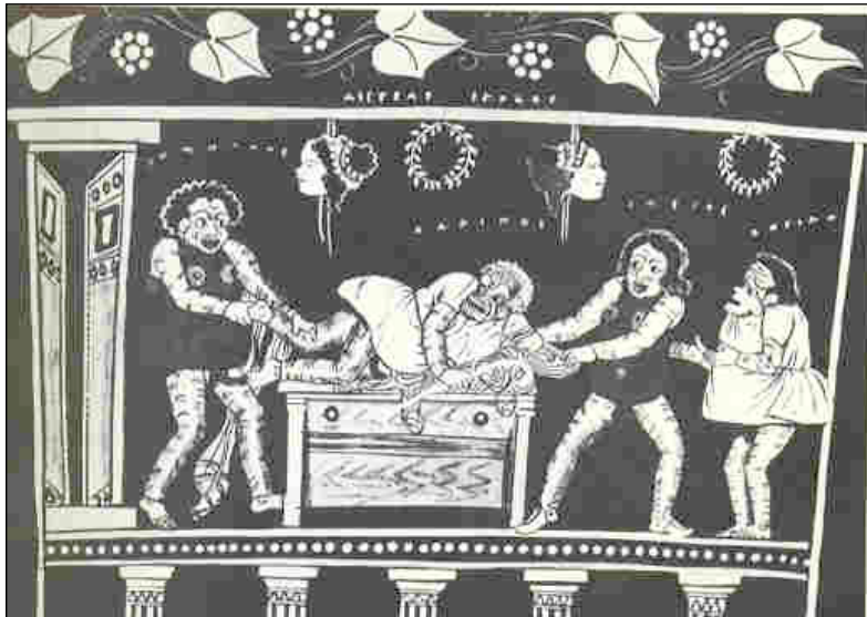
Η Ιστορία των Κλόουν από τον Κλόουν Μπλούι: Αρχαίοι Έλληνες Κλόουν από τις παραστάσεις που ονομάζονταν Φλύακες.