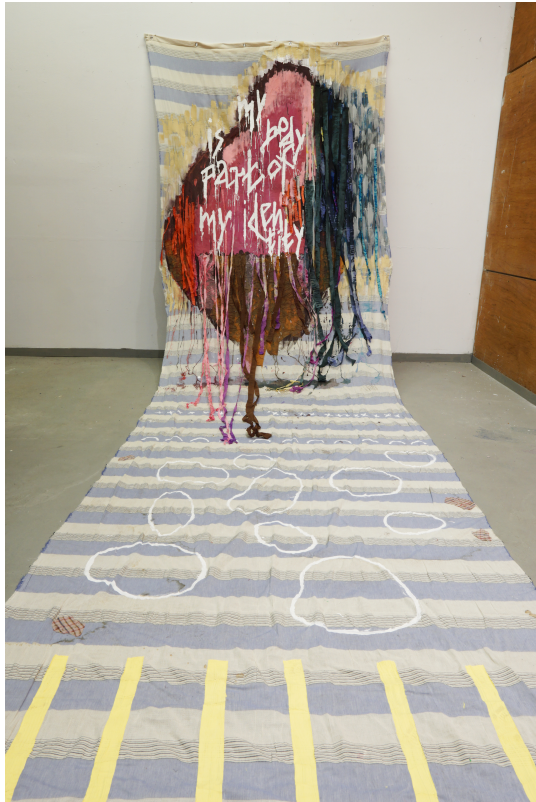
Is my body part of my identity

120*450cm, acrylics and crepe paper on fabric (2023)