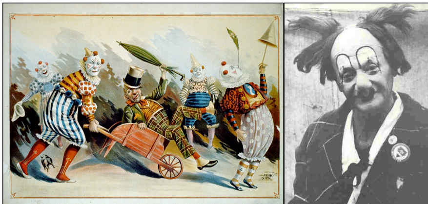
1) Πορτραίτο των κλόουν στο τσίρκο.