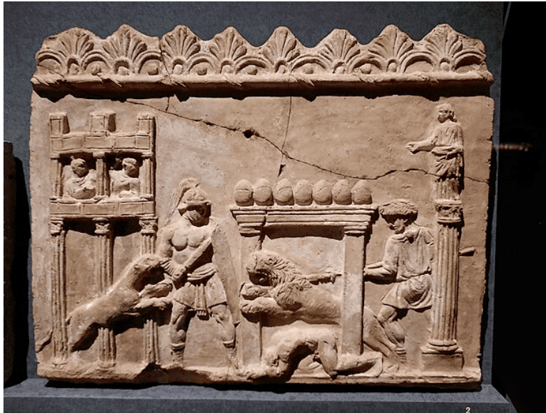
Circus Maximus. Αρχαία Ρώμη. Περίπου 6ος αι. μ.Χ.