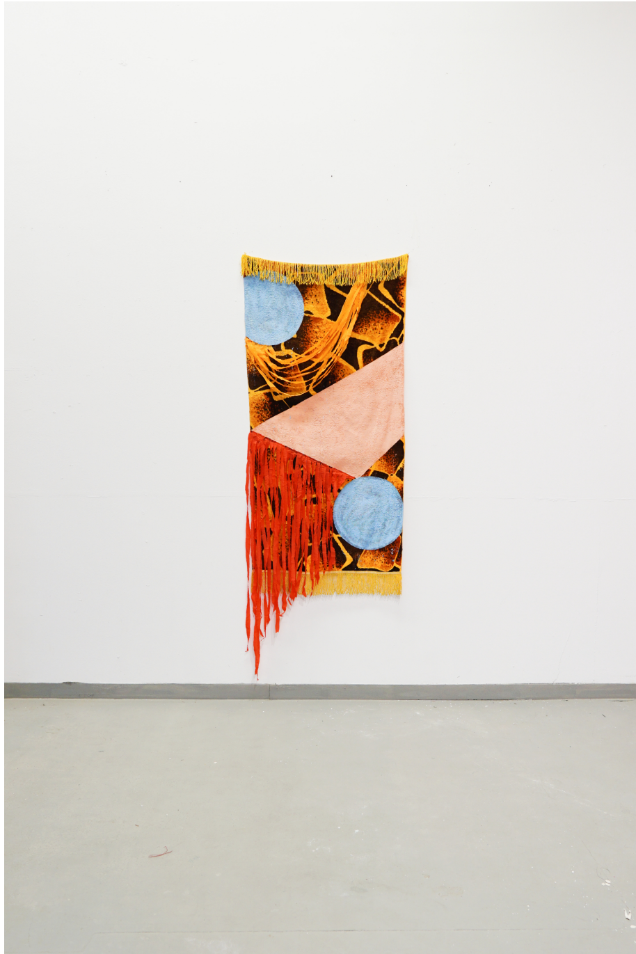
Soft but structured 50*80cm, acrylics and crepe paper on carpet (2024)