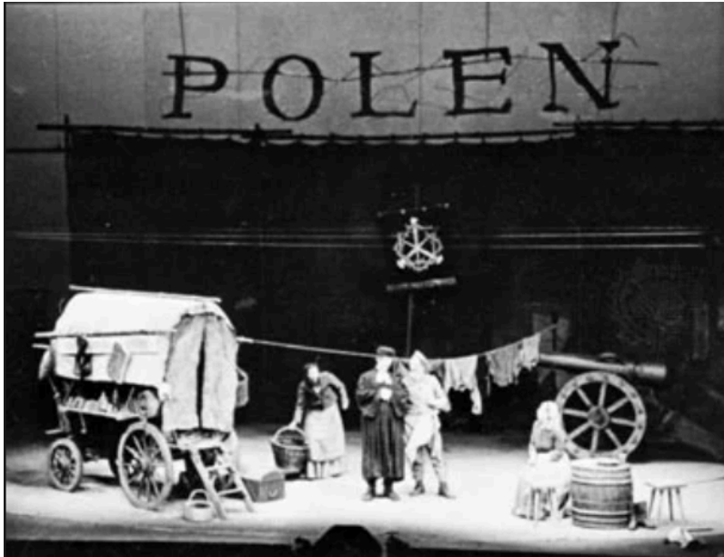
Μ.Μπρέχτ, Μάνα κουράγιο, πρώτη παράσταση 1941,